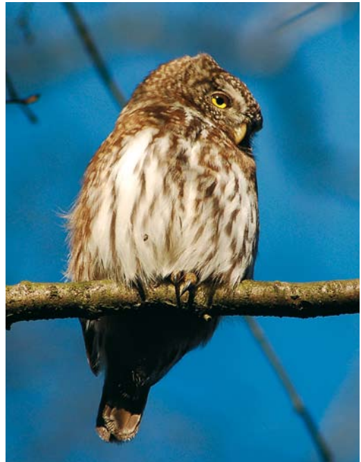
84 Dwerguil / Eurasian Pygmy Owl Glaucidium passerinum, Valkenswaard, Noord-Brabant, 10 februari 2008