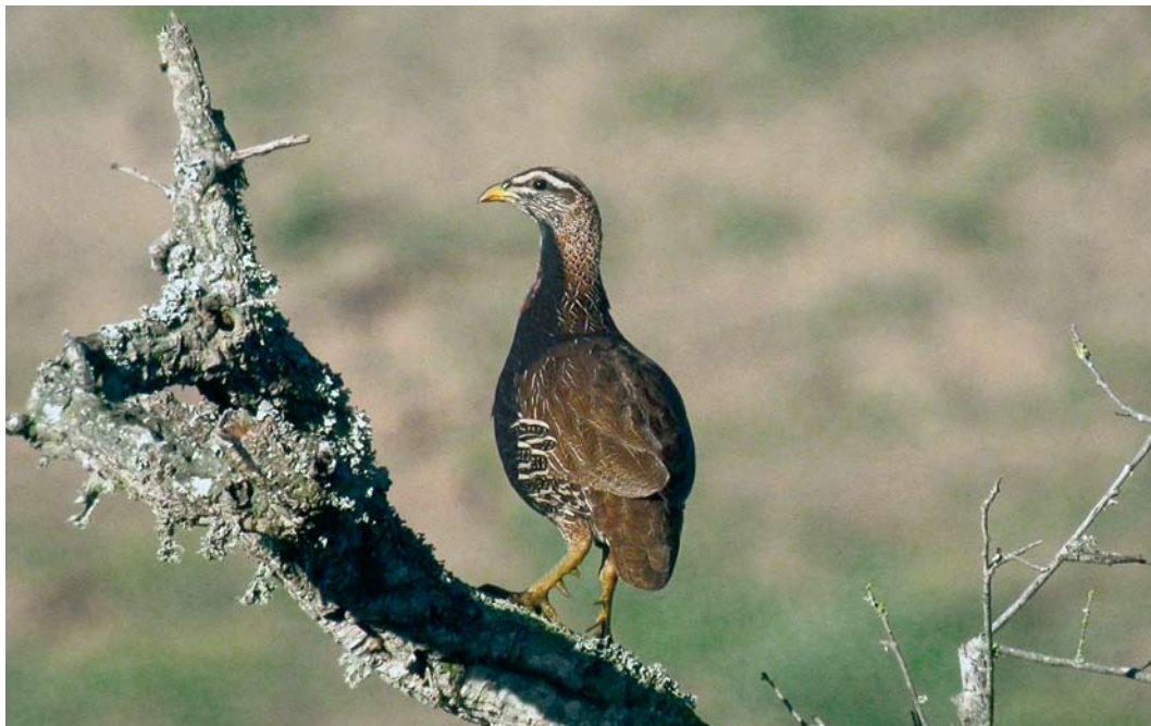
149 Double-spurred Francolin / Barbarijse Frankolijn Francolinus bicalcaratus ayesha , Sidi Bettache, Morocco, 2 March 2008