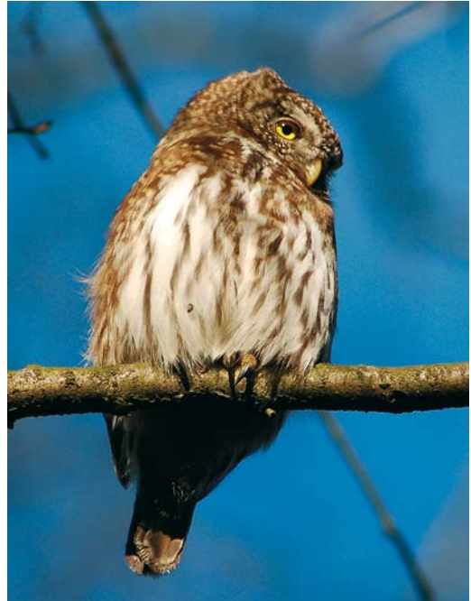
84 Dwerguil / Eurasian Pygmy Owl Glaucidium passerinum, Valkenswaard, Noord-Brabant, 10 februari 2008