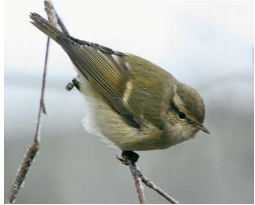
78 Humes Bladkoning / Hume's Leaf Warbler Phylloscopus humei , Gendringen, Gelderland, 21 december 2007 ( Lex Aalders )