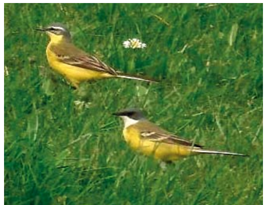
24 Italiaanse Kwikstaart / Ashy-headed Wagtail Motacilla cinereocapilla , mannetje, Flevocentrale, Flevoland, 22 april 2006 25-26 Italiaanse Kwikstaart / Ashy-headed Wagtail Motacilla cinereocapilla , mannetje, Flevocentrale, Flevoland, 22 april 2006 27 Italiaanse Kwikstaart / Ashy-headed Wagtail Motacilla cinereocapilla , mannetje (onder), met Gele Kwikstaart / Blue-headed Wagtail M flava , Flevocentrale, Flevoland, 22 april 2006

betref en nadat een aantal foto's was gemaakt werd de waarneming per semafoon doorgegeven als 'vrij zeker'. Toen de vogel enkele malen een raspende vluchtroep liet horen werd deze determinatie om c 13:30 in 'zeker' veranderd. Na enige tijd uit beeld te zijn geweest werd hij om c 15:30 teruggevonden door Edwin de Weerd en Peter van Wetter en de rest van de dag door enkele 10-tallen vogelaars bekeken. Ook deze vogel was de volgende dag verdwenen.