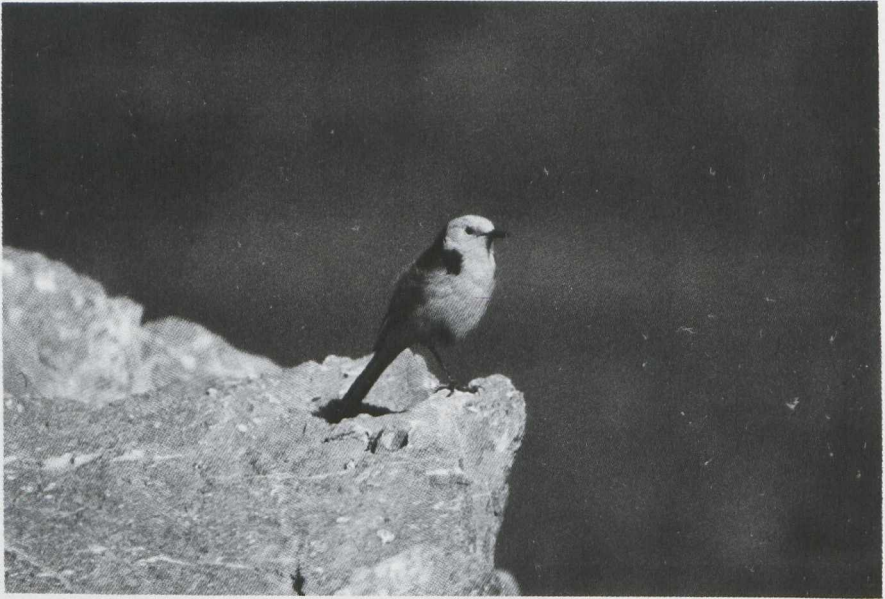
19. Male Black-backed Citrine Wagtail/Zwartrugcitroenkwikstaart Motacilla citreola calcarata , Afghanistan, May 1978 (Jan Steenhart)