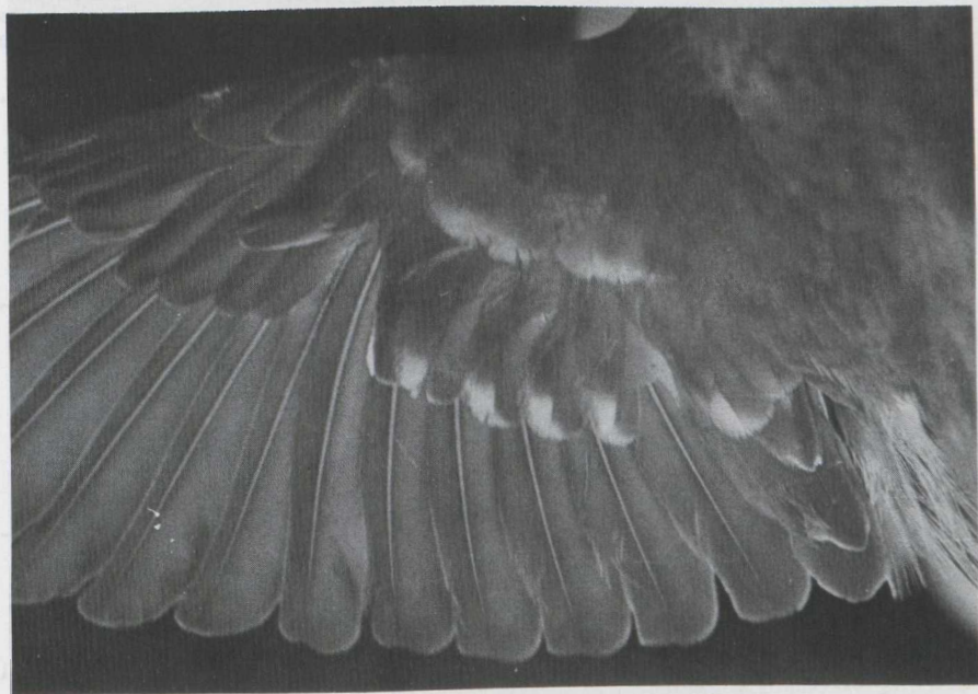
22-23. Crossbill/Kruisbek Loxia curvirostra , captured by J. Boel at Brasschaat (Antwerpen), Belgium on 25 September 1979 (Sjef de Ridder)