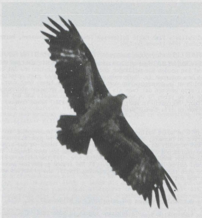
7. Pallas's Fish Eagle/Witbandzccarend Haliaeetus leucoryphus , immature, Mongolia, 1977 (Alan Kitson)

(1) AvdB and GO noticed a rather pale crown, nape and hindneck. They observed also a dark ear-mark running towards the neck. AK - who studied some 'young' birds in Mongolia - speaks of an Osprey Pandion haliaetus -like mask. Two 'sub-adult' birds in the collection of the Zoölogisch Museum (ZMA) at Amsterdam (Noord-Holland) show a similar mask. (2) According to AK Pallas's Fish Eagle has a relatively short neck. Cramp & Simmons (1980) state however the opposite.