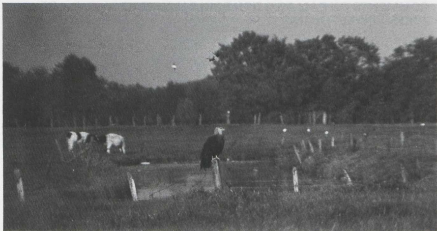
6. Witbandzeearend/Pallas's Fish Eagle Haliaeetus leucoryphus , volwassen, Barneveld (Gld), 12 oktober 1976

(In verband met de vraag of de vogel wild is of niet, kan men zich afvragen welke waarde toegekend kan worden aan meldingen door personen of instanties dat een bepaalde vogel bij hen ontsnapt is. Verkeerde naamgevingen (al of niet opzettelijk) aan verhandelde en in gevangenschap verblijvende dieren komen veel voor. In dit verband zij erop gewezen dat twee als Witbandzeearend vermelde voorwerpen op de lijst van de in de jaren 70 in Nederland geprepareerde vogels van het Ministerie voor Cultuur, Recreatie en Maatschappelijk Werk (MCRM) beide foutief gedetermineerd bleken te zijn (Anton Bruijn pers. med. ).)