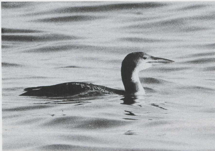
4. IJsdruiker/Great Northern Diver Gavia immer , IJmuiden (NH), 11 maart 1978 (Ulco Glimmerveen)

De vis in de bek van de IJsdruiker is een zeedonderpad Myoxocephalus scorpius . Dit is een nogal benige bodemvis met een grote kop die bezet is met stekels. Hij is algemeen langs de Nederlandse en Belgische kust, voornamelijk in ondiep water bij pieren en dijken. De IJsdruiker die van 18 februari tot en met 8 april 1978 bij de pieren van IJmuiden (NH) verbleef, ving deze visse soort regelmatig maar hij voedde zich ook met krabben en jonge platvissen. De foto (plaat 51, hier verkleind herhaald) is genomen door Ulco Glimmerveen op 11 maart 1978; plaat 4 toont de zelfde vogel.