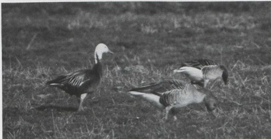
24. Snow Goose/Sneeuwganzen Anser caerulescens , blue phase, Plaat van Scheelhoek, Goeree (Zuid-Holland), 22 March 1980

The occurrence of Snow Geese/Sneeuwganzen Anser caerulescens was quite remarkable. Apart from the usual one or two among the Pink-footed Geese/Kleine Rietganzen Anser brachyrhynchus at Oudega (Friesland) and the few odd ones elsewhere, six stayed at Eijsden (Limburg) during January-February, no less than 30 on 11 February near Fochteloo (Friesland) and 18 (including one blue phase) from 18 until 21 April at Andijk (Noord-Holland). The well known blue phase bird at the Plaat van Scheelhoek, Goeree (Zuid-Holland) is still present.