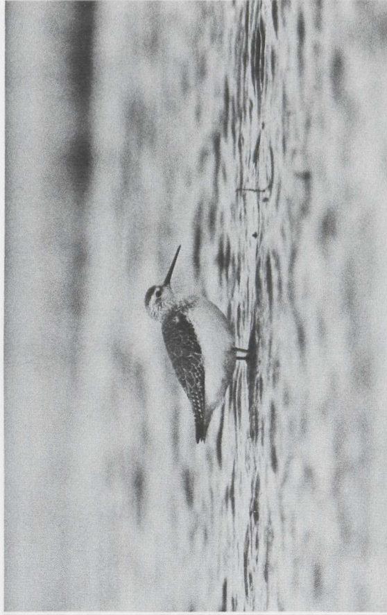
1953. A male shorebird (likely a sandpiper) standing on a sandy beach. The bird is facing left. The background is a blurred expanse of sand and water.