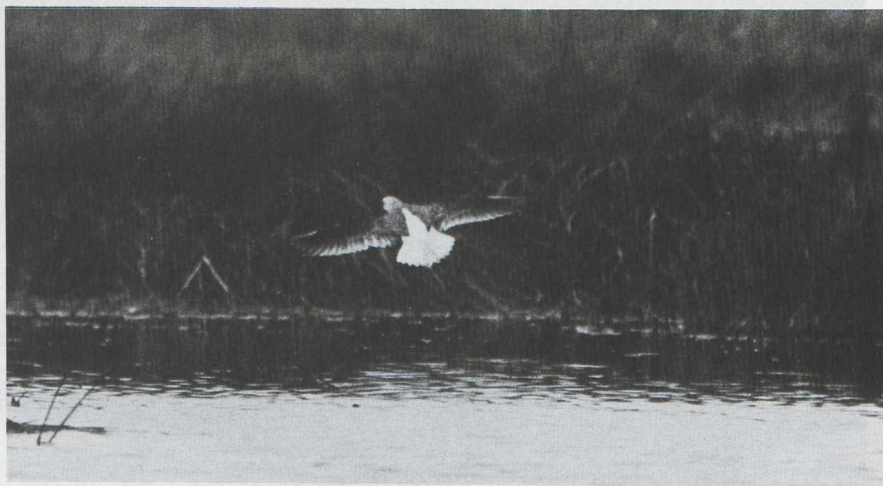
9-12. Poelruiter/Marsh Sandpiper Tringa stagnatilis , Spaarnwoude (NH), 24 september 1979 (Jan Mulder)