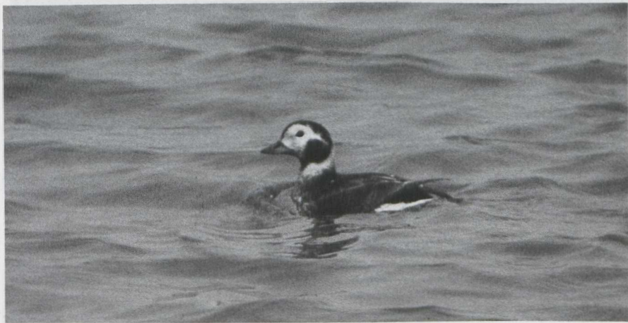
25. Long-tailed Duck/IJseend Clangula hyemalis , Lelystadhaven, Oostelijk Flevoland (Zuidelijke IJsselmeerpolders), 16 March 1980 (René Pop)