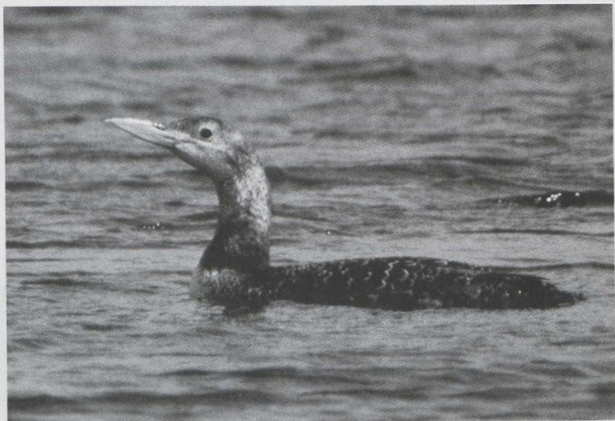
1-3. Geelsnavelduiker/White-billed Diver Gavia adamsii , tweede kalenderjaar, Nederhorst den Berg (NH), 1 maart, 31 maart, 4 april 1980