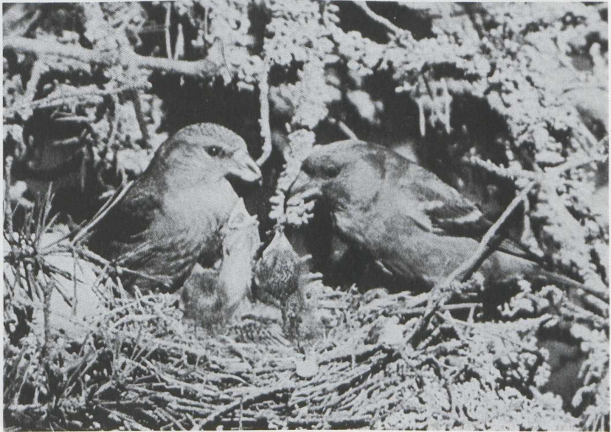
20. Crossbills/Kruisbekken Loxia curvirostra , Finland. Note the prominent wing-bars of the male ( Lasse Laine )

We examined skins in the Rijksmuseum van Natuurlijke Historie (RMNH) at Leiden (Zuid-Holland) in order to evaluate the above five characters. We studied 36 male Crossbills and seven male and four female Eurasian Two-barred Crossbills L. l. bifasciata . (1) Crossbill can show prominent whitish wing-bars and whitish fringed tertials. This wing-pattern can strongly resemble that of female Two-barred Crossbill with reduced white. (2) Male Two-barred Crossbill can be identical in colour with Crossbill. (3) Male Two-barred Crossbill can miss the dark mantle and shoulders. (4) Two-barred Crossbill and Crossbill are identical in size. (5) Size and shape of bill of Two-barred Crossbill and Crossbill strongly overlap. (It should however be noted that North American Two-barred Crossbill L. l. leucoptera is smaller and has a smaller and finer bill.)