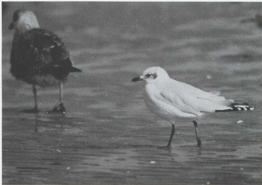
5. Raadselvogel 4/Mystery bird 4. Oplossing in het volgende nummer/Solution in the next issue