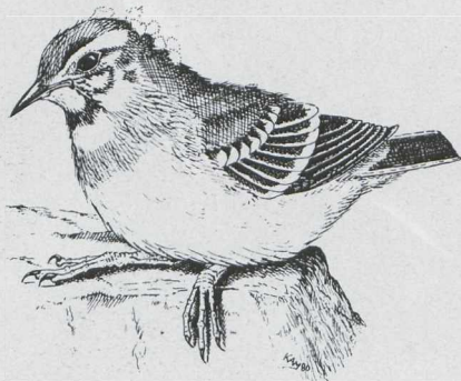
Figure 1. Nestling Black-backed Citrine Wagtail/Zwartrugcitroenkwikstaart Motacilla citreola calcarata , Ladakh, Kashmir, 21 July 1978 (Karel Mauw after sketch by Norman van Soestem)

A description of a nestling with comment is given first. Then a description is given of the plumage of a fledged young.