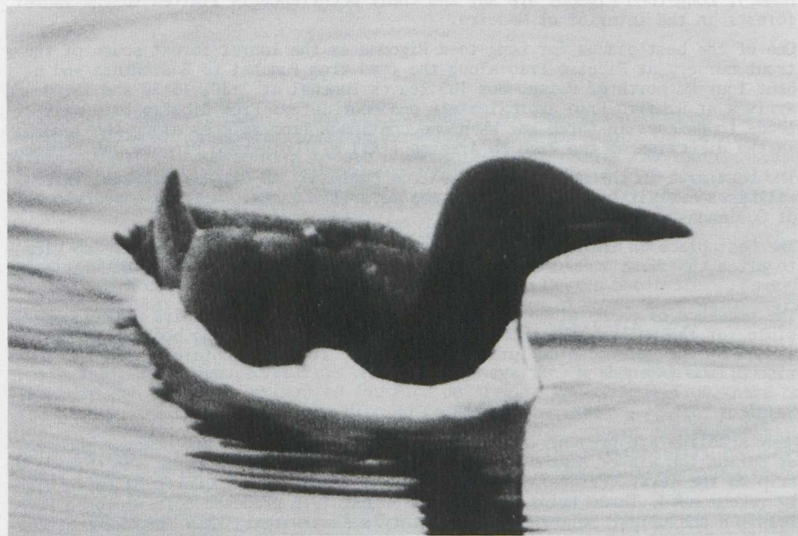
15. Brännich's Guillemot/Dikbekzeekoet Uria lomvia , Edgeøya (Spitsbergen), Norway, 26 July 1977 (Arnoud van den Berg REES 1977)

Arnoud B. van den Berg, Duinlustparkweg 98, 2082 EG Santpoort-Zuid