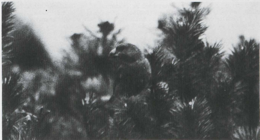
67. Parrot Crossbill/Grote Kruisbek Loxia pytyopsittacus , AW-duinen (Noord-Holland), 24 March 1963 ( Hans Vader )

J.J. (Han) Blankert, Leendert Meeszstraat 8, 2015 JS Haarlem