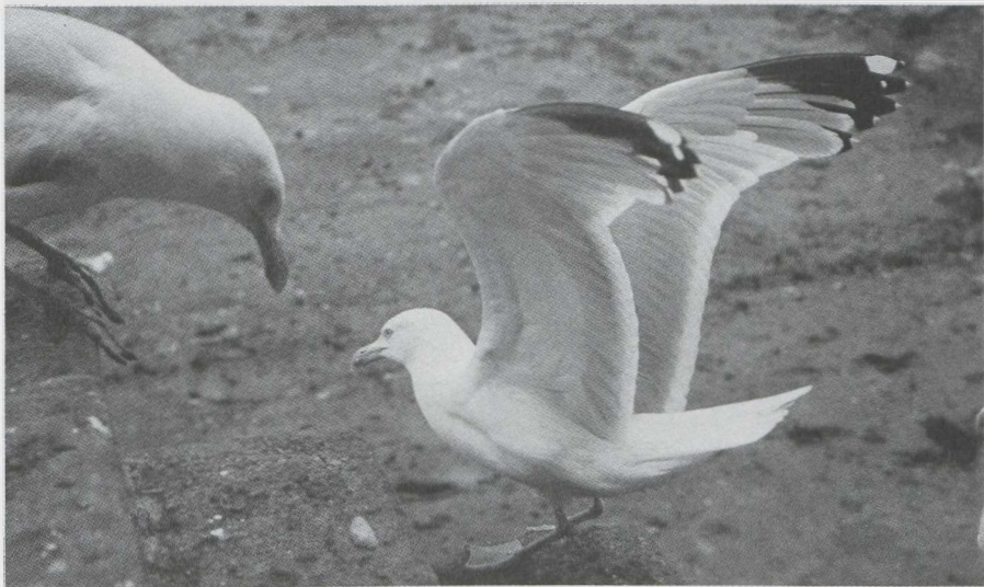
59. Britse Zilvermeeuw/British Herring Gull Larus argentatus argenteus , Brixham (Devon), Engeland, juli 1979

De bepaling van de mantelkleur levert in het veld grote problemen op. Er zijn diverse factoren welke een nauwkeurige bepaling in de weg staan. In dit verband kunnen worden genoemd: de positie van de meeuw ten opzichte van de zon en de waarnemer, de houding van de meeuw, de kleur van de omgeving en de atmosferische omstandigheden. Verder dient men zich te realiseren dat bij de hier behandelde meeuwen aanzienlijke verschillen in mantelkleur kunnen optreden. Tenslotte dient erop te worden gewezen dat waarnemers bestaande kleurverschillen niet op de zelfde wijze interpreteren. (In navolging van Landsborough Thomson (1964) gebruik ik het woord 'mantel' voor het aaneengesloten geheel van rug-, schouder- en vleugeldekveren uitsluitend wanneer dat uit één kleur bestaat.)