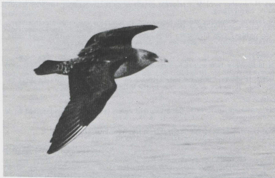
58. Pomarine Skua/Middelste Jager Stercorarius pomarinus , first calendar year, Lake Mead, Clark County (Nevada), USA, 24 November 1976

Gerald J. OreeI, Postbus 51273, 1007 EG Amsterdam