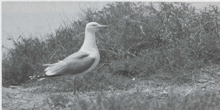
62. Mediterrane Geelpootmeeuw/Mediterranean Yellow-legged Gull Larus cachinnans michahellis , Isles Chaffarines, Marokko, mei 1977

De herkenning van jonge en onvolwassen Geelpootmeeuwen wordt in het algemeen moeilijker geacht dan het in feite is. Opvallend bij eerste kalenderjaar vogels is de gemberbruine kleur van de donkere delen (donkerder dan bij de Zilvermeeuw), de wittere stuit en staartbasis welke contrasteert met de brede zwarte staartband, en de geheel zwarte snavel. In het tweede kalenderjaar worden kop en onderdelen in vergelijking met een Zilvermeeuw erg wit waardoor de vogels mede door de vrij donkere mantel en snavel veel weg hebben van een tweede kalenderjaar Grote Mantelmeeuw L. marinus (cf. Grant 1980).