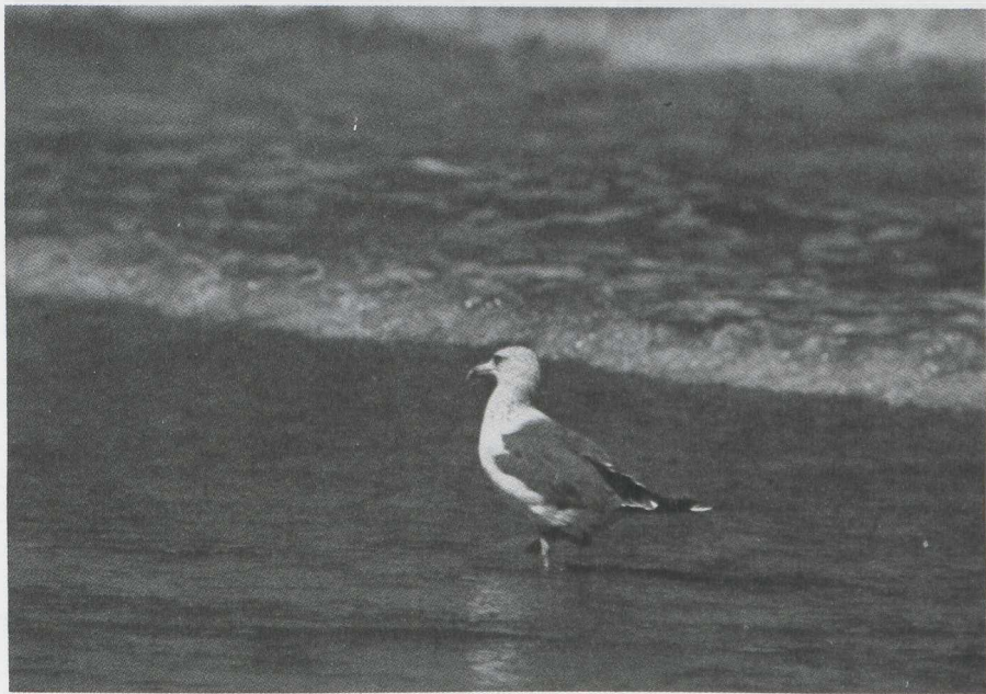
61. Larus cachinnans taimyrensis , Malindi, Kenya, januari 1980 (Jan Mulder)

Barth (1968) suggereerde een verband tussen de aanwezigheid en intensiteit van de wintervlekking en de leeftijd van de vogel.