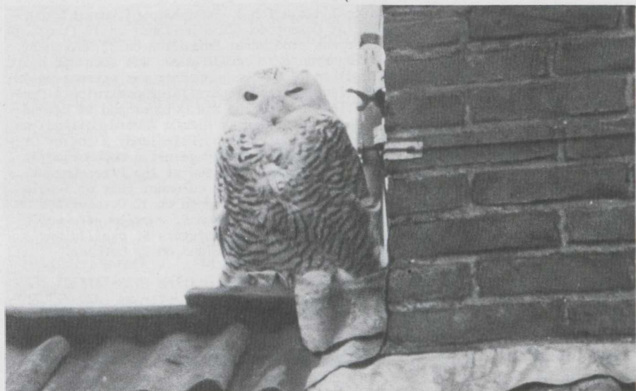
69-71. Snowy Owl/Sneeuwuil Nyctea scandiaca , first year female, Oenkerk (Friesland), 29 December 1980 ( Piet Munsterman ); Yellow-browed Warbler/Bladkoninkje Phylloscopus inornatus , Schiermonnikoog (Friesland), 3 October 1980 ( André van Loon ); Pine Bunting/Witkopgors Emberiza leucocephalos , adult male, Brasschaat (Antwerpen), 1 November 1980 ( Sjef de Ridder )