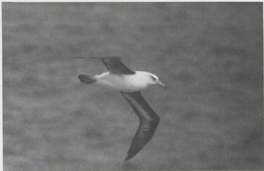
56-57. Wenkbrauwalbatros/Black-browed Albatross Diomedea melanophris , Friendship Islands, 25 november 1975