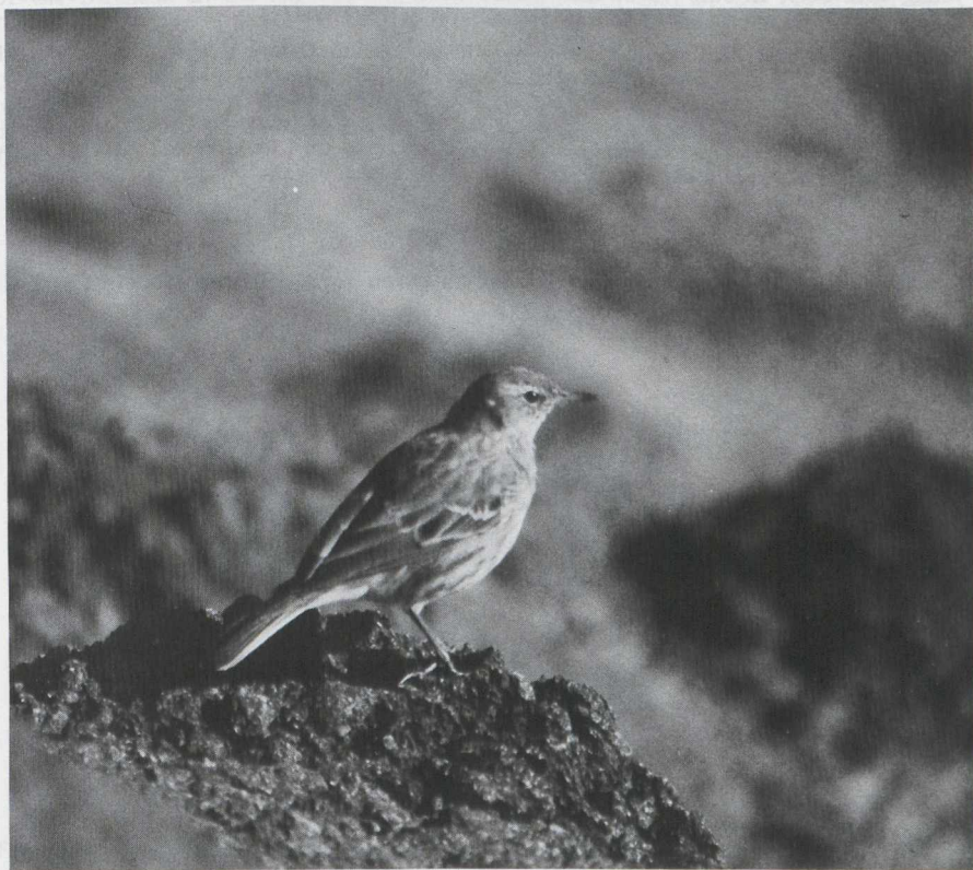
17. Water Pipit/Waterpieper Anthus spinoletta , IJmuiden (Noord-Holland), 1 March 1980

Water Pipit Anthus spinoletta and Rock Pipit Anthus petrosus are separate species according to the Dutch Birding Association checklist (G.J. Oreeel in preparation). Editors