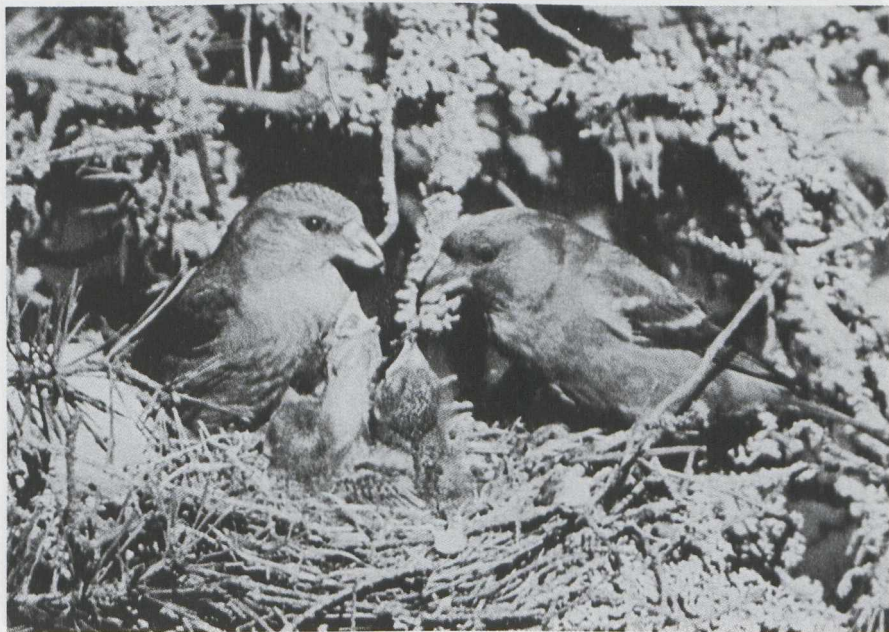
20. Crossbills/Kruisbekken Loxia curvirostra , Finland. Note the prominent wing-bars of the male

We examined skins in the Rijksmuseum van Natuurlijke Historie (RMNH) at Leiden (Zuid-Holland) in order to evaluate the above five characters. We studied 36 male Crossbills and seven male and four female Eurasian Two-barred Crossbills L. l. bifasciata . (1) Crossbill can show prominent whitish wing-bars and whitish fringed tertials. This wing-pattern can strongly resemble that of female Two-barred Crossbill with reduced white. (2) Male Two-barred Crossbill can be identical in colour with Crossbill. (3) Male Two-barred Crossbill can miss the dark mantle and shoulders. (4) Two-barred Crossbill and Crossbill are identical in size. (5) Size and shape of bill of Two-barred Crossbill and Crossbill strongly overlap. (It should however be noted that North American Two-barred Crossbill L. l. leucoptera is smaller and has a smaller and finer bill.)