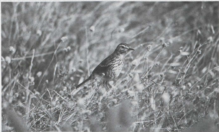
16. Berthelot's Pipit/Berthelots Pieper Anthus berthelotii , Madeira, July 1976 (Rombout de Wijs)

near Bugio. The best time is just before sunset. In the late afternoon and early evening of 21 March 1976 at least 12 were seen flying to Bugio. The Desertas (Chao, Deserta Grande and Bugio) are uninhabited. Only during the tourist season boat-trips are organized to the Desertas. One should inquire with the Organizaçao Nautica 'Amigos do Mar' at the town pier in Funchal or with the Tourist Office.