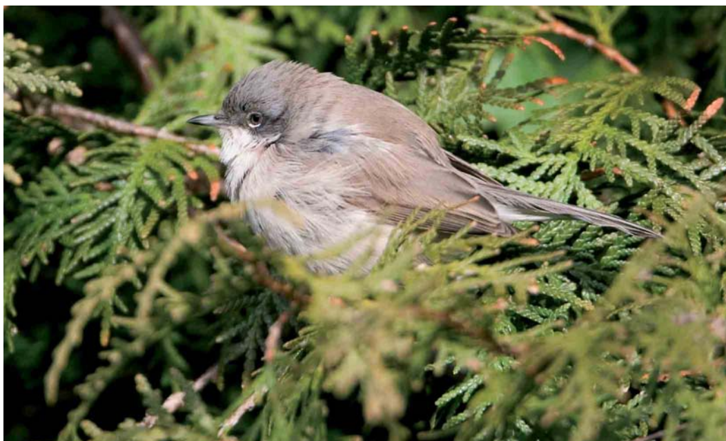
183 Vale Braamsluiper / Siberian Lesser Whitethroat Sylvia curruca halimodendri , Vinkhuizen, Groningen, Groningen, 16 februari 2007 (Roland Jansen)

SIBERIAN LESSER WHITETHROAT From 31 December 2005 to 12 April 2006, a presumed Siberian Lesser White-throat Sylvia curruca halimodendri wintered in a suburban garden at Groningen, Groningen, the Netherlands. On 4 January 2006, it was trapped and ringed, and a few feathers were collected for DNA analysis. Surprisingly, the bird returned to the same garden on 2 November 2006 and remained at least into March 2007. The results of the analysis of the mitochondrial cytochrome-B gen and comparisons with sequences obtained from other lesser whitethroat taxa, including individuals at Landsort, Sweden (30 October-30 December 2000), North Ronaldsay, Orkney, Scotland (17 October 2003) and Aberdeen, Scotland (5-21 December 2004), became available in December 2006. The genetical results confirmed that the bird is not a nominate Lesser Whitethroat S. c. curruca but that it is not a 'classic' halimodendri either, being part of a population of which the breeding area is unknown. It also appears that the individuals from Landsort and Orkney belong to the same population, while the one at Aberdeen is a classic halimodendri . On 5 February 2007, the bird was trapped again to obtain more biometrics, and the wing formula data also confirm that it belongs to the halimodendri group.