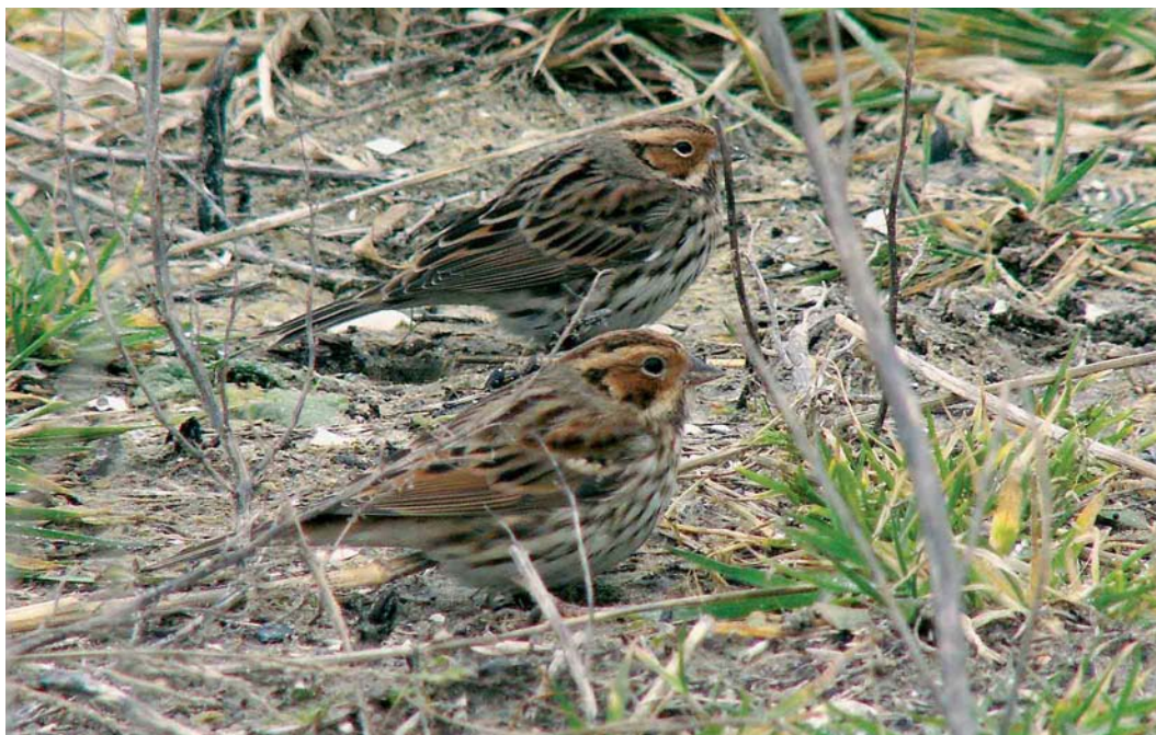
174 Dwerggorzen / Little Buntings Emberiza pusilla , Katwijk aan Zee, Zuid-Holland, 18 februari 2007