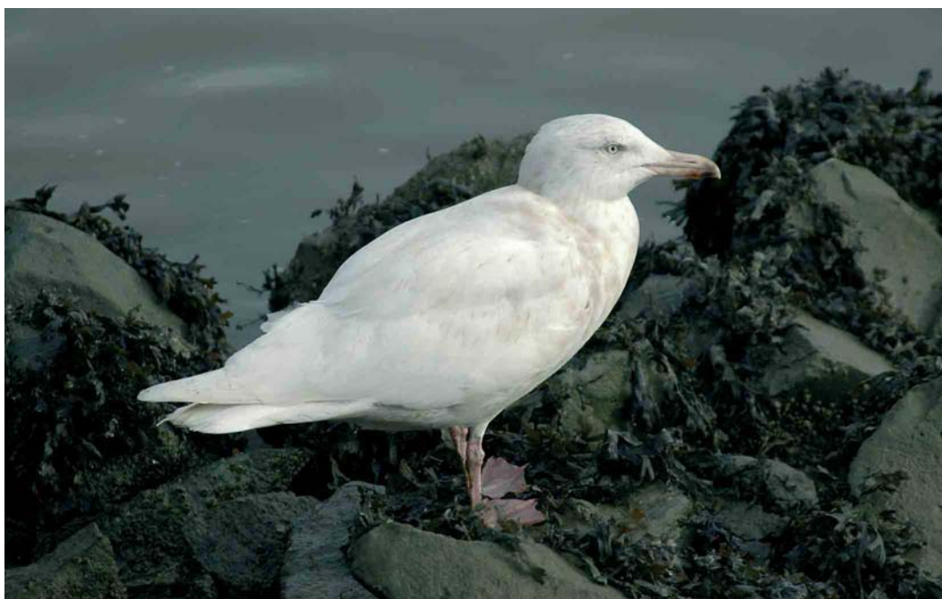
156 Grote Burgemeester / Glaucous Gull Larus hyperboreus , tweede-winter, Stellendam, Zuid-Holland, 22 januari 2007