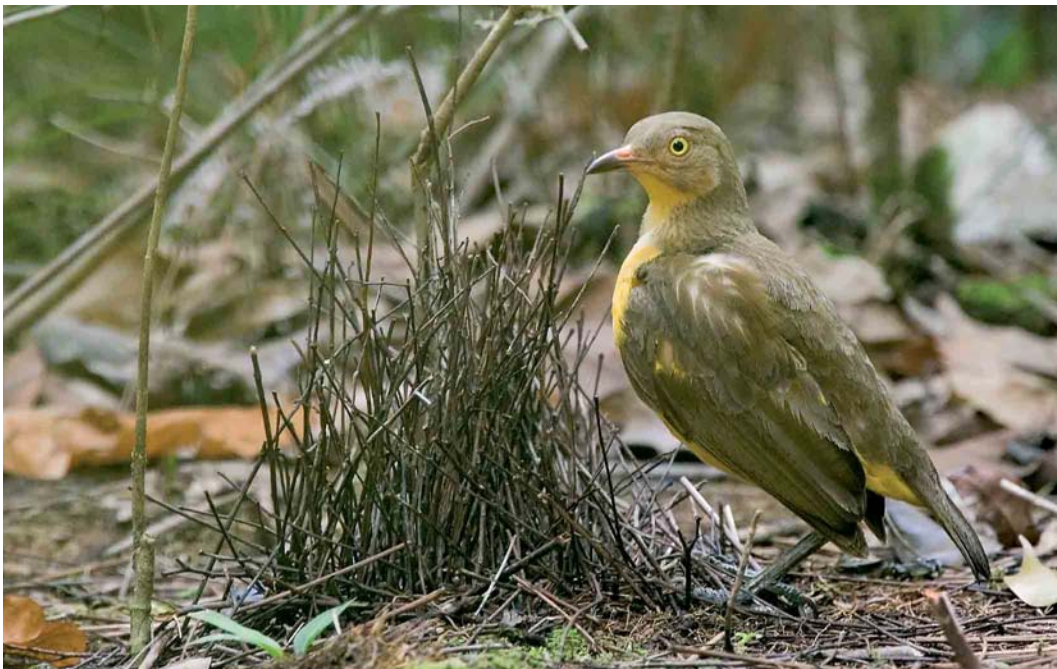
126 Flame Bowerbird / Oranje Prieelvogel Sericulus aureus ardens , female, Kiunga, Western Province, Papua New Guinea, 20 October 2006 (Otto Plantema)