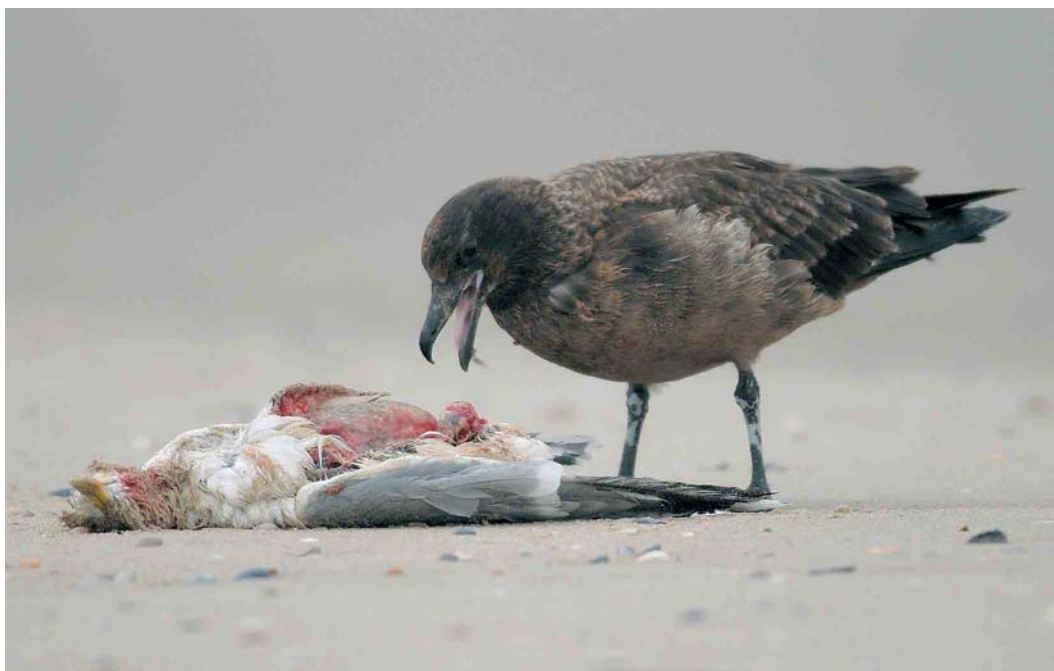
155 Grote Jager / Great Skua Stercorarius skua , eerstejaars, De Cocksdorp, Texel, Noord-Holland, 10 februari 2007