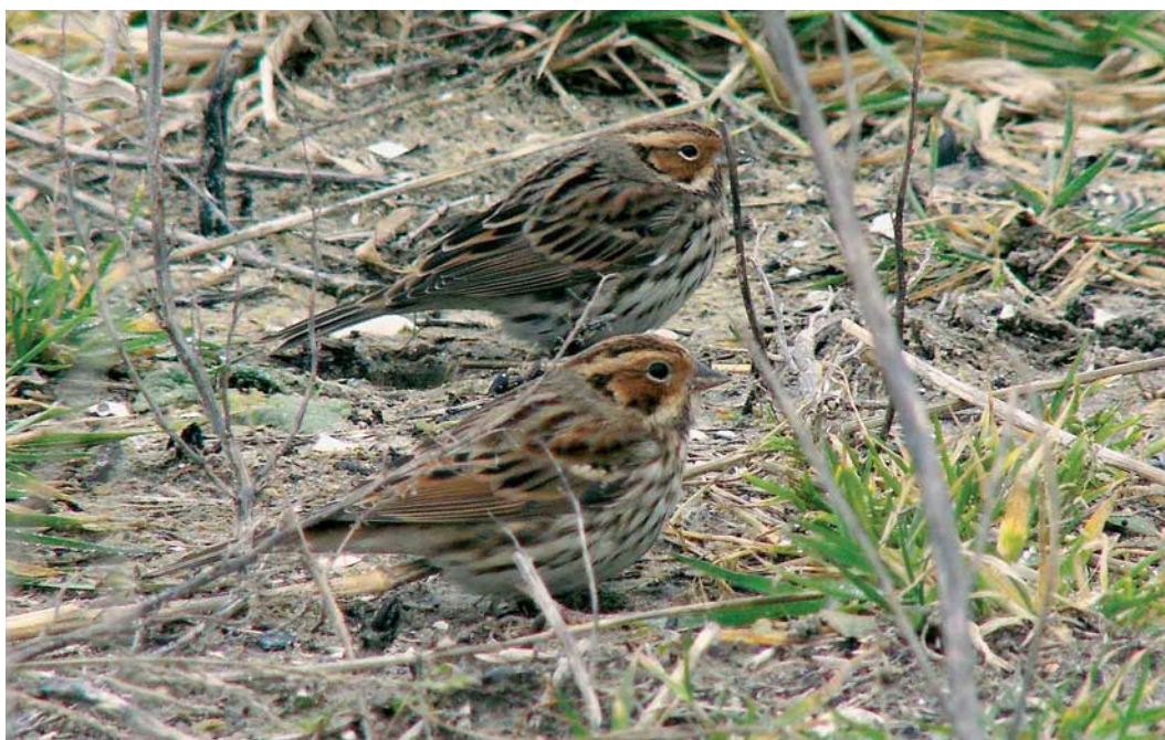
174 Dwerggorzen / Little Buntings Emberiza pusilla , Katwijk aan Zee, Zuid-Holland, 18 februari 2007 (Wilma van Holten)