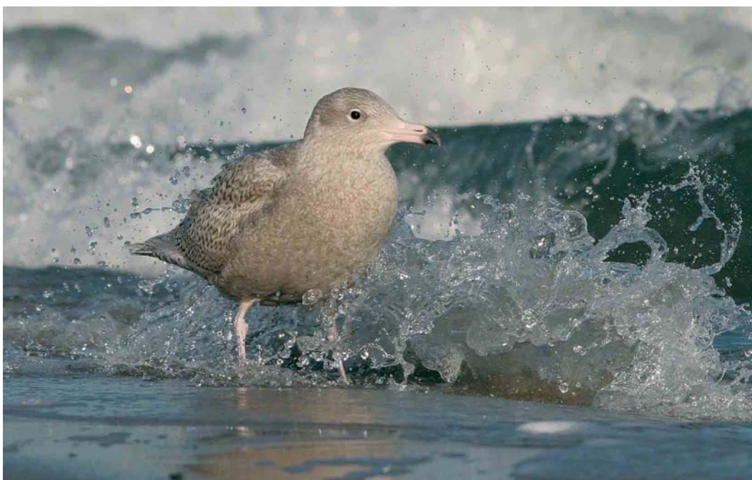
154 Grote Burgemeester / Glaucous Gull Larus hyperboreus , eerste-winter, Maasvlakte, Zuid-Holland, 8 januari 2007