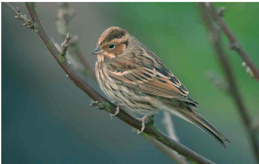
173 Dwerggors / Little Bunting Emberiza pusilla , Katwijk aan Zee, Zuid-Holland, 17 februari 2007