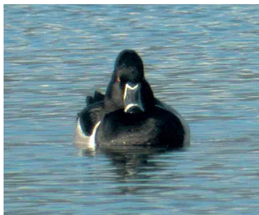
181 Ringsnaveleend / Ring-necked Duck Aythya collaris , mannetje, Verdronken Weiden, Ieper, West-Vlaanderen, 21 januari 2007 (Koen Verbanck)