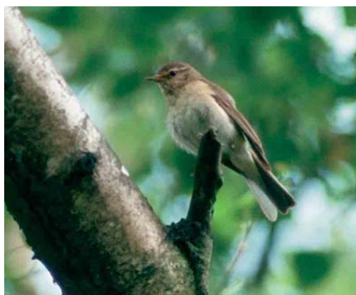
109 Iberische Tjijtjaf / Iberian Chiffchaff Phylloscopus ibericus , Vondelpark, Amsterdam, Noord-Holland, juni 1990 (Lammert van der Veen) 110 Iberische Tjijtjaf / Iberian Chiffchaff Phylloscopus ibericus , Vondelpark, Amsterdam, Noord-Holland, april 1990 (Leo Heemskerk) 111 Iberische Tjijtjaf / Iberian Chiffchaff Phylloscopus ibericus , Sorghvlietpark, Den Haag, Zuid-Holland, 5 mei 1994 (Henk Harmsen) 112 Iberische Tjijtjaf / Iberian Chiffchaff Phylloscopus ibericus , Belfeld, Limburg, 8 juni 2001 (Ran Schols/Rana). Lange wenkbrauwstreep en bleke onderdelen zijn kenmerkend / Long supercilium and pale underparts are characteristic

2005 werd tijdens zijn verblijf door een aantal waarnemers beschouwd als mogelijke Tjijtjaf met afwijkende zang en de waarneming werd daarom nog niet ingediend bij de CDNA (geluidsopnamen en foto's zijn te vinden op www.dutchbirding.nl en www.lauwersmeer.com ).