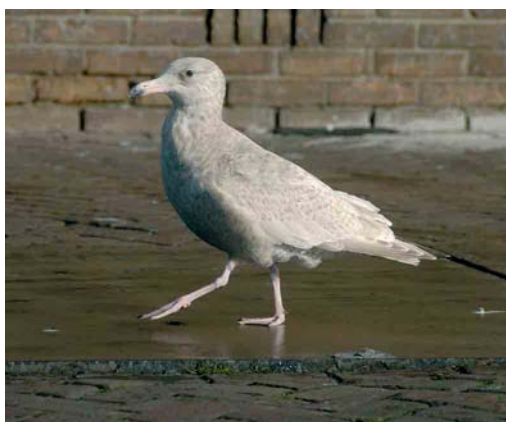
161 Zwarte Wouw / Black Kite Milvus migrans , Kamerik, Utrecht, 24 februari 2007 ( Michael Kars ) 162 Zwarte Wouw / Black Kite Milvus migrans , Kamerik, Utrecht, 23 februari 2007 ( Richard Houtman ) 163 Ross' Gans / Ross's Goose Anser rossii , Scherpenissepolder, Zeeland, 12 februari 2007 ( Cor van Aart ) 164 Grote Grijsze Snip / Long-billed Dowitcher Limnodromus scolopaceus , Twisk, Noord-Holland, 14 januari 2007 ( Paul Cools ) 165 Grote Burgemeester / Glaucous Gull Larus hyperboreus , Maasvlakte, Zuid-Holland, 7 januari 2007 ( Chris van Rijswijk ) 166 Hybride Grote Burgemeester x Zilvermeeuw / hybrid Glaucous x European Herring Gull Larus hyperboreus x argentatus , eerste-winter, IJmuiden, Noord-Holland, 7 februari 2007 ( Arnoud B van den Berg )