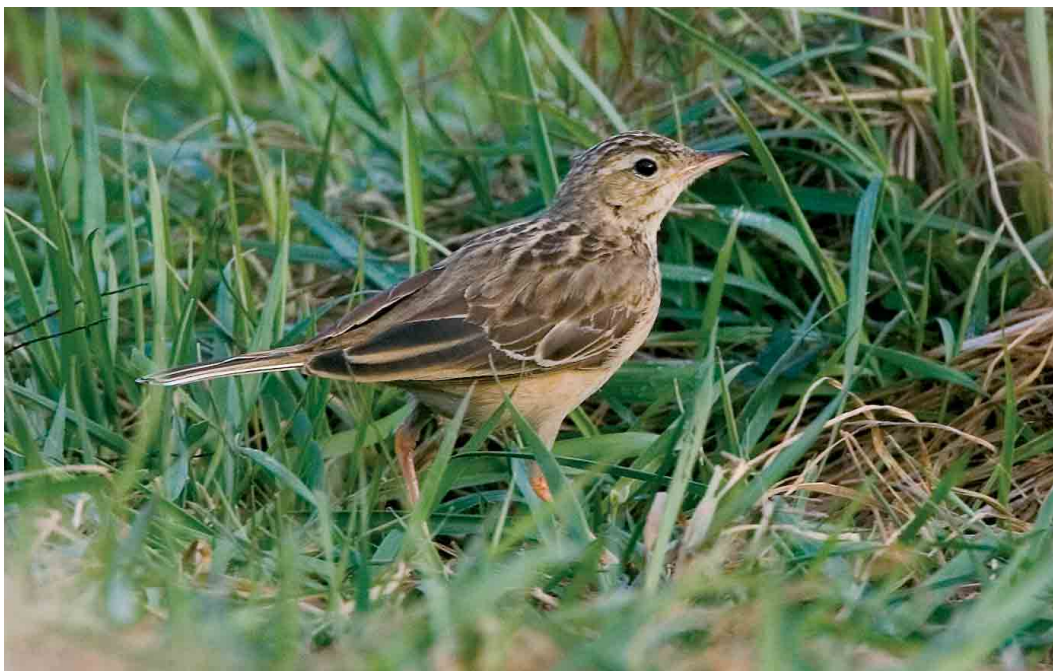
158 Mongoolse Pieper / Blyth's Pipit Anthus godlewskii , Woerden, Utrecht, 25 januari 2007