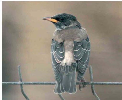
138 Eastern Black Redstart / Oosterse Zwarte Roodstaart Phoenicurus ochruros phoenicuroides , male, Jomfruland, Kragerø, Telemark, Norway, 21 January 2007 ( Øivind W Johannessen ) 139 Desert Wheatear / Woestijntapuit Oenanthe deserti , first-year male, Irlam, Greater Manchester, England, 9 March 2007 ( Steve Young/Birdwatch ) 140 Citrine Wagtail / Citroenkwikstaart Motacilla citreola , Aiguamolls de l'Empordà, Girona, Spain, 18 January 2007 ( Ricard Gutiérrez ) 141 Rose-coloured Starling / Roze Spreeuw Sturnus roseus , first-winter, Llobregat delta, Barcelona, Spain, 12 February 2007 ( Ferran López )

Bute, Argyll, from 28 January into March. In København, Denmark, first-winter females were present at Østerbro from 26 January to at least 28 February and at Nivå from 3 February into March. In Finland, a male remained at Oulu from February into March. In England, a first-winter American Robin T migratorius stayed at Bingley, West Yorkshire, from early January through February. The number of singing Cetti's Warblers Cettia cetti in the Netherlands increased to 25 in 2006; the highest total ever was a presumed 60 pairs in 1977 but severe winters wiped it out and not a single bird was recorded in 1986-88 and 1991-92, 1997 and 1999. Similarly, the number of singing Zitting Cisticola Cisticola juncidis has been on the increase again, with in 2006 25 in Saefinghe, Zeeland, alone. Three Paddyfield Warblers Acrocephalus agricola were found in Catalunya, Spain, including two