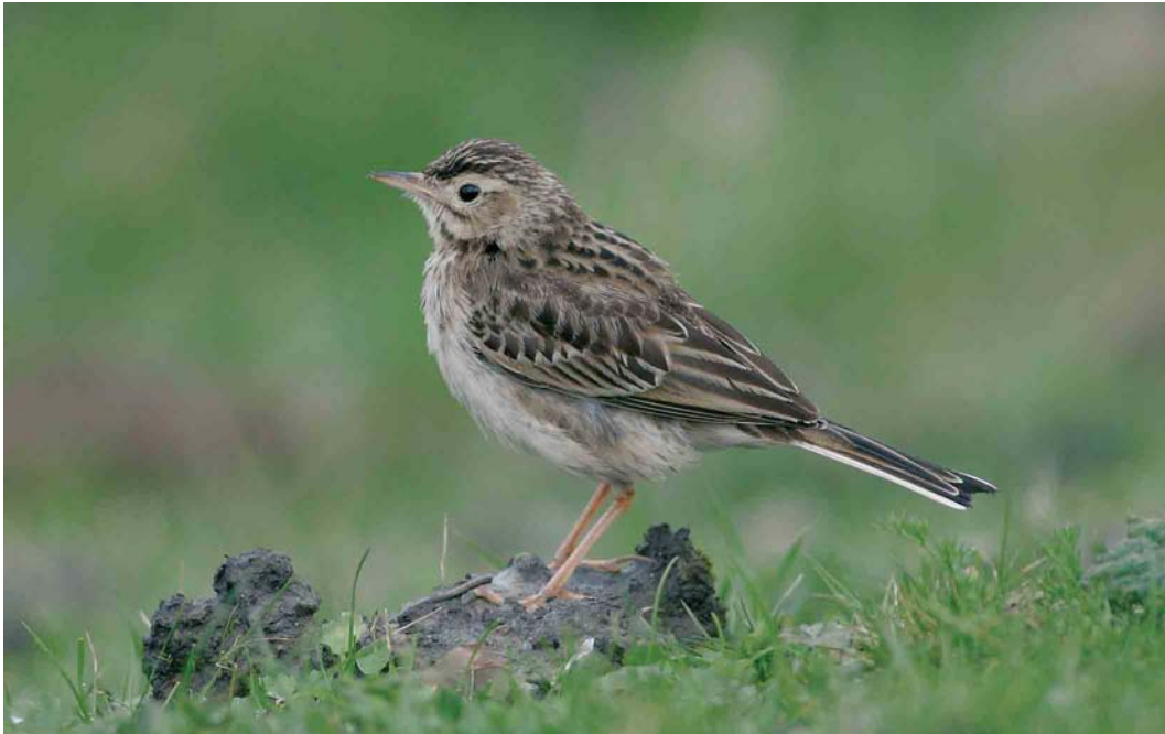
159 Grote Pieper / Richard's Pipit Anthus richardi , Flauwers Inlaag, Zeeland, 24 februari 2007 (Corstiaan Beeke)