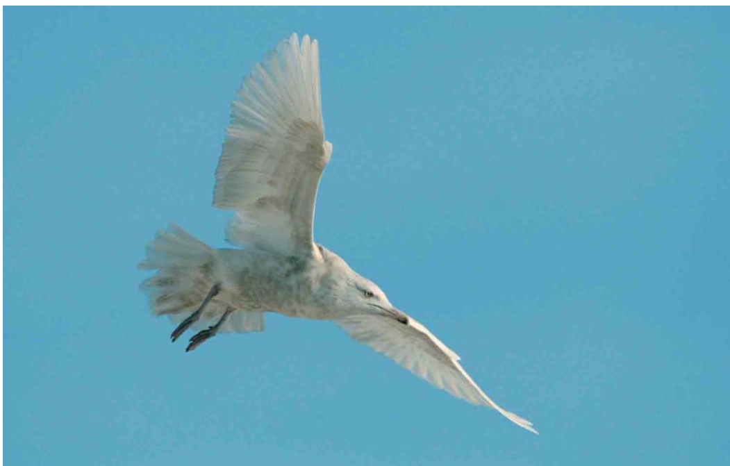
179 Grote Burgemeester / Glaucous Gull Larus hyperboreus , tweede-winter, Zeebrugge, West-Vlaanderen, 31 januari 2007 (Johan Buckens)

Heppeneert werden op 27 januari telkens vier Taigarietganzen Anser fabalis opgemerkt. Een Groenlandse Kolgans A albifrons flavirostris verbleef op 6 januari in Ophoven, Limburg, en van 26 tot 29 januari was er één bij Heppeneert. De enige Roodhalsgans Branta ruficollis voor deze periode werd op 14 januari waargenomen in Sint-Margriete, Oost-Vlaanderen. Waarnemingen van Krooneenden Netta rufina kwamen van Beernem, West-Vlaanderen; Berlare, Oost-Vlaanderen; Gent, Oost-Vlaanderen; Harchies (twee); Kallo, Oost-Vlaanderen; Lac de la Plate-Taille, Hainaut (drie); Oudenaarde, Oost-Vlaanderen; Schoten, Antwerpen (twee); Sint-Lenaerts; Walem, Antwerpen; en Wintam, Antwerpen (twee). Op 14 en 15 januari zwom een mannetje Ringsnaveleend Aythya collaris op de kleiputten van Ploegsteert, Hainaut. Diezelfde vogel dook op 20 januari op in de Verdrongen Weiden bij Ieper, West-Vlaanderen, waar hij tot 23 januari werd gezien. Voor Witoogeenden A nyroca kon men nog terecht in Duffel/Rumst, Antwerpen (twee); Harelbeke, West-Vlaanderen (drie); Ploegsteert; Rijkevorsel, Antwerpen; en Zonhoven, Antwerpen. Het gekleurde en dus ontsnapte vrouwtje Kleine Topper A affinis werd tussen 7 januari en 20 februari nog geregeld opgemerkt in Het Hageven in Neerpelt, Limburg. Op 17 januari was een mannetje Amerikaanse Smient Anas americana aanwezig in Het Zwin in Knokke, West-Vlaanderen. Langs de Schelde in Tielrode, Oost-Vlaanderen, foerageerde op 22 januari een mannetje Amerikaanse Wintertaling