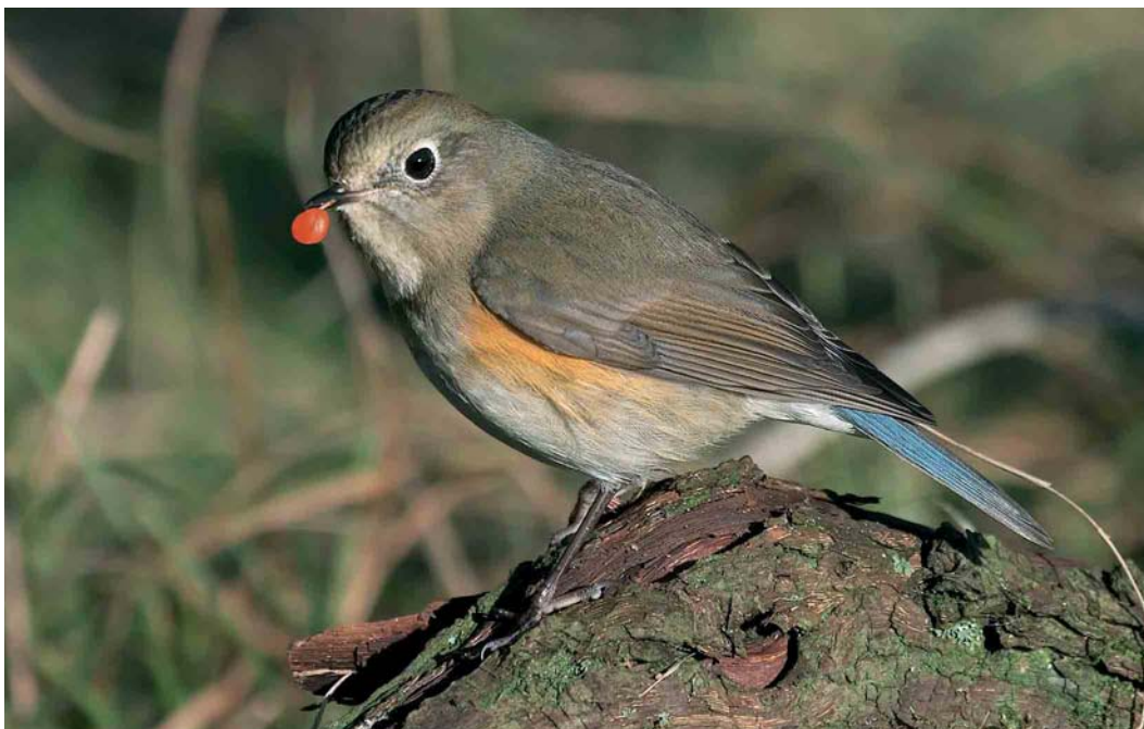
172 Blauwstaart / Red-flanked Bluetail Tarsiger cyanurus , eerste-winter mannetje, Zandvoort, Noord-Holland, 25 januari 2007