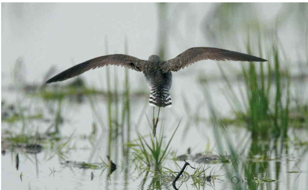
107 Amerikaanse Bosruiter / Solitary Sandpiper Tringa solitaria solitaria , Wissenkerke, Zeeland, 17 mei 2006 (Harvey van Diek)

(8 oktober 2005) en Zweden (20 mei 1987) (Dymond et al 1989, Lundqvist 1989, Lewington et al 1991, Evans 1994, Clarke 2006; www.wpbirds.com , http://azores.seawatching.net/index.php?page=list ; Marcel Haas in litt).