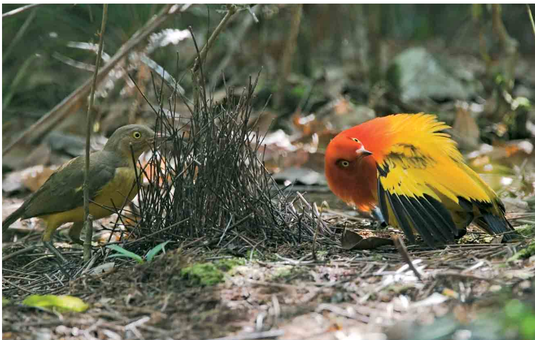
124 Flame Bowerbirds / Oranje Prieelvogels Sericulus aureus ardens , dancing male and female, Kiunga, Western Province, Papua New Guinea, 20 October 2006 (Otto Plantema)