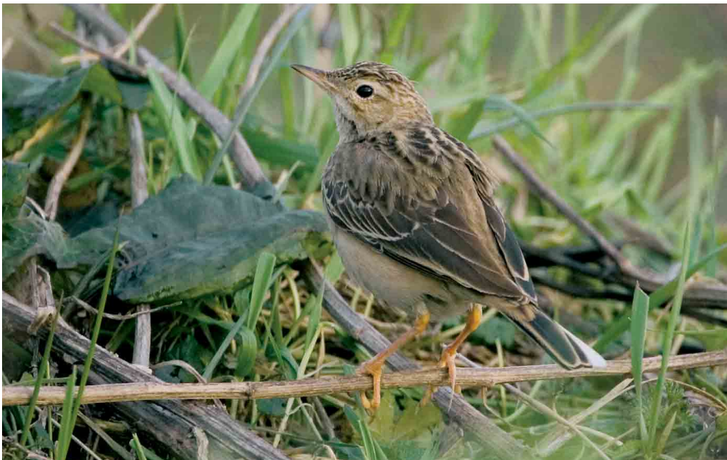
160 Mongoolse Pieper / Blyth's Pipit Anthus godlewskii , Woerden, Utrecht, 25 januari 2007 (Bas van den Boogaard)