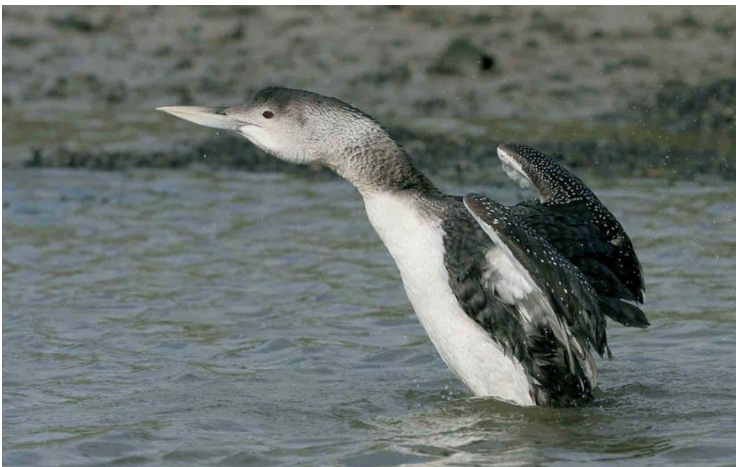
129 Yellow-billed Loon / Geelsnavelduiker Gavia adamsii , adult, Hayle, Cornwall, England, 1 March 2007 (Kit Day)