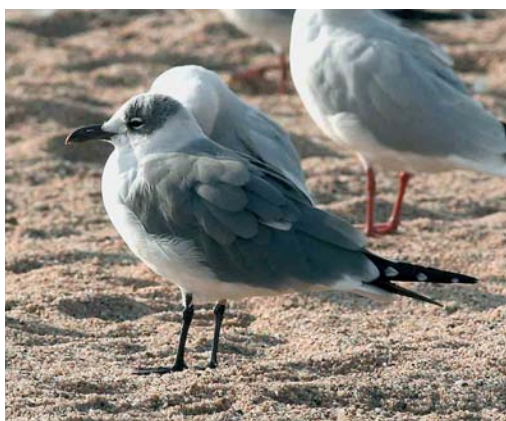
134 American Herring Gull / Amerikaanse Zilvermeeuw Larus smithsonianus , fourth-winter, Nimmo's Pier, Galway, Ireland, 23 February 2007 135 Black-eared Kite / Oostelijke Zwarte Wouw Milvus lineatus , first-year, Snettisham, Norfolk, England, 18 February 2007 136 Bufflehead / Buffelkopeend Bucephala albeola , Lough Atedaun, Clare, Ireland, 9 February 2007 137 Laughing Gull / Lachmeeuw Larus atricilla , adult ('Atze'), Blanes, Girona, Spain, 21 January 2007

Leiden, Zuid-Holland, from 22 December to 22 January, at Driehuis, Noord-Holland, from 15 January into March, and at Amersfoort, Utrecht, from 4 February into March; and two Siberian Chiffchaffs P. collybita tristis at Huizen, Noord-Holland, from 19 November to at least 25 February, and at Bilthoven, Utrecht, from 19 January into March. In France, at least seven Richard's Pipits were wintering at Mas Chauvet, Crau, Bouches-du-Rhône, through January-February. At Rabat, Malta, an Olive-backed Pipit was present from 17 February and a Siberian Chiffchaff on 8 February. In the Azores, two American Buff-bellied Pipits A. rubescens rubescens were found on Vila, Santa Maria, on 18 January. In Spain, a Citrine Wagtail Motacilla citreola was wintering at Aiguamolls de l'Empordà, Girona, from 14 December into March and another was accidentally trapped at a White Wagtail M. alba roost at Algeciras, Cádiz, on 27 February. The second (or third)