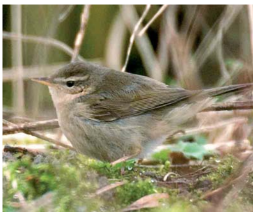
175 Pallas' Boszanger / Pallas's Leaf Warbler Phylloscopus proregulus , Driehuis, Noord-Holland, 22 januari 2007 176 Grote Pieper / Richard's Pipit Anthus richardi , Lentevreugd, Wassenaar, Zuid-Holland, 17 februari 2007 177 Dwerggorzen / Little Buntings Emberiza pusilla , Katwijk aan Zee, Zuid-Holland, 15 februari 2007 178 Bruine Boszanger / Dusky Warbler Phylloscopus fuscatus , Electra, Groningen, 7 februari 2007

wersdam. Een winterse Visdief S hirundo vloog op 15 januari langs telpost Camperduin. De Zwarte Zeekoet Cephus grylle van West-Terschelling, Friesland, was weer te zien van 22 tot 28 januari. Op 2 januari werd een exemplaar opgemerkt langs Ameland en op 27 januari bij de Brouwersdam. De twee Kleine Alken Alle alle van Westkapelle bleven tot 27 januari, waarna er nog één tot 3 februari zwom. Daarnaast werden er tot begin februari nog 10 gemeld. Papegaaiduikers Fringilla arctica vlogen op 1 januari langs Westkapelle, op 2 en 21 januari langs Ameland, en op 22 januari langs Vlieland, Friesland; op 9 februari werd een dood exemplaar gevonden tussen Katwijk aan Zee en Noordwijk aan Zee, Zuid-Holland, en op 10 februari te IJmuiden.