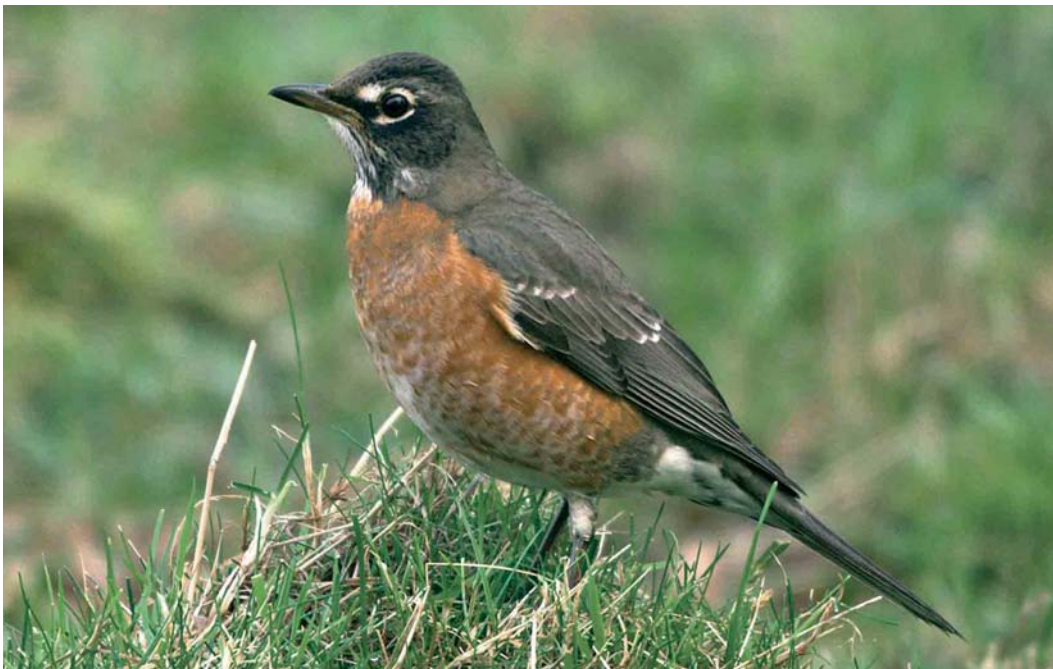
150 American Robin / Roodborstlijster Turdus migratorius , first-winter, Bingley, West Yorkshire, England, 27 January 2007