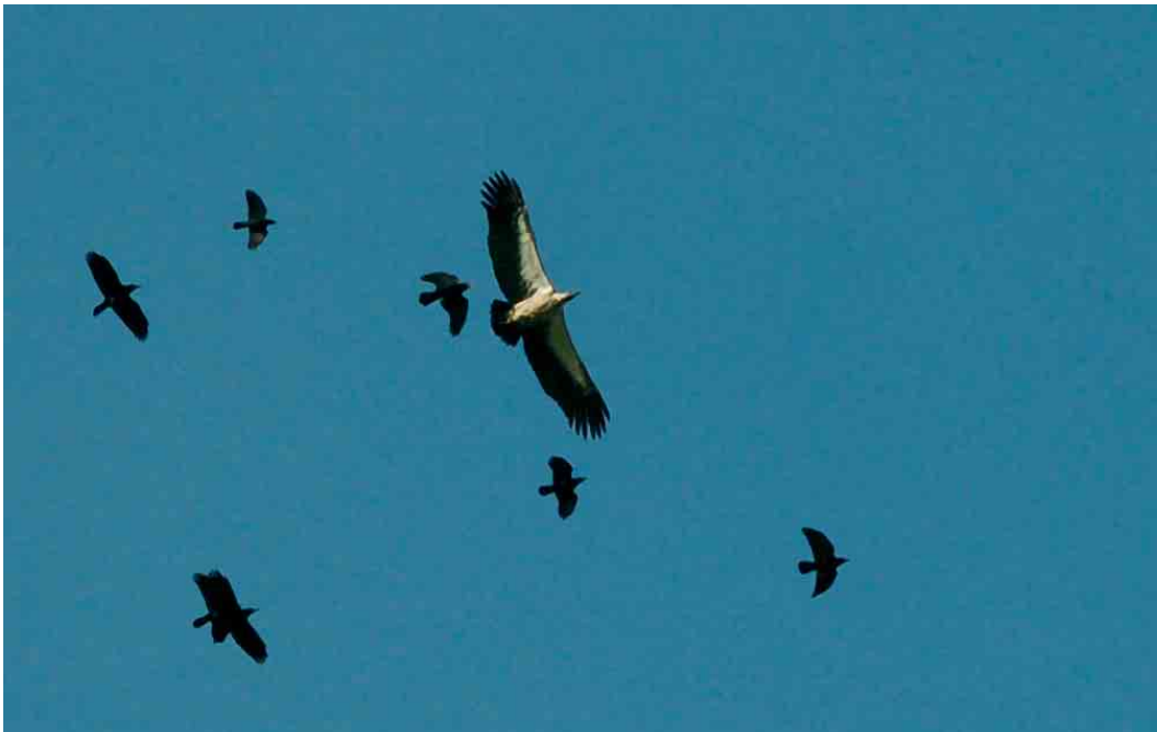
130 African White-backed Vulture / Afrikaanse Witrugger Gyps africanus , with Red-billed Choughs / Alpenkraaien Pyrrhocorax pyrrhocorax , Cabo de São Vicente, Portugal, 15 October 2006