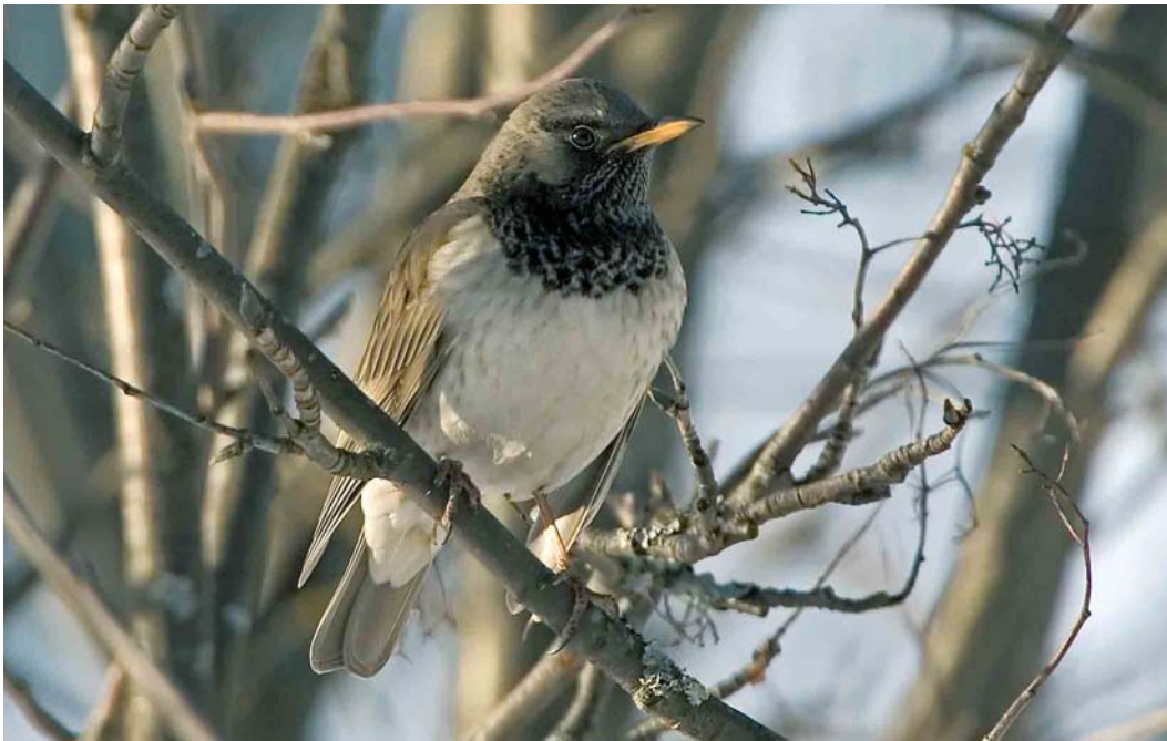
149 Black-throated Thrush / Zwartkeellijster Turdus atrogularis , male, Oulu, Finland, 4 March 2007