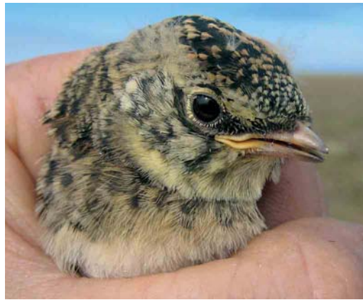
Mystery photograph IV (August)