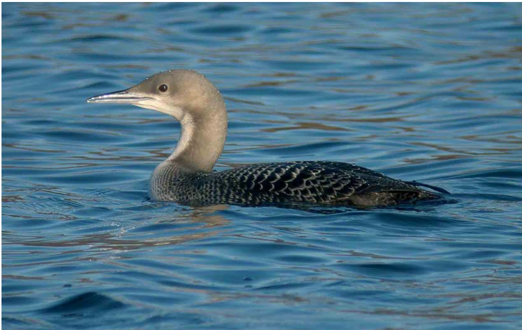
128 Pacific Loon / Pacifische Parelduiker Gavia pacifica , first-year, Farnham, North Yorkshire, England, January 2007 (Dave Stewart)