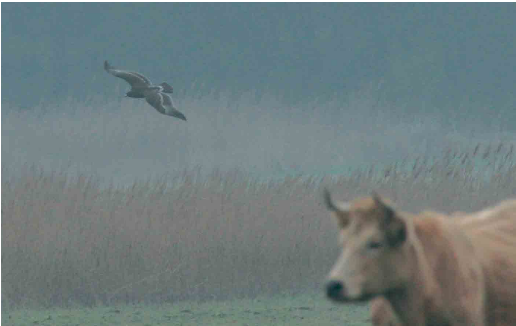
131 Greater Spotted Eagle / Bastaardarend Aquila clanga , first-year, Rømø, Jylland, Denmark, 14 February 2007 (Henrik Knudsen)