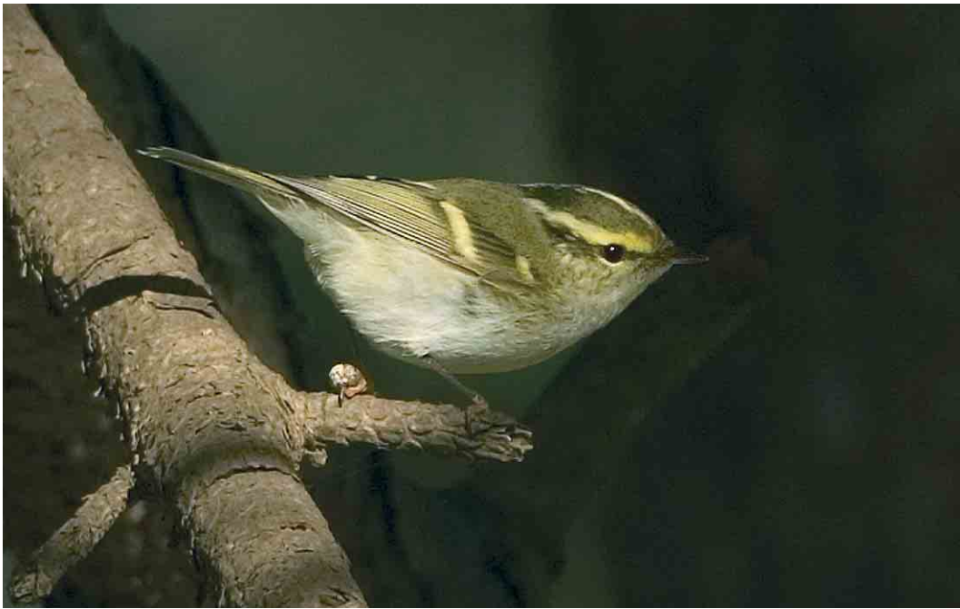
169 Pallas' Boszanger / Pallas's Leaf Warbler Phylloscopus proregulus , Driehuis, Noord-Holland, 3 februari 2007 (Jacob Garvelink)