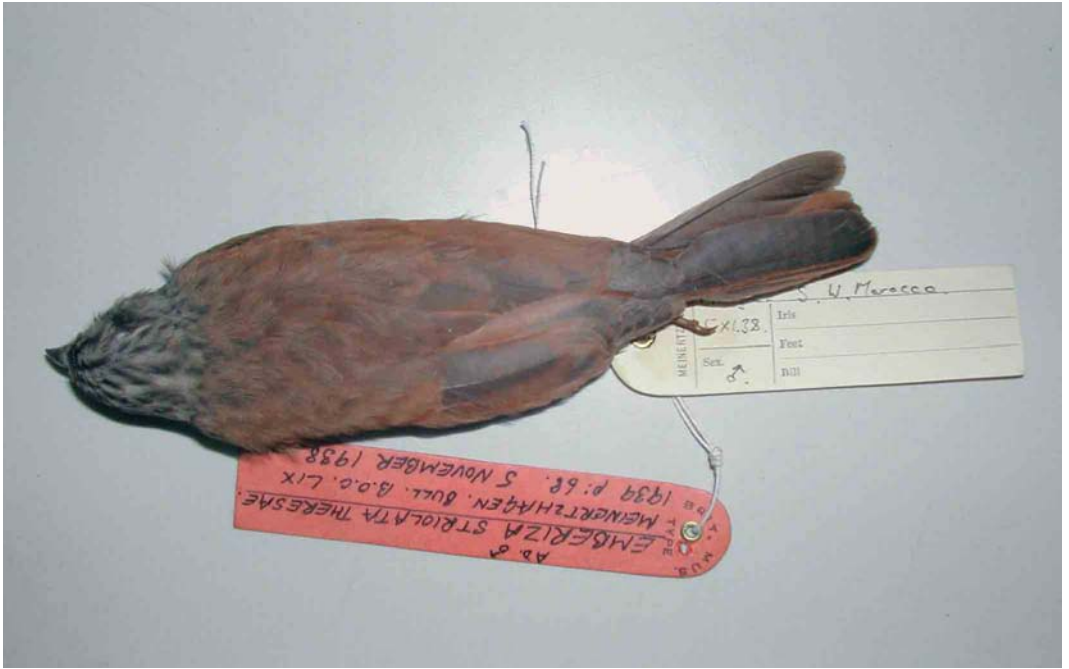
9-10 Male (holotype) of Emberiza sahari theresae , dorsal and ventral views (collected at Andja, south-western Morocco, in November 1938), Natural History Museum, Tring, England, March 2005