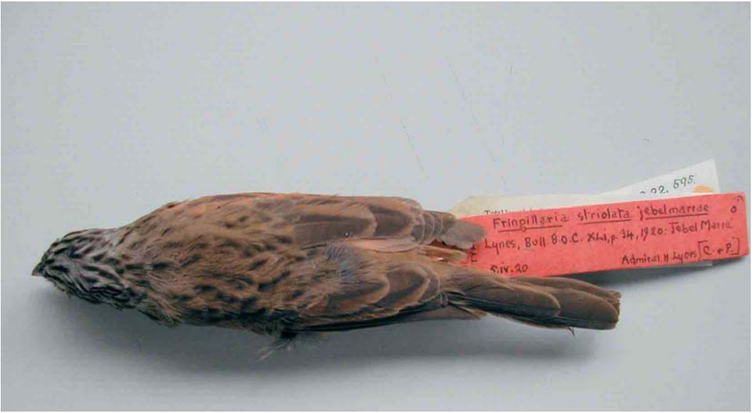
5-6 Male (holotype) of Emberiza striolata jebelmarrae , dorsal and ventral views (collected at Jebel Marra, Darfur, Sudan, in April 1920), Natural History Museum, Tring, England, March 2005