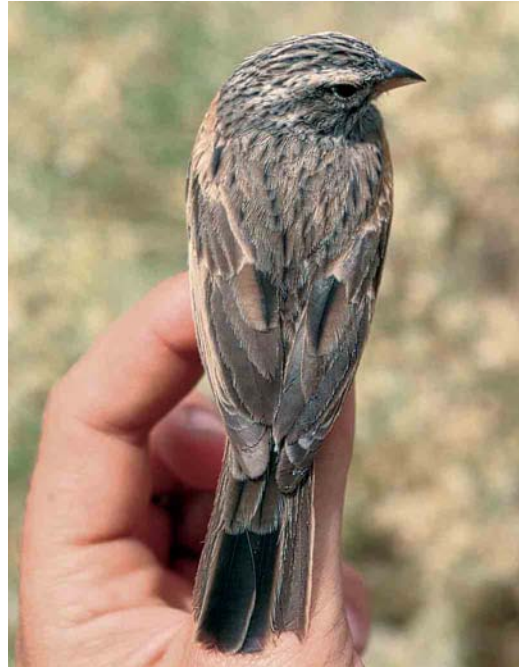
16 Striated Bunting / Gestreepte Gors Emberiza striolata , female, Eilat, Israel, April 1990. Same bird as in plate 14 and 18.