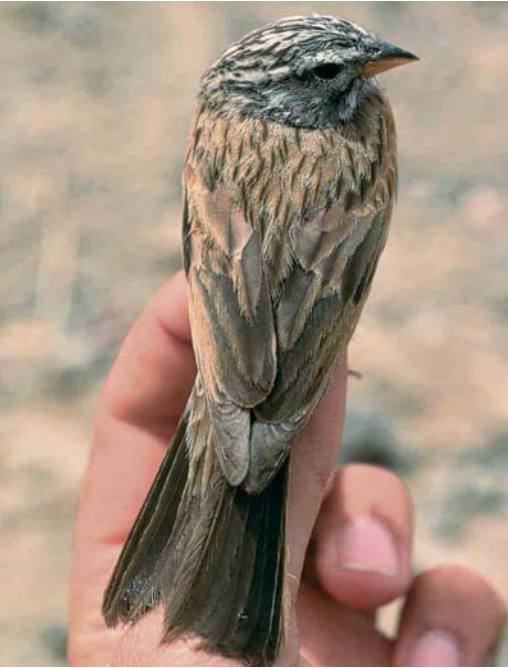
15 Striated Bunting / Gestreepte Gors Emberiza striolata , male, Eilat, Israel, April 1990. Same bird as in plate 13 and 17.