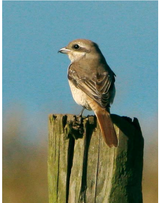
580 Black-faced Bunting / Maskergors Emberiza spodocephala , Castricum, Noord-Holland, Netherlands, 18 November 2007 581 Turkestan Shrike / Turkestaanse Klauwier Lanius phoenicuroides , Buckton, East Yorkshire, England, 4 October 2007 582 Pine Bunting / Witkopgors Emberiza leucocephalos , Fair Isle, Shetland, Scotland, 26 October 2007