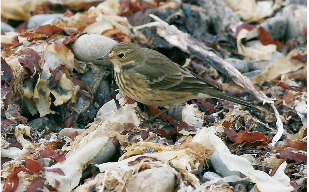
561 American Buff-bellied Pipit / Amerikaanse Waterpieper Anthus rubescens rubescens , Liscannor, Clare, Ireland, 8 October 2007 (Michael Davis)