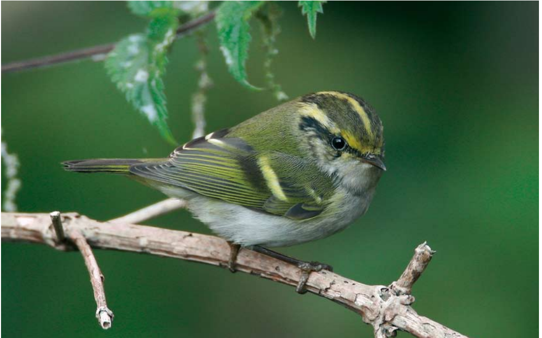
609 Pallas' Boszanger / Pallas's Leaf Warbler Phylloscopus proregulus , Zeebrugge, West-Vlaanderen, 21 oktober 2007 (Patrick Beirens)