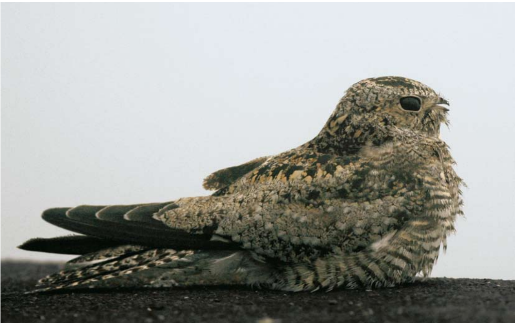
552 Common Nighthawk / Amerikaanse Nachtzwaluw Chordeiles minor , Corvo, Azores, 25 October 2007