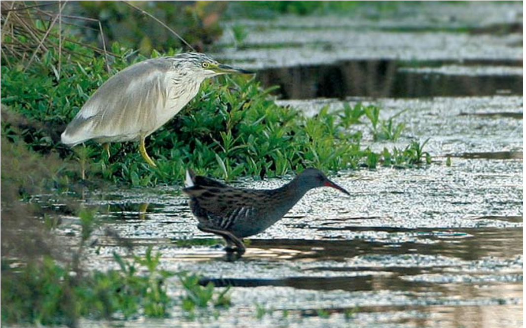
585 Ralreiger / Squacco Heron Ardeola ralloides , met Waterral / Water Rail Rallus aquaticus , Willeskop, Utrecht, 23 oktober 2007 586 Grote Aalscholver / Atlantic Great Cormorant Phalacrocorax carbo carbo (onder), met Aalscholver / Continental Great Cormorant P c sinensis , IJmuiden, Noord-Holland, 27 september 2007