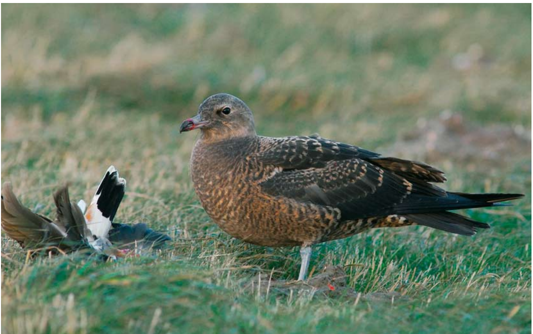
619 Middelste Jager / Pomarine Jaeger Stercorarius pomarinus , juveniel, Eemshaven, Groningen, 10 november 2007 ( Roef Mulder )