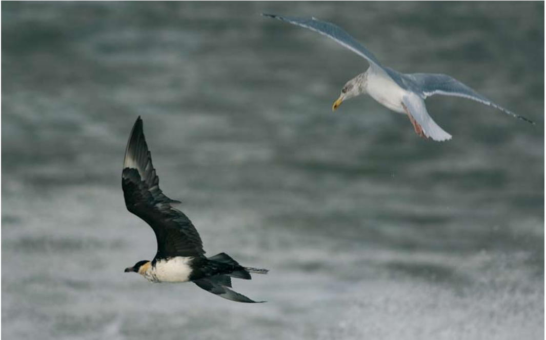
618 Middelste Jager / Pomarine Jaeger Stercorarius pomarinus , adult, met Zilvermeeuw / European Herring Gull Larus argentatus , adult, Maasvlakte, Zuid-Holland, 9 november 2007