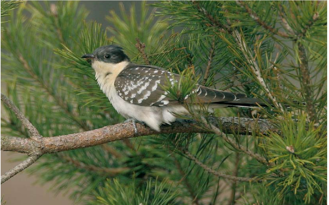
510 Great Spotted Cuckoo / Kuifkoekoek Clamator glandarius , first-summer, Hoge Veluwe, Gelderland, 3 April 2006