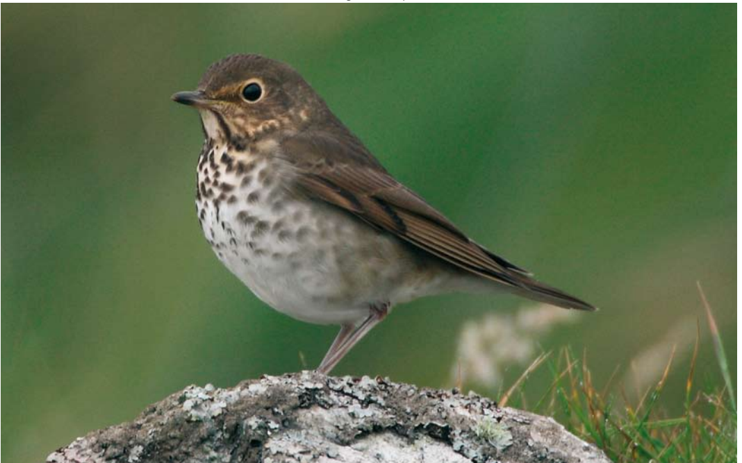
558 Swainson's Thrush / Dwerglijster Catharus ustulatus , Fetlar, Shetland, Scotland, 1 October 2007