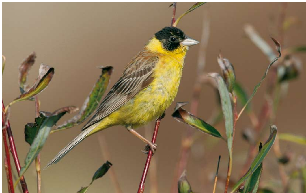
534 Black-headed Bunting / Zwartkopgors Emberiza melanocephala , male, Brouwersdam, Zeeland, 17 October 2006