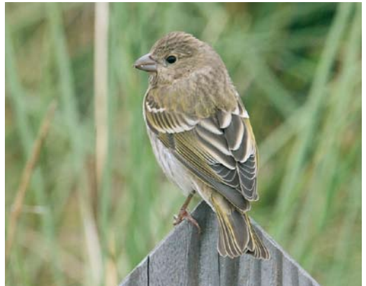
596 Grote Kruisbek / Parrot Crossbill Loxia pytyopsittacus , Vlieland, Friesland, 12 oktober 2007 ( Han Zevenhuizen ) 597 Siberische Boompieper / Olive-backed Pipit Anthus hodgsoni , Terschelling, Friesland, 13 oktober 2007 ( Rudy Offereins ) 598 Bruine Boszanger / Dusky Warbler Phylloscopus fuscatus , Vlieland, Friesland, 13 oktober 2007 ( Marc Guyt/Agami ) 599 Aziatische Roodborsttapuit / Siberian Stonechat Saxicola maurus , Texel, Noord-Holland, 20 oktober 2007 ( Eric Menkveld ) 600 Bosgors / Rustic Bunting Emberiza rustica , Vlieland, Friesland, 7 oktober 2007 ( Arnold Wijker ) 601 Roodmus / Common Rosefinch Carpodacus erythrinus , Vlieland, Friesland, 30 september 2007 ( Han Zevenhuizen )