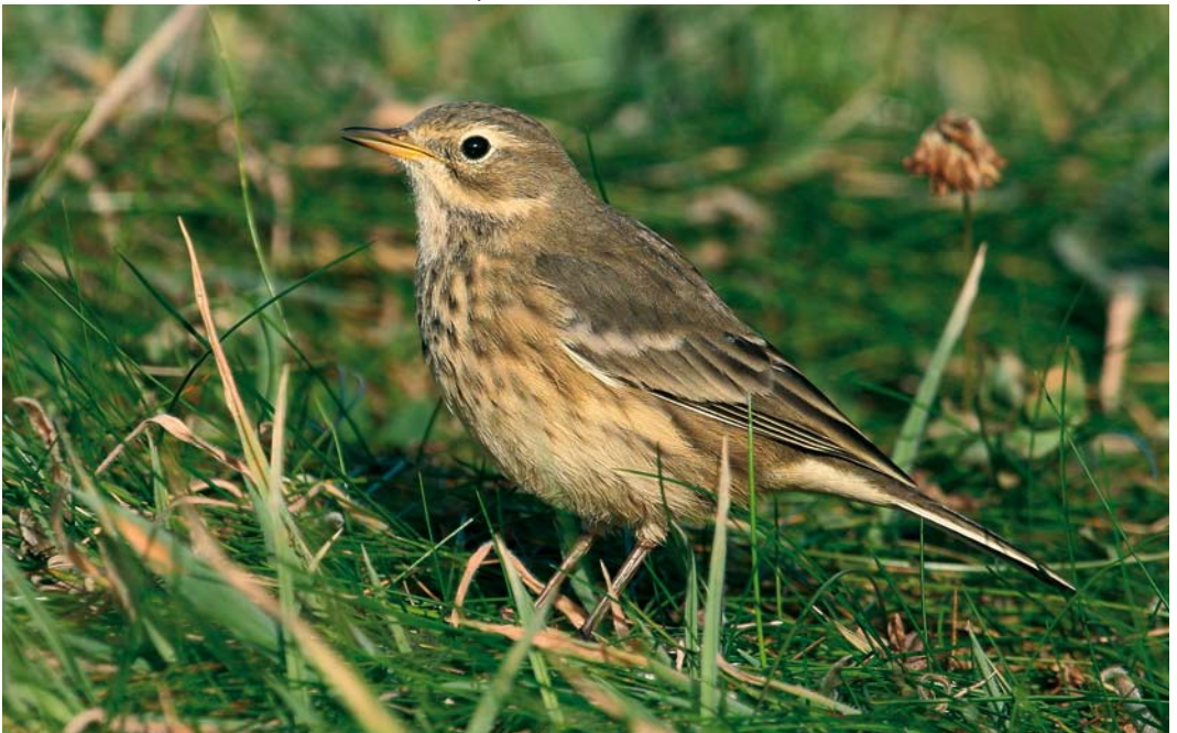
562 American Buff-bellied Pipit / Amerikaanse Waterpieper Anthus rubescens rubescens , Ouessant, Finistère, France, 26 September 2007 (Aurélien Audevard)