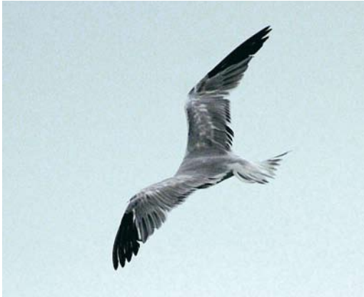
Mystery photograph XI (March)