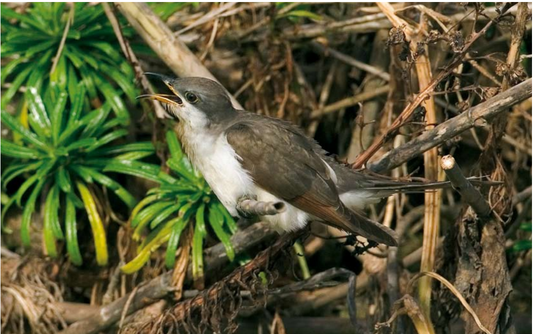
556 Yellow-billed Cuckoo / Geelsnavelkoekoek Coccyzus americanus , Corvo, Azores, 26 October 2007