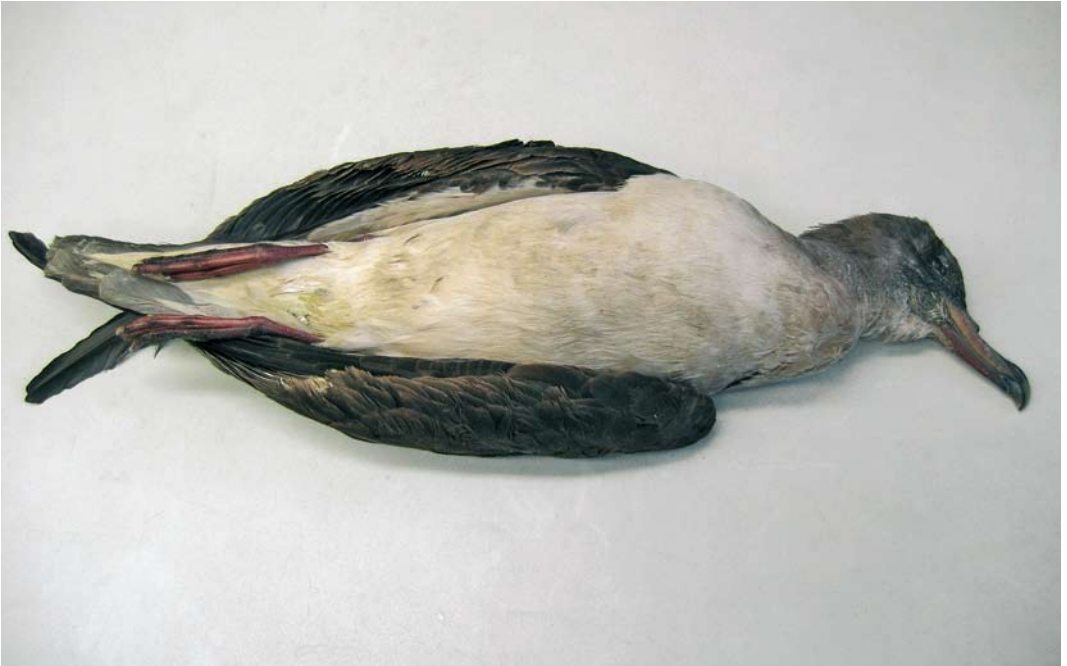
499 Cory's Shearwater / Kuhls Pijlstormvogel Calonectris borealis (found at Lith, Noord-Brabant, on 10 July 2006), Wageningen, Gelderland, 14 October 2006 (Wouter van Gestel)