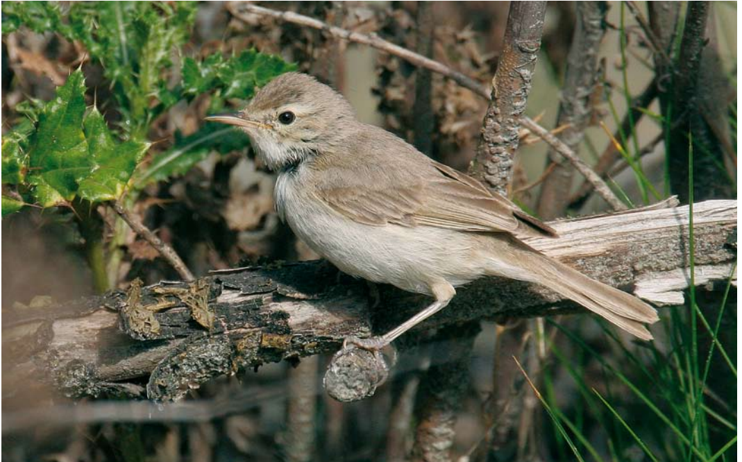
526 Booted Warbler / Kleine Spotvogel Acrocephalus caligatus , Maasvlakte, Zuid-Holland, 9 October 2006