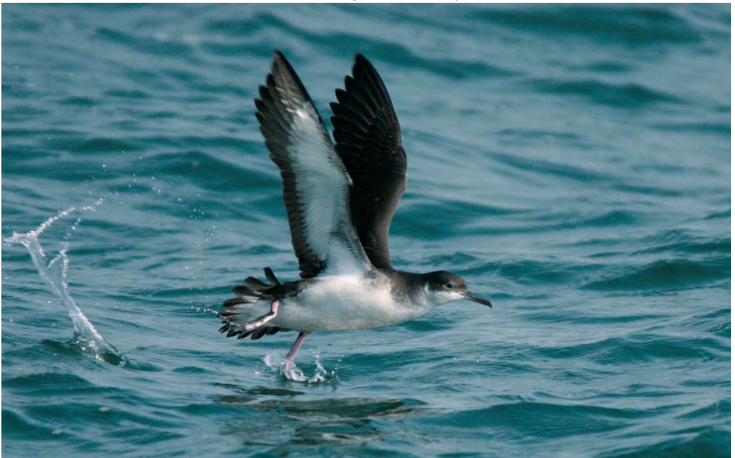
584 Noordse Pijlstormvogel / Manx Shearwater Puffinus puffinus , Noordzee ten noorden van Ameland, Continentaal Plat, 23 september 2007