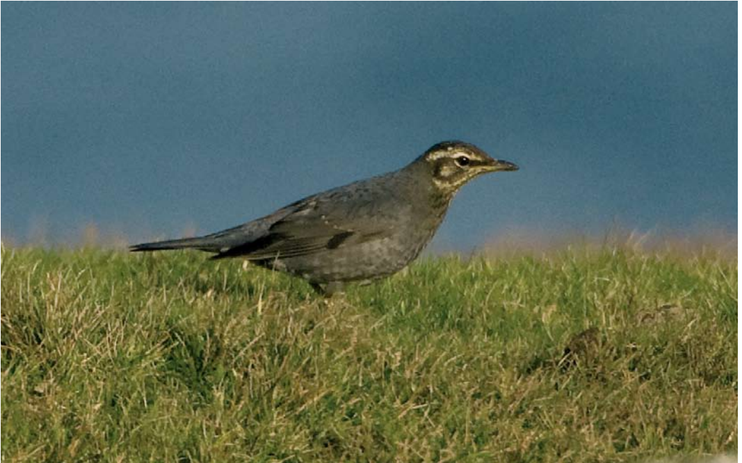
565 Siberian Thrush / Siberische Lijster Zosterorhiza sibirica , immature male, Hametoun, Foula, Shetland, Scotland, 28 September 2007