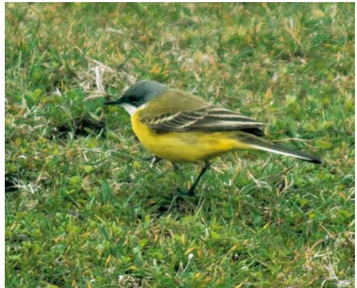
516 Thrush Nightingale / Noordse Nachtegaal Luscinia luscinia , Castricum, Noord-Holland, 19 August 2006 517 Isabelline Wheatear / Izabeltapuit Oenanthe isabellina , Eemshaven-Oost, Groningen, 1 September 2006 518-519 Ashy-headed Wagtail / Italiaanse Kwikstaart Motacilla cinereocapilla , male, Camperduin, Noord-Holland, 16 April 2006

Ebels et al 2007; Birding World 19: 451-452, 2006, 20: 36, 2007, Dutch Birding 28: 411, plate 588-590, 2006, 29: 66, plate 91-92, 293, plate 420-421, 294, plate 422, 295, plate 423-424, 2007).