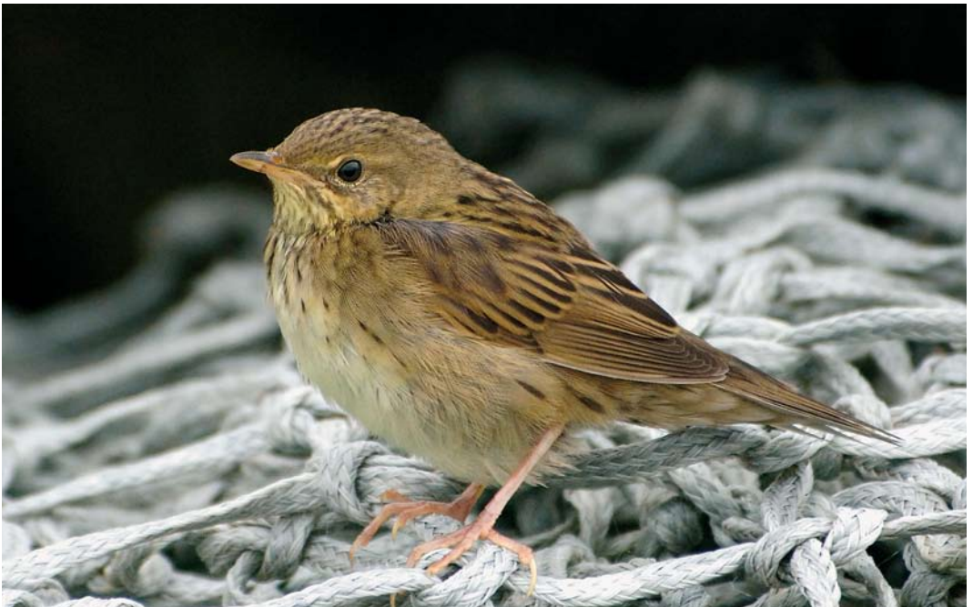
568 Lanceolated Warbler / Kleine Sprinkhaanzanger Locustella lanceolata , Fair Isle, Shetland, Scotland, 3 October 2007