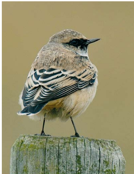
602 Roodkopklauwier / Woodchat Shrike Lanius senator , eerstejaars, Posthuis, Vlieland, Friesland, 7 oktober 2007 603-604 Bonte Tapuit / Pied Wheatear Oenanthe pleschanka , De Cocksdoorp, Texel, Noord-Holland, 3 oktober 2007