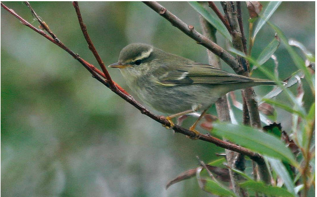
610 Noordse Boszanger / Arctic Warbler Phylloscopus borealis , Raversijde, West-Vlaanderen, 3 oktober 2007