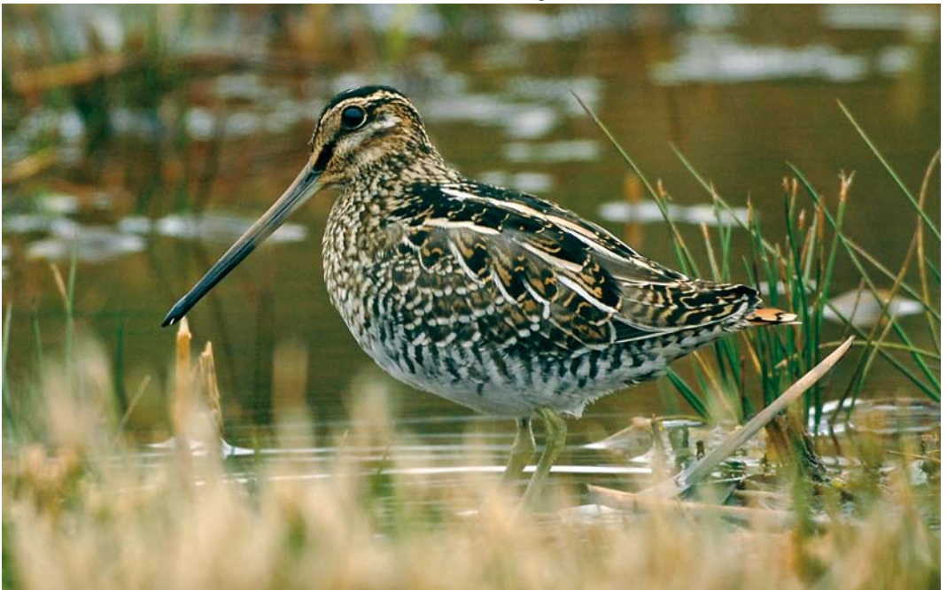
540 Wilson's Snipe / Amerikaanse Watersnip Gallinago delicata , Lower Moors, St Mary's, Scilly, England, 12 October 2007