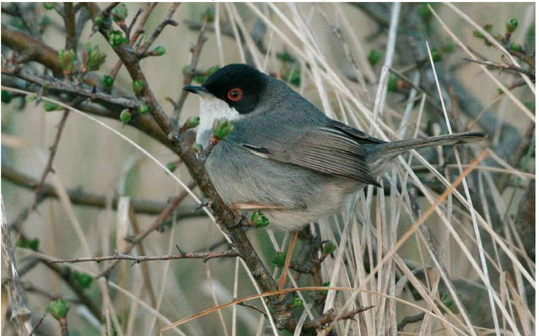
527 Sardinian Warbler / Kleine Zwartkop Sylvia melanocephala , male, Hargen aan Zee, Noord-Holland, 27 April 2006