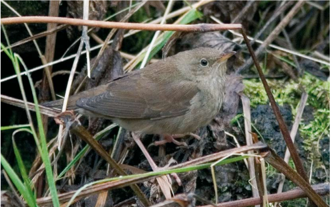
567 River Warbler / Krekelzanger Locustella fluviatilis , Vík, Mýrdalur, Iceland, 11 October 2007 (Yann Kolbeinsson)