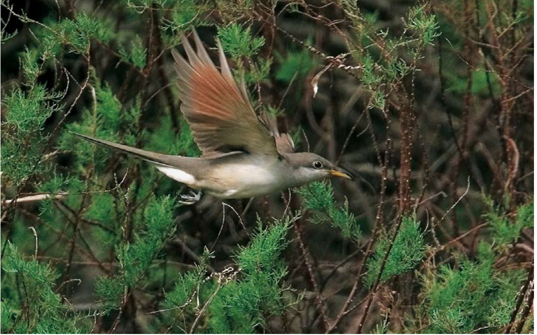
555 Yellow-billed Cuckoo / Geelsnavelkoekoek Coccyzus americanus , Corvo, Azores, 24 October 2007