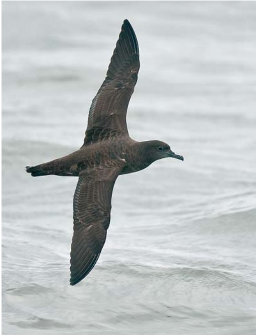
587 Grauwe Pijlstormvogel / Sooty Shearwater Puffinus griseus , Noordzee bij Hoek van Holland, Zuid-Holland, 29 september 2007 (Remco Gulien)