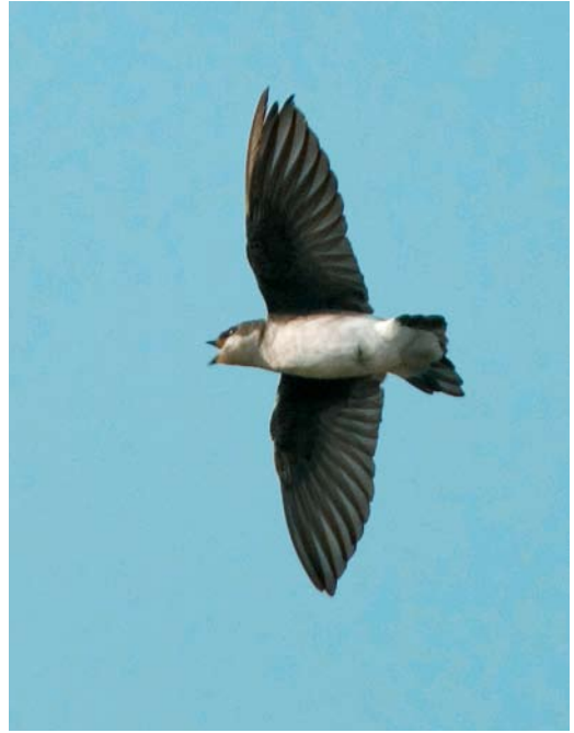
541 Green Heron / Groene Reiger Butorides virescens , adult, Berre l'Étang, Bouches-du-Rhône, France, 3 November 2007 542 Tree Swallow / Boomzwaluw Tachycineta bicolor , Corvo, Azores, 14 October 2007 543 Sandhill Crane / Canadese Kraanvogel Grus canadensis , Nuuk, Greenland, 5 October 2007