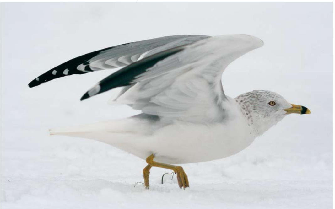
500 Ring-billed Gull / Ringsnavelmeeuw Larus delawarensis , adult, Tiel, Gelderland, 3 March 2006