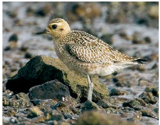
545 American Black Tern / Amerikaanse Zwarte Stern Chlidonias niger surinamensis , Rashane Turlough, Galway, Ireland, 2 September 2007 ( Michael Davis ) 546 White-winged Tern / Witvleugelstern Chlidonias leucopterus , juvenile, Ponta Delgada, São Miguel, Azores, 9 October 2007 ( Dominic Mitchell ) 547 Semipalmated Sandpiper / Grijze Strandloper Calidris pusilla , Vistula mouth, Gdąnsk, Poland, 30 September 2007 ( Zbyszek Kajzer ) 548 Western Sandpiper / Alaskastrandloper Calidris mauri and Semipalmated Sandpiper / Grijze Strandloper C. pusilla , Lagoa Azul, São Miguel, Azores, 15 October 2007 ( Dominic Mitchell ) 549 Sharp-tailed Sandpiper / Siberische Strandloper Calidris acuminata , Ballycotton, Cork, Ireland, 5 October 2007 ( Paul & Andrea Kelly/irishbirdimages.com ) 550 Pacific Golden Plover / Aziatische Goudplevier Pluvialis fulva , Cabo da Praia, Terceira, Azores, 30 October 2007 ( Rafael Armada )