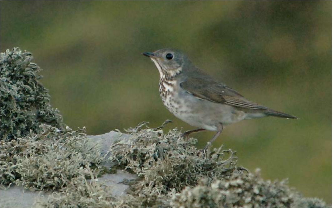
557 Grey-cheeked Thrush / Grijswangdwerglijster Catharus minimus , Fair Isle, Shetland, Scotland, 30 September 2007 (Rebecca Nason)