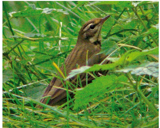
512-513 Pallid Swift / Vale Gierzwaluw Apus pallidus , first-year, Vlieland, Friesland, 21 October 2006 514 Great Spotted Cuckoo / Kuifkoeke Clamator glandarius , first-summer, Hoge Veluwe, Gelderland, 1 April 2006 515 Olive-backed Pipit / Siberische Boompieper Anthus hodgsoni , Oosterreeweg, Schiermonnikoog, Friesland, 15 October 2006