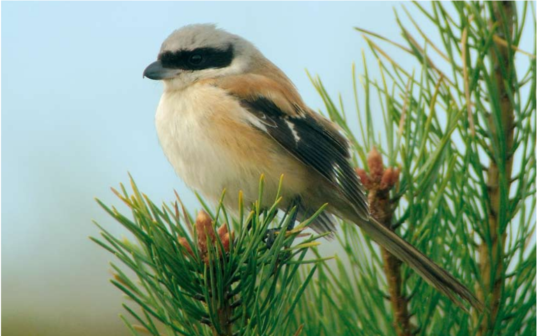
563 Long-tailed Shrike / Langstaartklauwier Lanius schach , first-year male, Skallingen, Blåvand, Vestjylland, Denmark, 17 October 2007