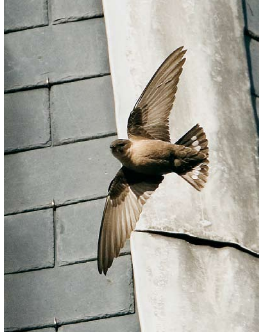
503 Black-winged Pratincole / Steppeworkstaartplevier Pratincola nordmanni , Eemnes, Utrecht, 17 October 2006 504 Eurasian Crag Martin / Rotszwaluw Ptyonoprogne rupestris , Hoorn, Noord-Holland, 18 November 2006 505 Solitary Sandpiper / Amerikaanse Bosruiter Tringa solitaria solitaria , Wissenkerke, Zeeland, 15 May 2006