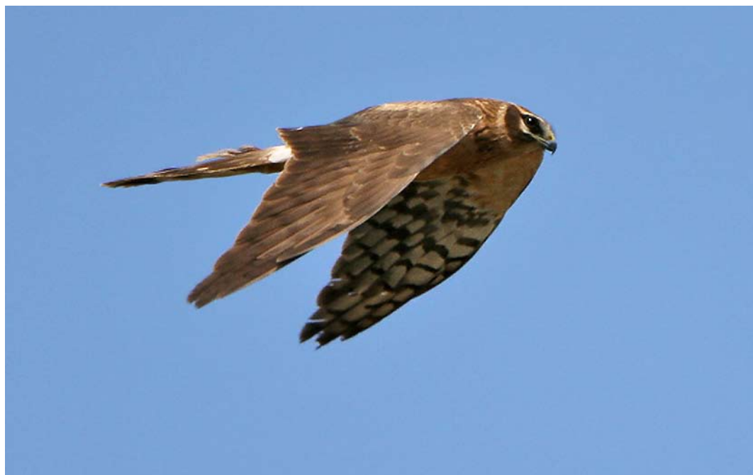
502 Pallid Harrier / Steppekiekendief Circus macrourus , second calendar-year female, De Cocksdoop, Texel, Noord-Holland, 12 May 2006 (Jankees Schwiebbe)