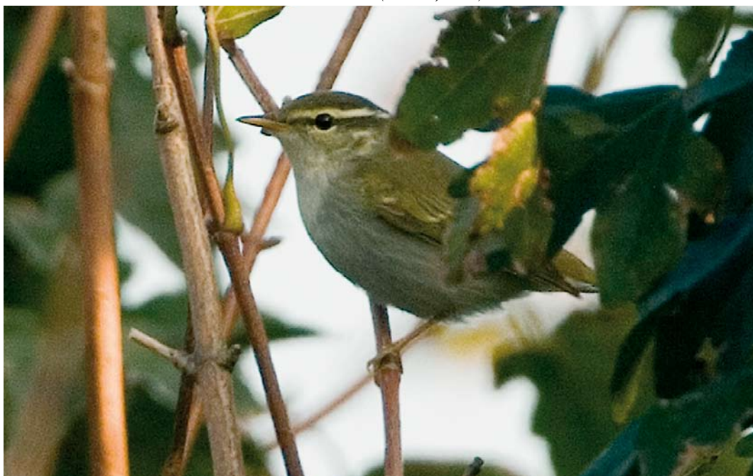
613 Kroonboszanger / Eastern Crowned Warbler Phylloscopus coronatus , Katwijk aan Zee, Zuid-Holland, 5 oktober 2007 (Roland Jansen)