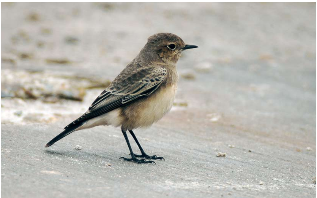
579 Pied Wheatear / Bonte Tapuit Oenanthe pleschanka , Helgoland, Schleswig-Holstein, Germany, 20 October 2007