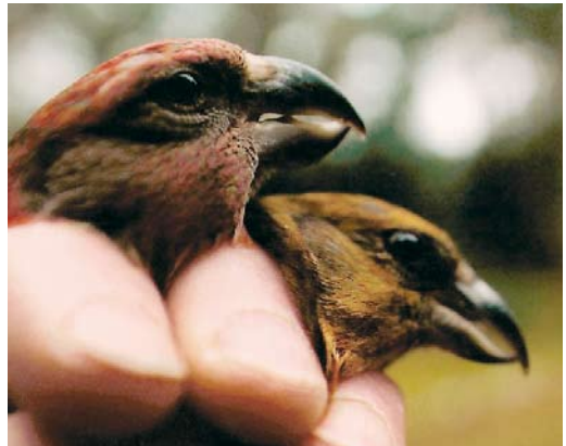
528 Daurian Shrike / Daurische Klauwier Lanius isabellinus , adult female, Maasvlakte, Zuid-Holland, 27 August 2006 529 Daurian Shrike / Daurische Klauwier Lanius isabellinus , adult male, Den Hoorn, Texel, Noord-Holland, 26 September 2006 530 Purple-backed Starling / Daurische Spreeuw Sturnus sturninus , first-winter male, Oost-Vlieland, Vlieland, Friesland, 12 October 2005 531 Purple-backed Starling / Daurische Spreeuw Sturnus sturninus , first-winter male, Oost-Vlieland, Vlieland, Friesland, 12 October 2005 532 Arctic Redpoll / Witstuitbarmsijs Carduelis hornemanni , IJmuiden, Noord-Holland, 27 January 2006 533 Parrot Crossbill / Grote Kruisbek Loxia pytyopsittacus , male (left), with Common Crossbill / Kruisbek L. curvirostra , Tongeren, Gelderland, 12 February 2006