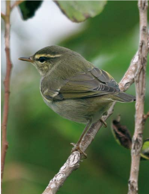
611 Noordse Boszanger / Arctic Warbler Phylloscopus borealis , Zeebrugge, West-Vlaanderen, 23 september 2007

den in totaal 27 Zwartkopmeeuwen Larus melanocephalus gemeld met maximaal vier in Hoboken, Antwerpen, op 7 oktober. Tussen 7 en 29 september werden 46 Vorkstaartmeeuwen L. sabini genoteerd met waarnemingen in Bredene; Nieuwpoort (twee); Oostende (12 waarvan acht op 10 september) en De Panne (31 waarvan 22 op 10 september). Op 13 oktober volgde nog een waarneming meer in het binnenland: in Vlissegem, West-Vlaanderen. Tussen 17 en 22 september vlogen vijf Reuzensterms Hydroprogne caspia langs: in Oostende op 17 september, langs Nieuwpoort (twee) op 19 september, en langs Zeebrugge en daarna langs Oostende op 22 september. Van 1 tot 3 september pleisterde een juveniele Witvleugelstern Chlidonias leucopterus in Het Vinne in Zoutleeuw, Vlaams-Brabant. In De Panne trokken exemplaren langs op 10 en op 26 september. Vanaf 5 september verschenen Velduil Asio flammeus op het toneel: in september waren het er negen en in oktober 23. Hoppen Upupa epops werden op 15 september gezien in Fontaine-l'Évêque, Hainaut, en op 7 oktober bij Hamois, Namur. Twee ontsnapte Kookaburra's Dacelo novaeguineae verblijven al bijna een jaar bij de Weiput in Zingem, Oost-Vlaanderen, en weten zich daar aardig te behelpen. Met 53 Draaihalzen Jynx torquilla scoorde september niet bijzonder goed voor deze soort. Daarna volgden nog waarnemingen in Hoepertingen, Vlaams-Brabant, op 4 oktober en Heist op 6 oktober. Het najaar is niet het beste moment om