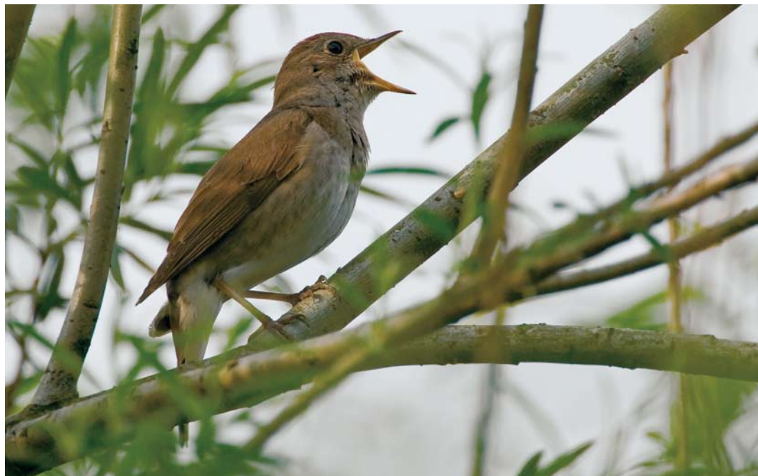
523 Thrush Nightingale / Noordse Nachtegaal Luscinia luscinia , Kessenich, Limburg, 15 May 2006