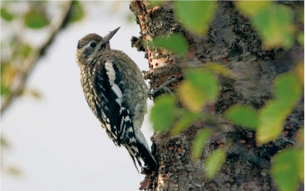
551 Yellow-bellied Sapsucker / Geelbuiksapspecht Sphyrapicus varius , first-year male, Selfoss, Iceland, 8 October 2007