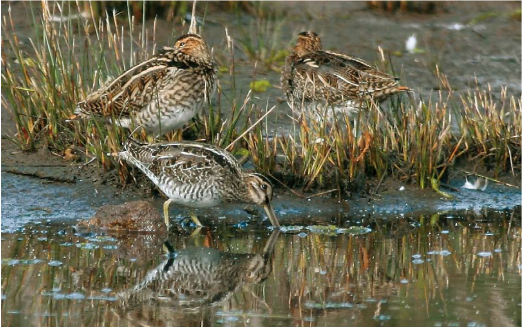
539 Wilson's Snipe / Amerikaanse Watersnip Gallinago delicata , with Common Snipes / Watersnippen G. gallinago , Lower Moors, St Mary's, Scilly, England, 11 October 2007