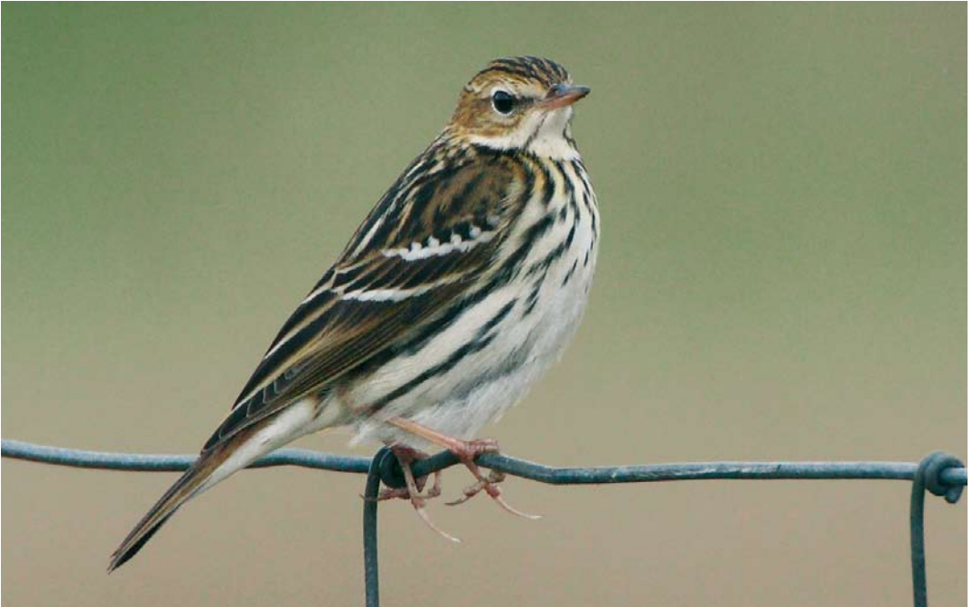
559 Pechora Pipit / Petsjorapieper Anthus gustavi , Toab, Shetland, Scotland, 13 October 2007 (Hugh Harrop)