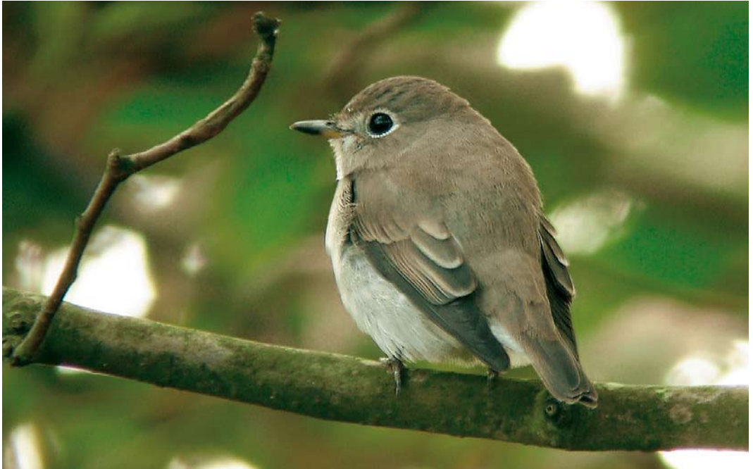
569 Asian Brown Flycatcher / Bruine Vliegenvanger Muscicapa dauurica , first-winter, Flamborough Head, East Yorkshire, England, 4 October 2007 (Paul Hackett)