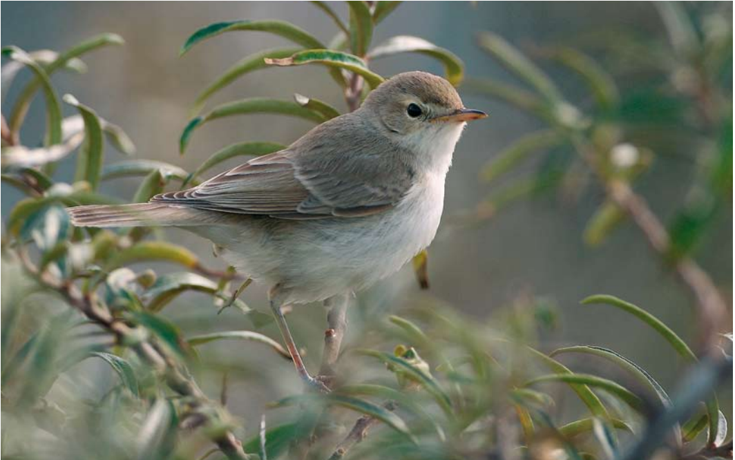
605 Kleine Spotvogel / Booted Warbler Acrocephalus caligatus , Maasvlakte, Zuid-Holland, 15 september 2007