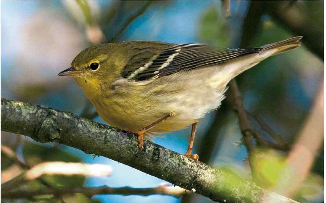
571 Blackpoll Warbler / Zwartkopzanger Dendroica striata , Port Hellick, St Mary's, Scilly, England, 19 October 2007