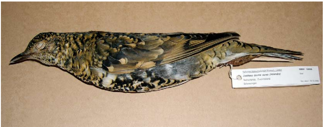
520 Subalpine Warbler / Baardgrasmus Sylvia cantillans , male, Maasvlakte, Zuid-Holland, 11 May 2006 521 Eastern Subalpine Warbler / Oostelijke Baardgrasmus Sylvia cantillans albistriata , male, De Uithof, Den Haag, Zuid-Holland, 28 May 2004 522 White's Thrush / Goudlijster Zoothera aurea (found dead at Scheveningen, Zuid-Holland, on 29 October 2005), Nationaal Natuurhistorisch Museum - Naturalis, Leiden, Zuid-Holland, 23 October 2007

photographed, sound-recorded (E van Saane, P van der Wielen, A B van den Berg et al; The Sound Approach archives; van den Berg et al 2006; Dutch Birding 28: 186, plate 263, 2006); 22 April, Flevocentrale, Lelystad , Flevoland, male, photographed, sound-recorded, videoed (A Vink, D Groenendijk, W Janssen et al; van den Berg et al 2006; Dutch Birding 28: 193, plate 274, 2006).