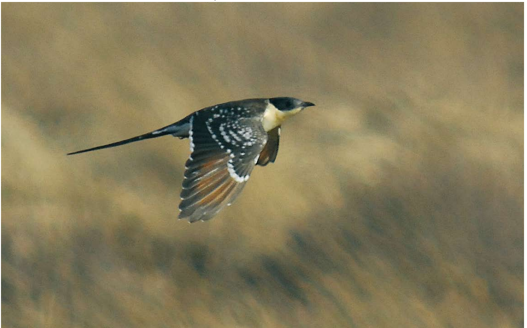
511 Great Spotted Cuckoo / Kuifkoekoek Clamator glandarius , first-summer, Hoge Veluwe, Gelderland, 1 April 2006 (Harm Niesen)