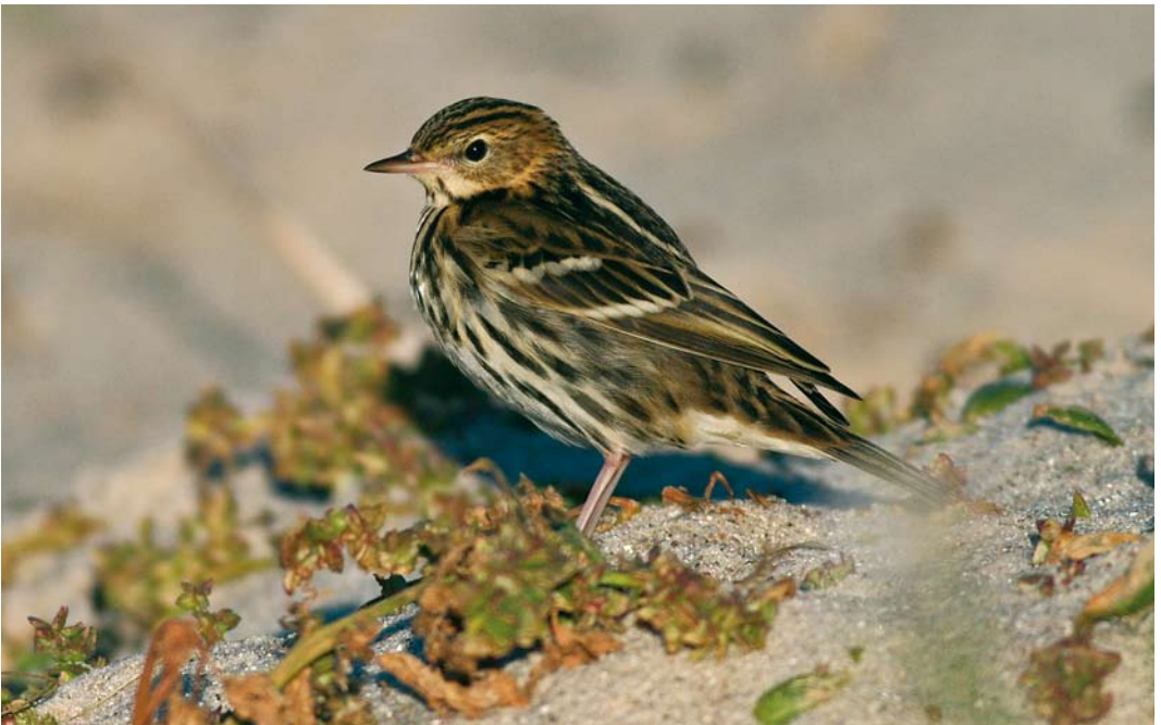
560 Pechora Pipit / Petsjorapieper Anthus gustavi , Helgoland, Schleswig-Holstein, Germany, 4 October 2007