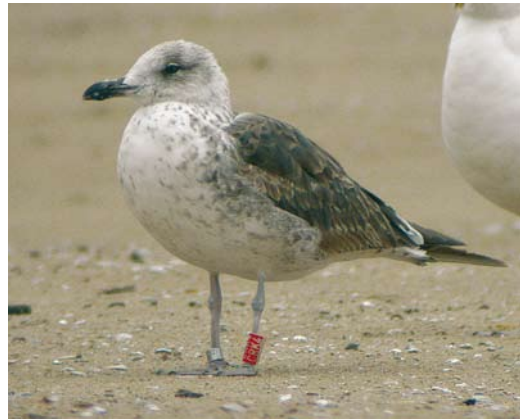
506 Squacco Heron / Ralreiger Ardeola ralloides , Lentevreugd, Wassenaar, Zuid-Holland, 19 June 2006 507 Slender-billed Gull / Dunbekmeeuw Larus genei , Enkhuizen, Noord-Holland, 6 May 2006 508 Greater Sand Plover / Woestijnplevier Charadrius leschenaultii , first-winter, IJmuiden, Noord-Holland, 4 August 2006 509 Baltic Gull / Baltische Mantelmeeuw Larus fuscus fuscus , first-summer, Erasmusgracht, Amsterdam, Noord-Holland, 25 June 2005

The bird at Amstelmeer represents the third October record. The species has been recorded annually since 1999, best years being 2001 (six) and 2004 (five).