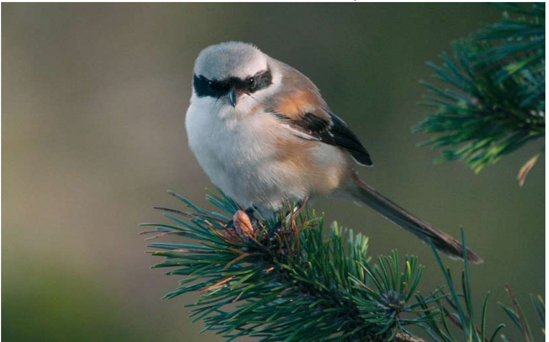
564 Long-tailed Shrike / Langstaartklauwier Lanius schach , first-year male, Skallingen, Blåvand, Vestjylland, Denmark, 17 October 2007