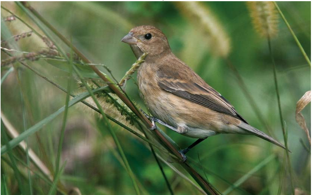
572 Indigo Bunting / Indigogors Passerina cyanea , Ribeira de Ponte, Corvo, Azores, 22 October 2007