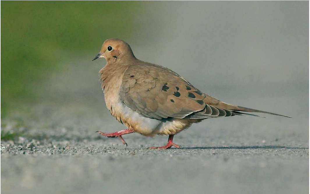
553 American Mourning Dove / Treurduif Zenaida macroura , Inishboffin, Galway, Ireland, 6 November 2007 (Tom McGeehan)