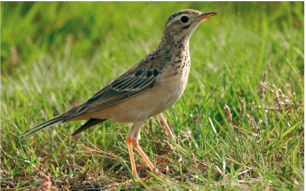
566 Blyth's Pipit / Mongoolse Pieper Anthus godlewskii , first-year, Tresco, Scilly, England, 17 October 2007