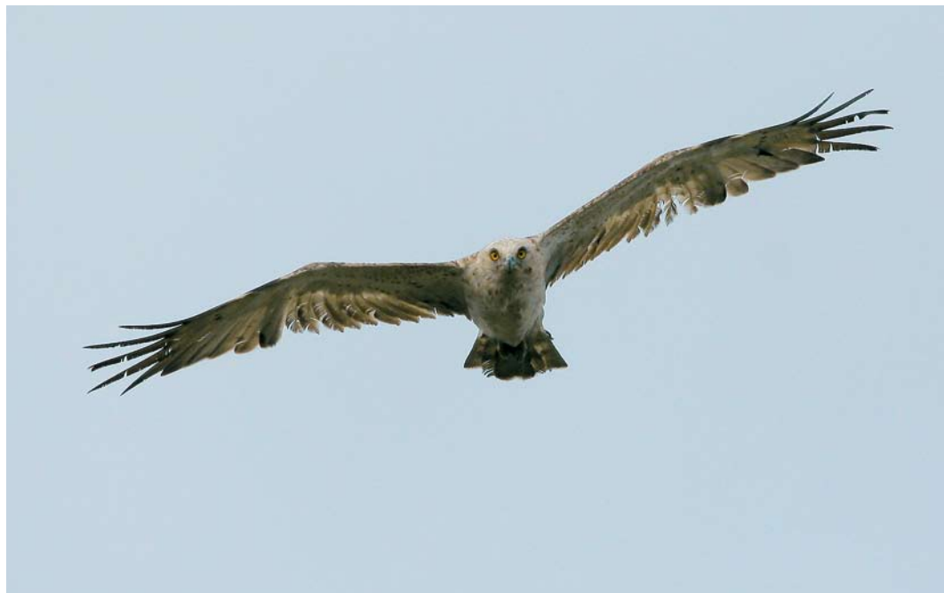
501 Short-toed Eagle / Slangenarend Circaetus gallicus , Meijndel, Zuid-Holland, 4 September 2006 (Renée de Kleijn & George Pieterse)