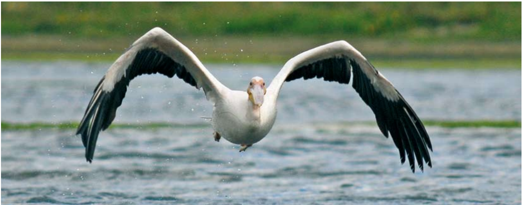
496 Canvasback / Grote Tafeleend Aythya valisineria , adult male, Castricum aan Zee, Noord-Holland, 3 October 2006 ( Harm Niesen ) 497 Baikal Teal / Siberische Taling Anas formosa , male, Polder IJdoorn, Amsterdam, Noord-Holland, 21 May 2006 ( Ruud G M Altenburg ) 498 Great White Pelican / Roze Pelikaan Pelecanus onocrotalus , Mariëndal, Den Helder, Noord-Holland, 9 August 2006 ( Harm Niesen )

Although Bufflehead is not uncommon in captivity with, eg, an estimated 1000 individuals in the Netherlands alone in 2003 (Jan Hartman pers comm), timing, behaviour, location and plumage of the bird involved in these sightings showed no anomalies suggesting captive origin. The CDNA decided to accept all these observations as referring to one wandering individual, because there was no overlap in timing at the various locations (on 2 May, the bird was last seen at Barendrecht in the morning and first seen at Ezumakeeg in the evening, c 200 km to the north-east, so direct proof for the presence of a second bird is not available). It returned the following winters.