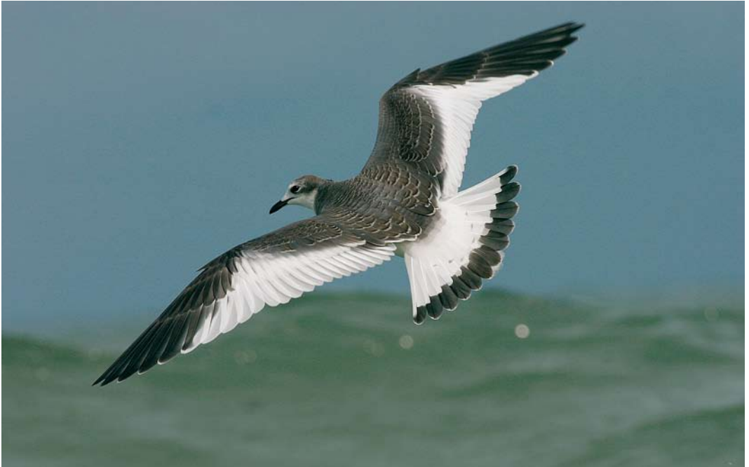
583 Vorkstaartmeeuw / Sabine's Gull Larus sabini , juveniel, Noordzee ten westen van Westkapelle, Continentaal Plat, 29 september 2007