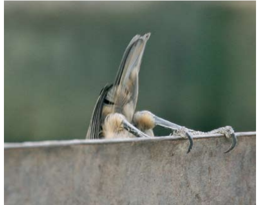
Mystery photograph XII (July)

forehead is connected with the loral patch, which is not the case in the mystery bird.