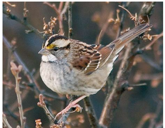
573 Scarlet Tanager / Zwartvleugeltangare Piranga olivacea , Corvo, Azores, 20 October 2007 (Vincent Legrand) 574 Grey-cheeked Thrush / Grijswangdwerglijster Catharus minimus , Poco d'Aqua, Corvo, Azores, 22 October 2007 (Vincent Legrand) 575 White's Thrush / Goudlijster Zoothera aurea , Sumburgh, Shetland, Scotland, 13 October 2007 (Hugh Harrop) 576 Red-flanked Bluetail / Blauwstaart Tarsiger cyanurus , first-year male, Linosa, Sicilia, Italy, 21 October 2007 (Igor Maierano) 577 Yellow-browed Bunting / Geelbrauwgors Emberiza chrysophrys , Gambell, Alaska, USA, 15 September 2007 (Paul Mayer) 578 White-throated Sparrow / Witkeelgors Zonotrichia albicollis , Höfn, Iceland, 13 November 2007 (Yann Kolbeinsson)