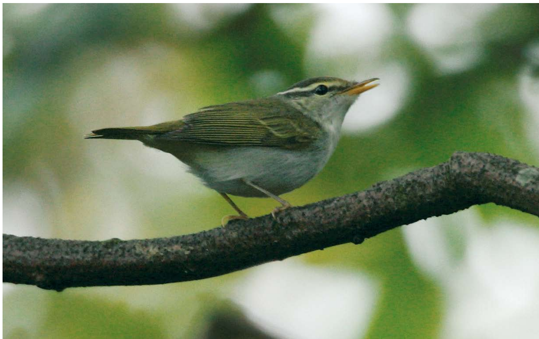
612 Kroonboszanger / Eastern Crowned Warbler Phylloscopus coronatus , Katwijk aan Zee, Zuid-Holland, 5 oktober 2007 (Menno van Duijn)