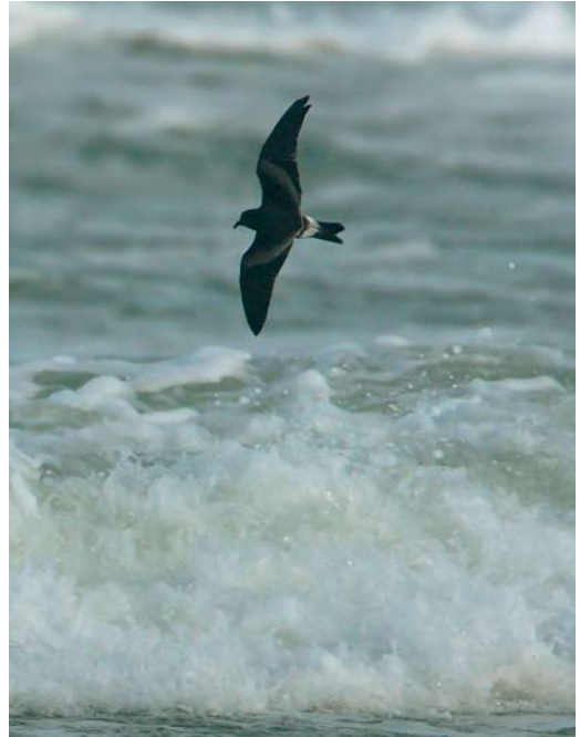
615 Stormvogeltje / European Storm-petrel Hydrobates pelagicus , Flevocentrale, Flevoland, 10 november 2007 616 Vaal Stormvogeltje / Leach's Storm-petrel Oceanodroma leucorhoa , Terschelling, Friesland, 10 november 2007 617 Kleine Alk / Little Auk Alle alle , IJmuiden, Noord-Holland, 18 november 2007