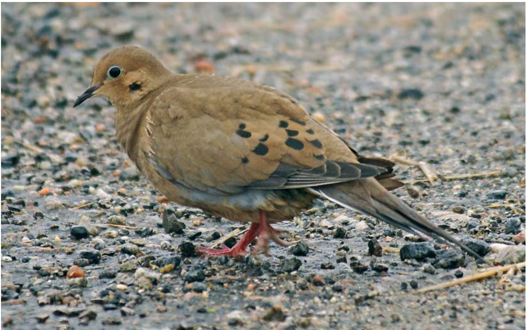
554 American Mourning Dove / Treurduif Zenaida macroura , Carnach, North Uist, Outer Hebrides, Scotland, 1 November 2007