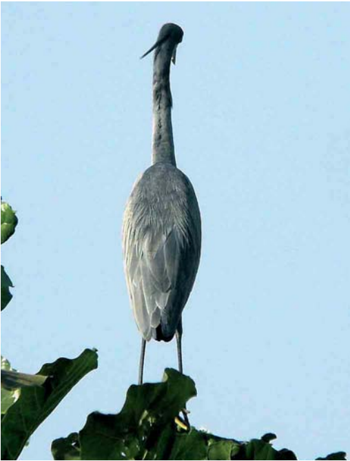
Mystery photograph I (December)