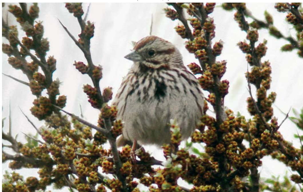
535 Song Sparrow / Zanggors Melospiza melodia , Kabellaarsbank, Zuid-Holland, 30 April 2006