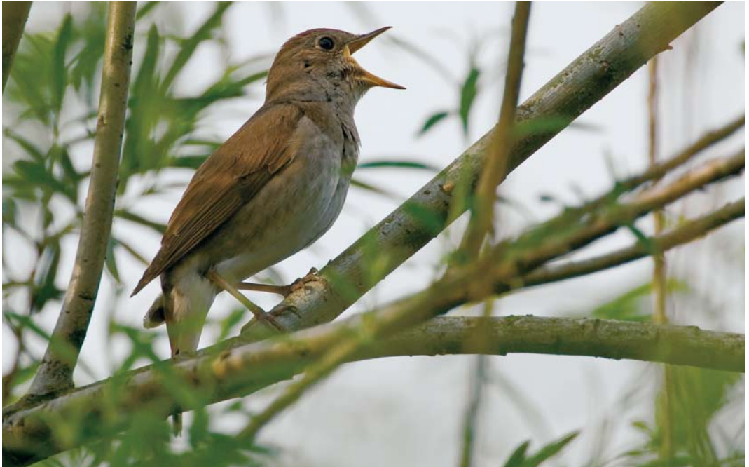
523 Thrush Nightingale / Noordse Nachtegaal Luscinia luscinia , Kessenich, Limburg, 15 May 2006 524 Paddyfield Warbler / Velddrietzanger Acrocephalus agricola , Meijendel, Zuid-Holland, 14 October 2006 525 Collared Flycatcher / Withalsvliegenvanger Ficedula albicollis , adult male, Ginkel-Noord, Gelderland, 5 June 2006