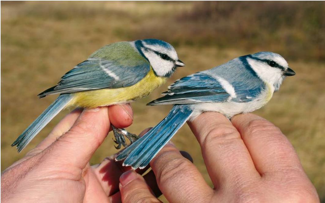
621 'Pleskes Mees' / 'Pleske's Tit' Cyanistes cyanus x caeruleus , met Pimpelmees / European Blue Tit C. caeruleus , Castricum, Noord-Holland, 15 november 2007 (Arnold Wijker)

Deze vangst betreft het tweede geval van 'Pleskes Mees' in Nederland. Op 9 november 1968 werd het eerste exemplaar gevangen op de Bremerbergdijk, Flevoland (Limosa 42: 201-205, 1969). In Dutch Birding 16: 232-234, 1994, werd een overzicht gegeven van vangsten en waarnemingen van 'Pleskes Mees' in Europa; dit werd aangevuld met een oud geval in België in decem-