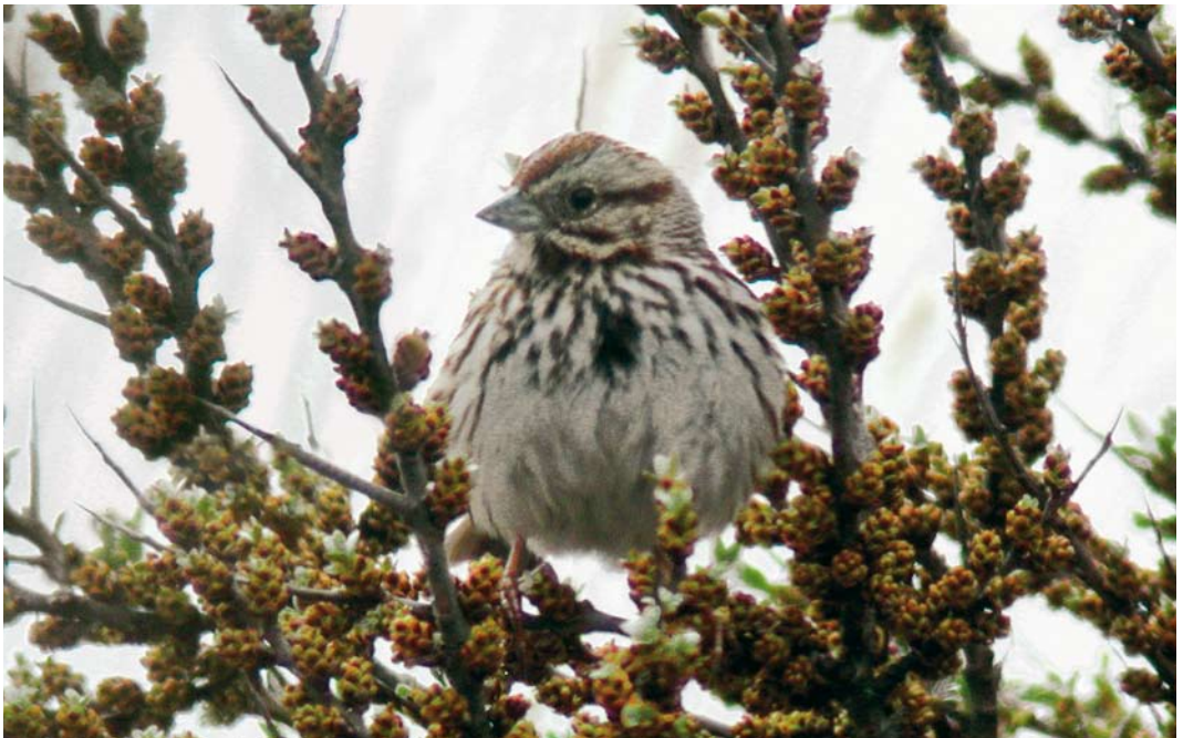
535 Song Sparrow / Zanggors Melospiza melodia , Kabellaarsbank, Zuid-Holland, 30 April 2006