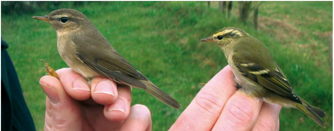
606 Kleine Spotvogel / Booted Warbler Acrocephalus caligatus , Maasvlakte, Zuid-Holland, 15 september 2007 607 Kroonboszanger / Eastern Crowned Warbler Phylloscopus coronatus , Katwijk aan Zee, Zuid-Holland, 5 oktober 2007 608 Bruine Boszanger / Dusky Warbler Phylloscopus fuscatus en Bladkoning / Yellow-browed Warbler P. inornatus , Meijndel, Zuid-Holland, 13 oktober 2007

september elders, barstte de doortrek los op 30 september met op die dag al negen exemplaren. In de eerste twee weken van oktober volgden er c 240 (!), met bijvoorbeeld alleen al 18 op 14 oktober op Vlieland. Tot 22 september volgden er nog eens ruim 60 en daarna tot het eind van de maand nog enkelingen. Vlieland was hét eiland van de phylloscopen dit najaar met van 26 tot 29 oktober ook nog een Humes Bladkoning P. humei bij Lange Paal en op 13 oktober een Raddes Boszanger P. schwarzi bij Bomenland. Op 14 oktober werd op Schiermonnikoog een Raddes gevangen die op 17 oktober nogmaals in het net hing. Op 29 september was er een vroege melding van een Bruine Boszanger P. fuscatus op Vlieland. Er volgden exemplaren op 7 en 8 oktober bij de Eemshaven; op 13 oktober in Meijndel, Zuid-Holland, en één op Vlieland (op 50 m van de eerder gemelde Raddes Boszanger); op 17 oktober bij Dishoek, Zeeland; op 19 en 21 vangsten op (alweer) Vlieland; op