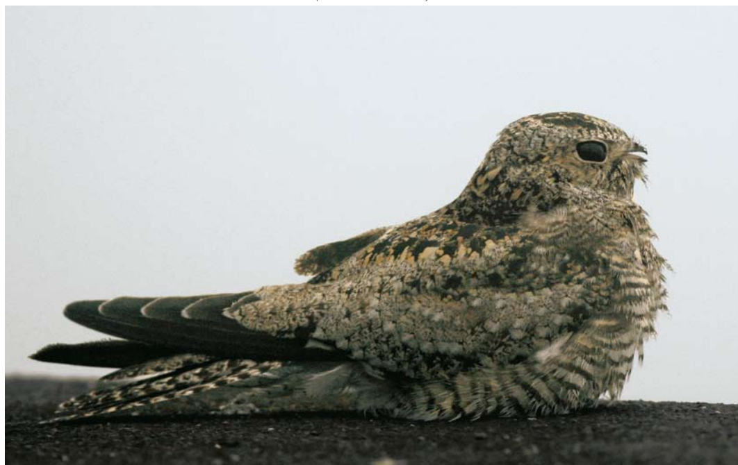
552 Common Nighthawk / Amerikaanse Nachtzwaluw Chordeiles minor , Corvo, Azores, 25 October 2007 (David Monticelli)