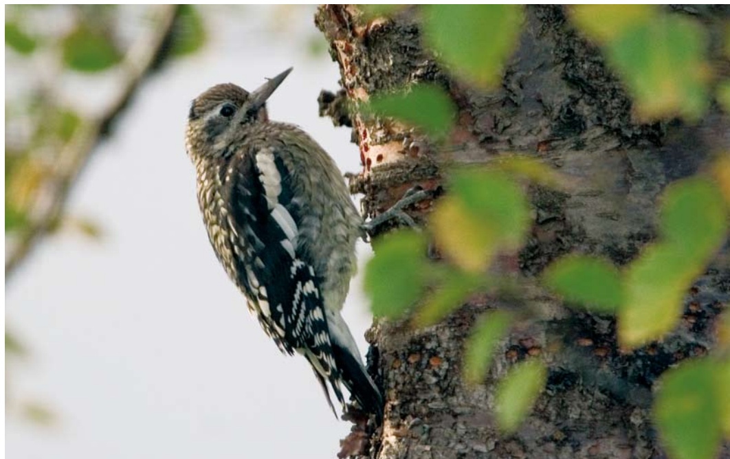
551 Yellow-bellied Sapsucker / Geelbuiksapspecht Sphyrapicus varius , first-year male, Selfoss, Iceland, 8 October 2007