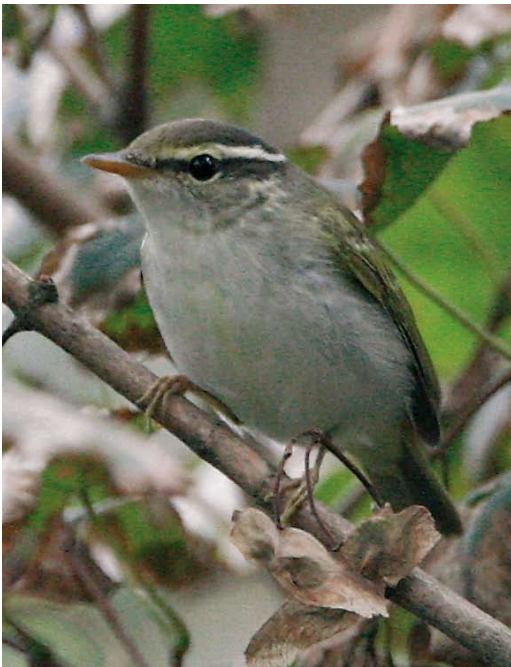
614 Kroonboszanger / Eastern Crowned Warbler Phylloscopus coronatus , Katwijk aan Zee, Zuid-Holland, 5 oktober 2007 (René van Rossum)

hele gevolg vogelaars achter zich aan, wat nog tot gevaarlijke verkeerssituaties leidde. Na terugkeer in zijn favoriete singel werd hij tot c 19:00 gezien. De commotie rond de Kroonboszanger ontging de regionale pers niet en de volgende week kopte de krant met: 'Klein klotevogeltje zet Katwijkse woonwijk op stelten'.