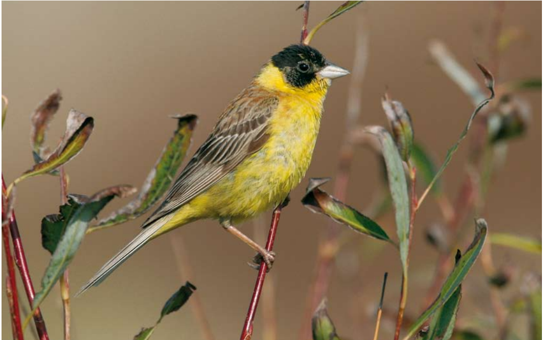
534 Black-headed Bunting / Zwartkopgors Emberiza melanocephala , male, Brouwersdam, Zeeland, 17 October 2006