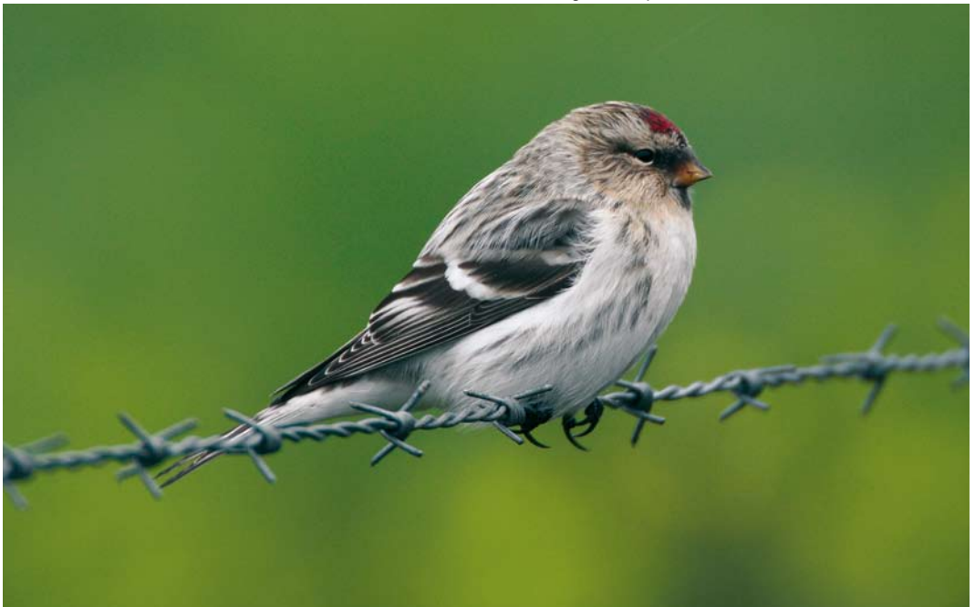
570 Hornemann's Redpoll / Groenlandse Witstuitbarmsijs Carduelis hornemanni hornemanni , Quendale, Shetland, Scotland, 12 October 2007 (Hugh Harrop)