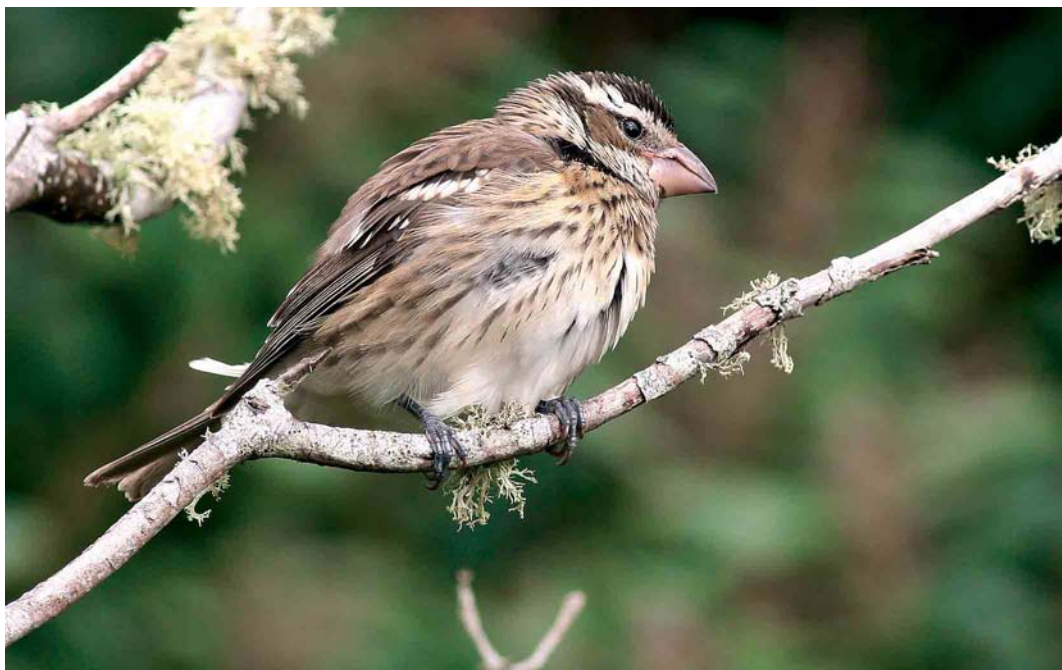
66 Rose-breasted Grosbeak / Roodborstkardinaal Pheucticus ludovicianus , Corvo, Azores, 24 October 2006 (Vincent Legrand) cf Dutch Birding 28: 390, 2006