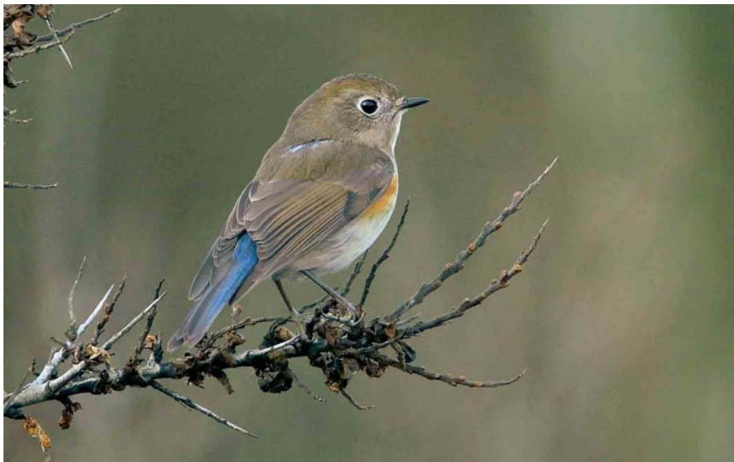
101 Blauwstaart / Red-flanked Bluetail Tarsiger cyanurus , eerste-winter mannetje, Zandvoort, Zuid-Holland, 8 januari 2007