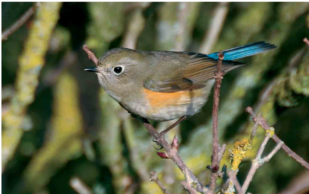
102 Blauwstaart / Red-flanked Bluetail Tarsiger cyanurus , eerste-winter mannetje, Zandvoort, Zuid-Holland, 8 januari 2007