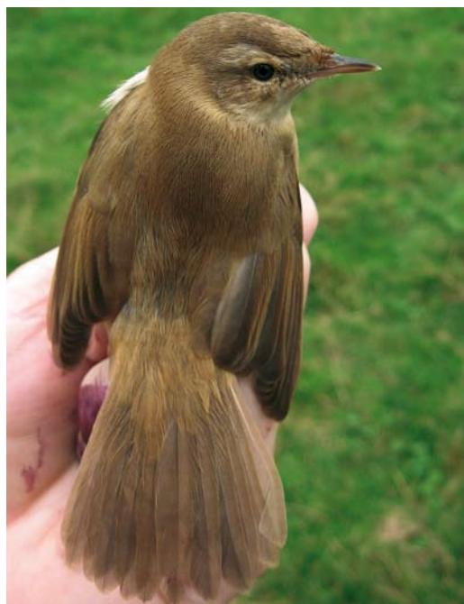
524 Paddyfield Warbler / Velddrietzanger Acrocephalus agricola , Meijendel, Zuid-Holland, 14 October 2006 525 Collared Flycatcher / Withalsvliegenvanger Ficedula albicollis , adult male, Ginkel-Noord, Gelderland, 5 June 2006