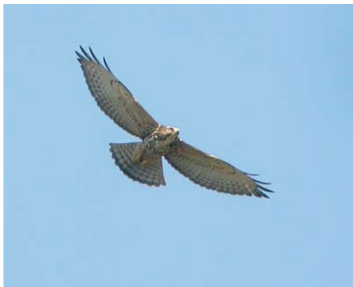
436 Broad-winged Hawk / Breedvleugelbuizerd Buteo platypterus , Cardel, Mexico, 27 October 2006 (Aldo Contreras)