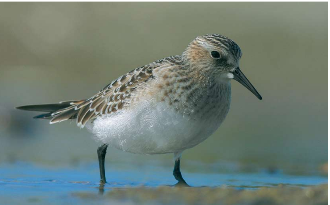
451 Baird's Sandpiper / Bairds Strandloper Calidris bairdii , juvenile, Grenen, Skagen, Nordjylland, Denmark, 4 September 2007