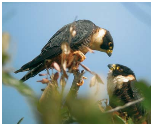
437 Bat Falcon / Vleermuisvalk Falco rufigularis , Cardel, Mexico, 21 February 2002 (Aldo Contreras)

transportation should never pose a problem.