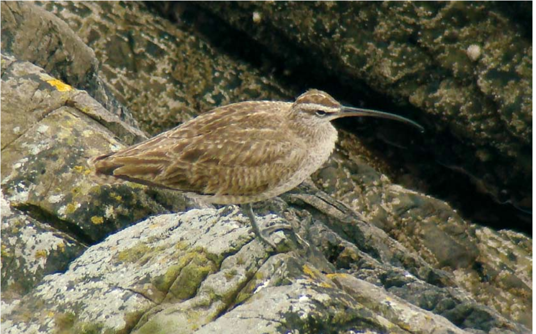
450 Hudsonian Whimbrel / Amerikaanse Regenwulp Numenius hudsonicus , adult, Fair Isle, Shetland, Scotland, 30 August 2007