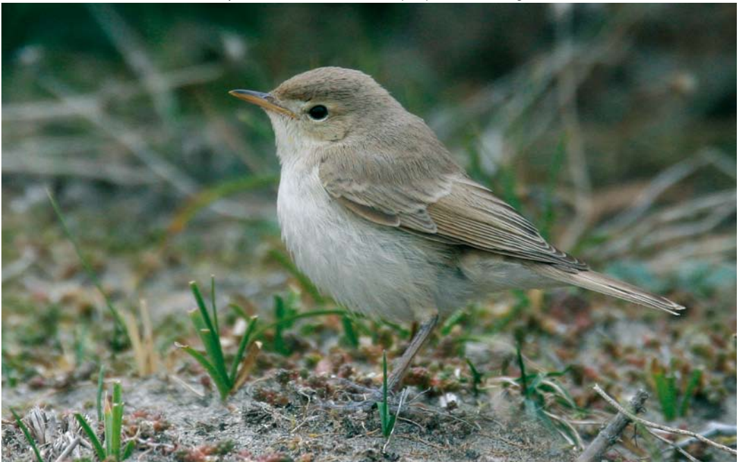
469 Booted Warbler / Kleine Spotvogel Acrocephalus caligatus , first-year, Maasvlakte, Zuid-Holland, Netherlands, 14 September 2007