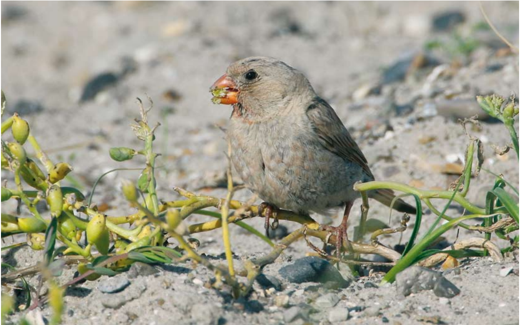
468 Trumpeter Finch / Woestijnvink Bucanetes githagineus , male, Agger Tange, Nordjylland, Denmark, 9 August 2007 ( Ole Krogh )