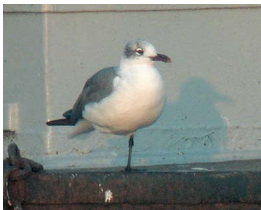
415 Laughing Gull / Lachmeeuw Larus atricilla , adult ('Atze'), Luzern, Luzern, Switzerland, 30 October 2006 416 Laughing Gull / Lachmeeuw Larus atricilla , adult ('Atze'), Zwillbrocker Venn, Nordrhein-Westfalen, Germany, April 2002 417 Laughing Gull / Lachmeeuw Larus atricilla , adult ('Atze'), Blanes, Girona, Spain, 21 January 2007 418 Laughing Gull / Lachmeeuw Larus atricilla , adult ('Atze'), Blanes, Girona, Spain, 17 January 2007 419 Laughing Gull / Lachmeeuw Larus atricilla , adult ('Atze'), Duiven, Gelderland, Netherlands, 25 August 2007