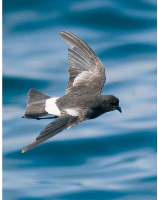
441 Atlantic Yellow-nosed Albatross / Atlantische Geelneusalbatros Thalassarche chlorohynchos, immature, with Greylag Goose / Grauwe Gans Anser anser, Messingham, Lincolnshire, England, 3 July 2007 cf Dutch Birding 29: 242, 2007 442-443 Wilson's Storm-petrel / Wilsons Stormvogeltje Oceanites oceanicus, c 39 km south off Vestmannaeyjar, Iceland, 11 August 2007