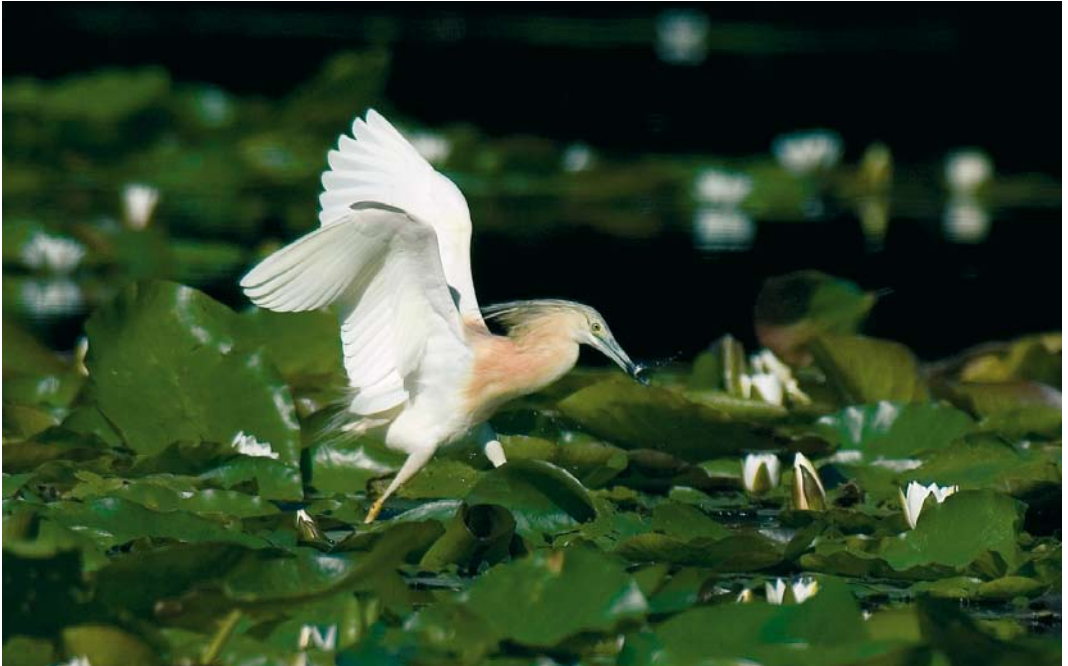
470 Ralreiger / Squacco Heron Ardeola ralloides , adult, Julianadorp, Noord-Holland, 4 augustus 2007 ( Jan-Kees Bossenbroek )