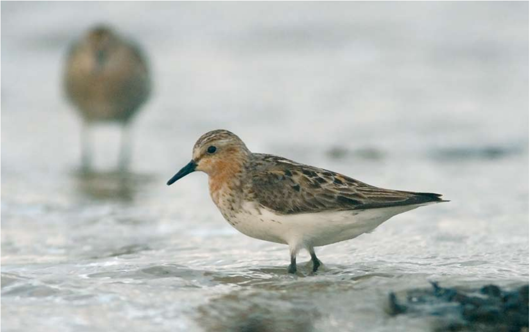
452-453 Red-necked Stint / Roodkeelstrandloper Calidris ruficollis , adult, Carne Beach, Wexford, Ireland, 30 August 2007