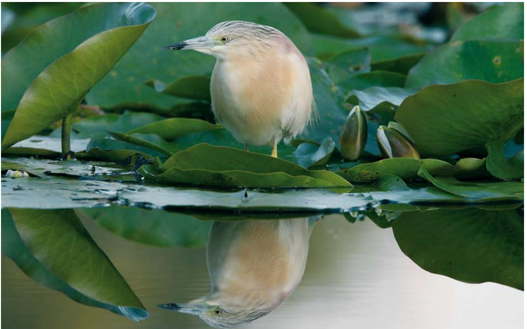
471 Ralreiger / Squacco Heron Ardeola ralloides , adult, Julianadorp, Noord-Holland, 5 augustus 2007