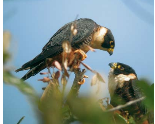
437 Bat Falcon / Vleermuisvalk Falco rufigularis , Cardel, Mexico, 21 February 2002 (Aldo Contreras)

transportation should never pose a problem.