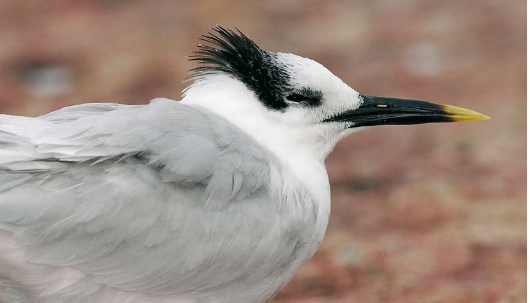
408 American Sandwich Tern / Amerikaanse Grote Stern Sterna sandvicensis acufflava , adult-winter, Sanibel, Florida, USA, 31 January 2007 ( Julian Hough ). Head pattern alone may be first indicator of vagrant acufflava . White forehead to midcrown much more contrasting, with mostly black rear crown having only very limited white tips. This, combined with shorter and thicker-based bill, with quite extensive yellow bill-tip, cause some acufflava to look quite striking. 409 American Sandwich Tern / Amerikaanse Grote Stern Sterna sandvicensis acufflava , adult-winter, Sanibel, Florida, USA, February 2007 ( Julian Hough ). Same individual as in plate 408. Two interesting aspects of plumage can be seen here. Note quite obvious dark irregular spots on tertials which can be found on some adult nominate sandvicensis , although usually not with dark on secondaries as well. Also, newly grown longest primary p8 has white fringe and tip, which is just about too limited for any nominate sandvicensis .