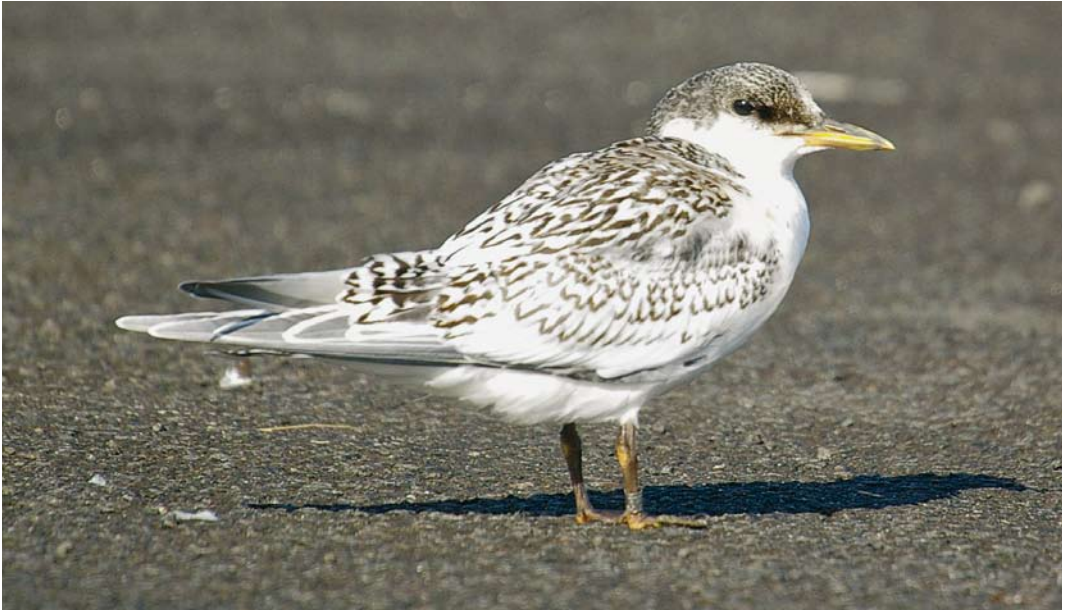
396 Sandwich Tern / Grote Stern Sterna sandvicensis sandvicensis , juvenile, Portrush, Antrim, Northern Ireland, 29 July 2007 ( Derek Charles ). Classic well-marked juvenile nominate sandvicensis with coarse 'U' and 'V' shaped internal marks extensively over mantle, scapulars and especially wing-coverts. Crown mottled dark and tertials strongly variegated black and white. Bare parts of fresh juveniles can show yellow, quite strikingly so on this individual, but overall identification is straightforward. 397 Sandwich Tern / Grote Stern Sterna sandvicensis sandvicensis , juvenile, Portrush, Antrim, Northern Ireland, 29 July 2007 ( Derek Charles ). Example of paler, less well-marked nominate sandvicensis . Coarse patterning is sufficiently obvious on mantle and scapulars but wing-coverts are at paler end of spectrum. Variegated innermost tertials partially hide plainer outer tertials, of which pattern is closer to that of American Sandwich Tern S s acullavida .