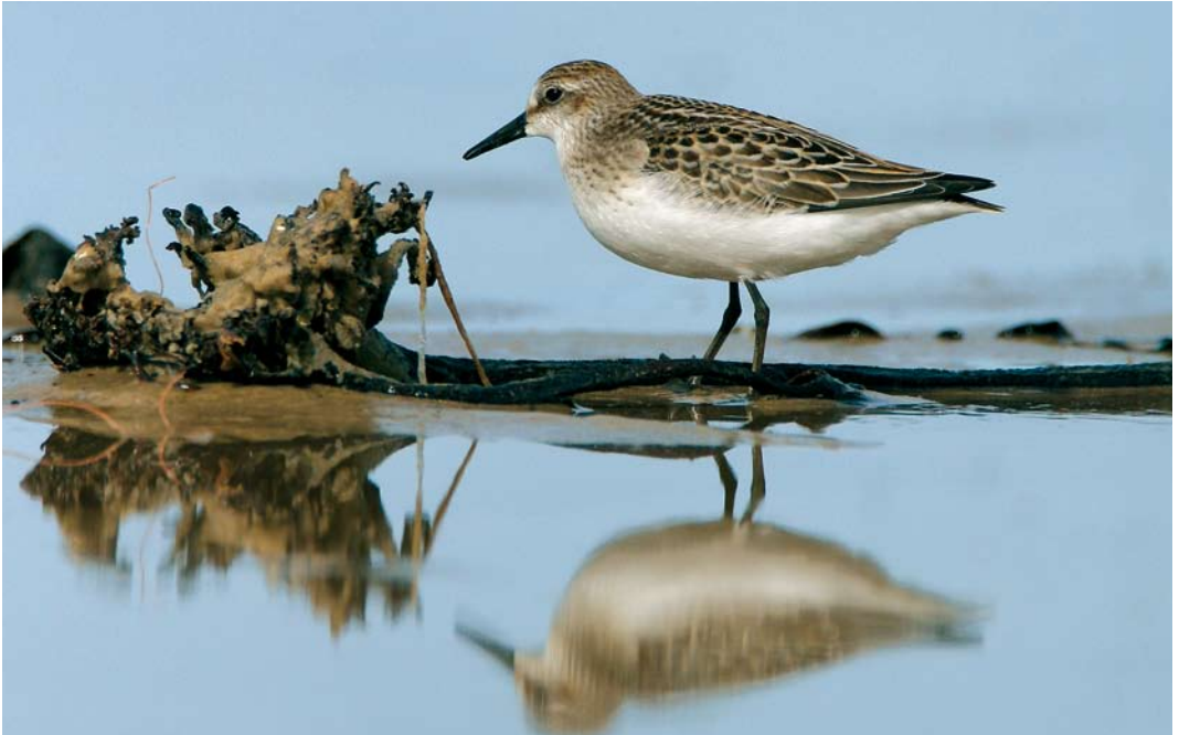
454 Semipalmated Sandpiper / Grijze Strandloper Calidris pusilla , juvenile, Rødhus Strand, Nordjylland, Denmark, 9 September 2007 (Jens Kristian Kjærgård)