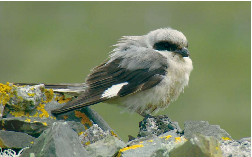
467 Lesser Grey Shrike / Kleine Klappekster Lanius minor , Fair Isle, Shetland, Scotland, 18 August 2007