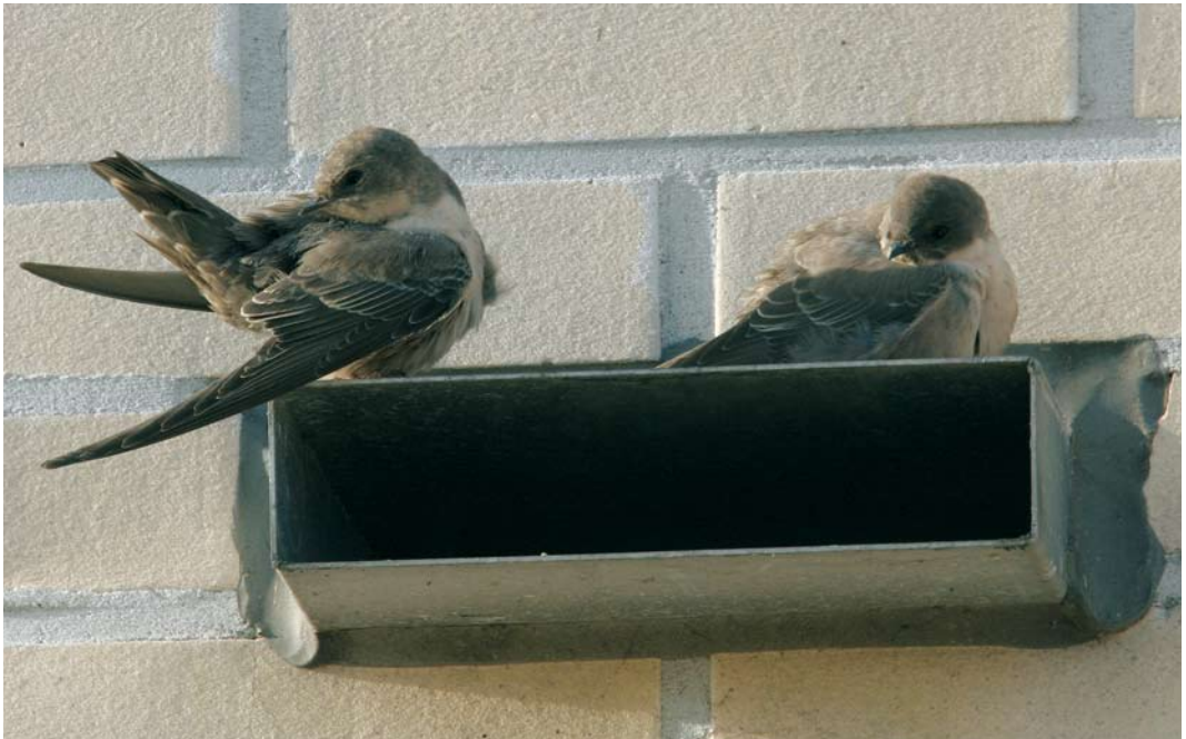
422 Rotszwaluwen / Eurasian Crag Martins Ptyonoprogne rupestris , eerste-winter, Hoorn, Noord-Holland, 18 november 2006

STAART Bovenstaart donkergrijs, vooral van boven contrasterend met stuit. Meerdere lichte vlakjes aanwezig op staart, op bovenstaart goed zichtbaar, niet zo goed op onderstaart.