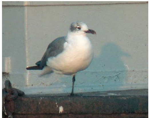
415 Laughing Gull / Lachmeeuw Larus atricilla , adult ('Atze'), Luzern, Luzern, Switzerland, 30 October 2006 416 Laughing Gull / Lachmeeuw Larus atricilla , adult ('Atze'), Zwillbrocker Venn, Nordrhein-Westfalen, Germany, April 2002 417 Laughing Gull / Lachmeeuw Larus atricilla , adult ('Atze'), Blanes, Girona, Spain, 21 January 2007 418 Laughing Gull / Lachmeeuw Larus atricilla , adult ('Atze'), Blanes, Girona, Spain, 17 January 2007 419 Laughing Gull / Lachmeeuw Larus atricilla , adult ('Atze'), Duiven, Gelderland, Netherlands, 25 August 2007