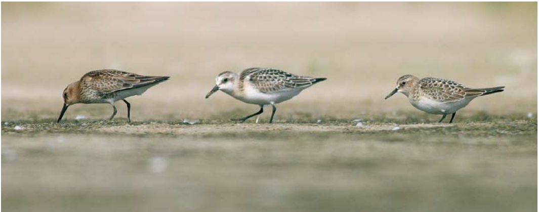
459 Sharp-tailed Sandpiper / Siberische Strandloper Calidris acuminata , adult, Rockanje, Zuid-Holland, Netherlands, 14 July 2007 460 Greater Sand Plover / Woestijnplevier Charadrius leschenaultii , Groote Keeten, Noord-Holland, Netherlands, 2 August 2007 461 Baird's Sandpiper / Bairds Strandloper Calidris bairdii (right), with Dunlin / Bonte Strandloper C. alpina (left) and Sanderling / Drieteenstrandloper C. alba , juveniles, Grenen, Skagen, Nordjylland, Denmark, 1 September 2007

4 September (juvenile), at Ballycotton, Cork, Ireland, on 2-3 September, and at Garður on 14 September (juvenile and sixth for Iceland). In Scotland, a Solitary Sandpiper Tringa solitaria was photographed on St Kilda, Outer Hebrides, on 27-28 August. Wilson's Phalaropes Phalaropus tricolor were present, for instance, in Schleswig-Holstein at Beltringharder Koog and Rickels-bull Koog on 4-7 and 18-22 August (adult winter), in England in Durham, North Yorkshire, and Buckinghamshire on 15-26 August (adult), in Wexford from 28 August to 2 September (juvenile), at Stanpit Marsh, Dorset, England, from 6 September, and at Belfast Lough, Antrim, Northern Ireland, from 8 September (juvenile).