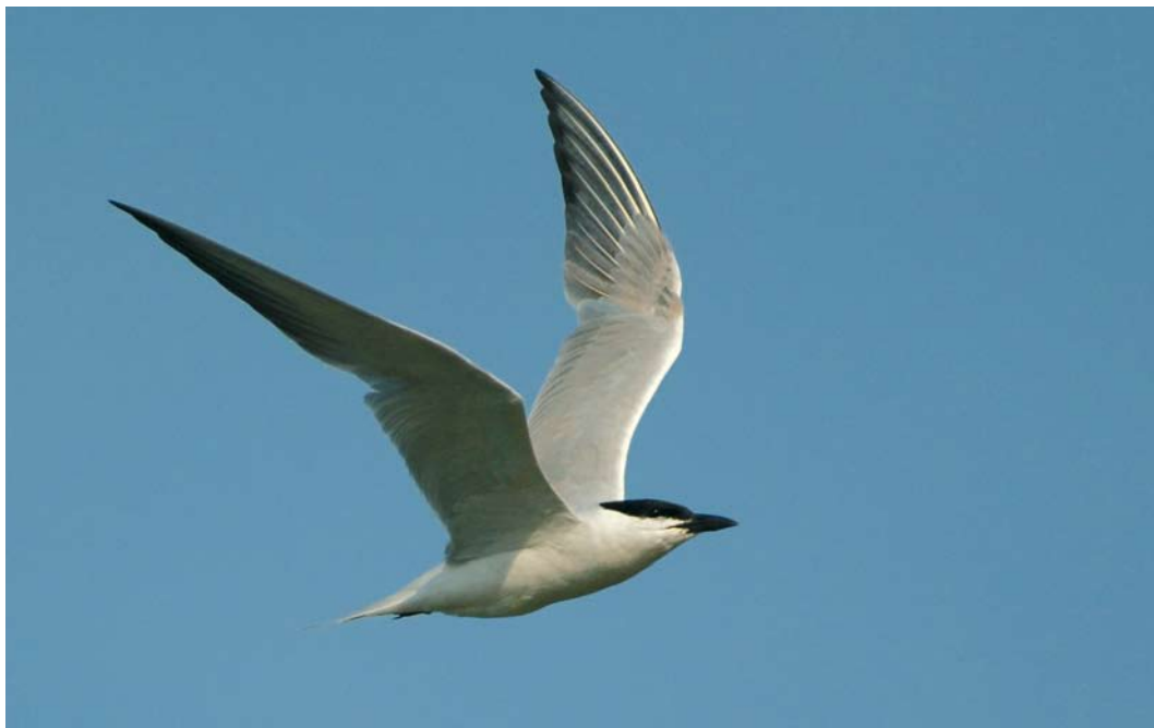
474 Lachstern / Gull-billed Tern Gelochelidon nilotica , adult, 't Zand, Noord-Holland, 1 augustus 2007 (Harm Niesen)