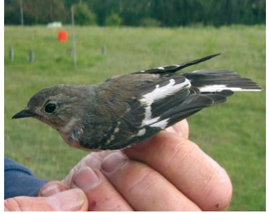
494-495 Withalsvliegenvanger / Collared Flycatcher Ficedula albicollis , eerstejaars, Meijndel, Wassenaar, Zuid-Holland, 14 september 2007

PADDYFIELD WARBLERS On 21 August 2007, one adult female and two first-year Paddyfield Warblers Acrocephalus agricola were trapped together in one mistnet at Kroons Polders, Vlieland, Friesland. The adult was a female with a clear brood patch. On 28 August, a third first-year was trapped in another mistnet at the same site. If accepted, these birds represent the 19th and 20th record (19th to 22nd individual) and, even more interestingly, probably indicate the first breeding record for the Netherlands.