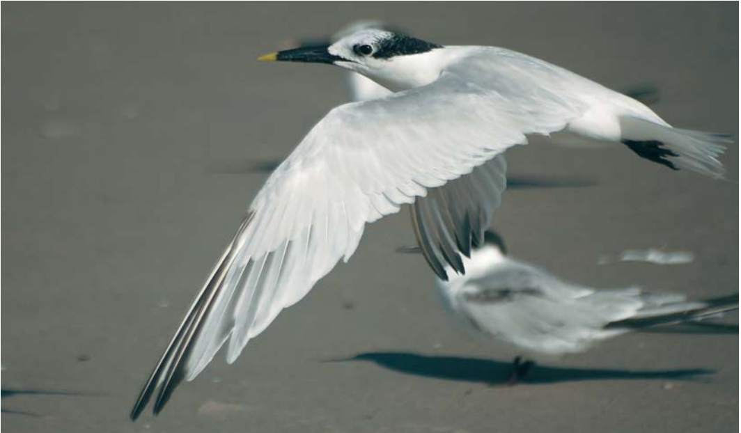
406 American Sandwich Tern / Amerikaanse Grote Stern Sterna sandvicensis acufflava , adult-winter, Florida, USA, 2 November 2005. One aspect of acufflava plumage is that they have more dark areas in fresh winter plumage than nominate sandvicensis , including variable amounts of dark in secondaries, tail-feathers, primary coverts and tertials. Some dark can be seen here on secondaries and tail, and forehead and crown are very white contrasting sharply with jet-black (not white peppered) rear crown. Longest new grown outer primaries appear to have very little black at tips and along fringe, which is usually much more obvious in nominate sandvicensis .

shorter than those on similar-aged acufflava with obvious white fringing and tips. This produces a more 'white-peppered' or speckled effect over the black feathering on the rear crown and nape.