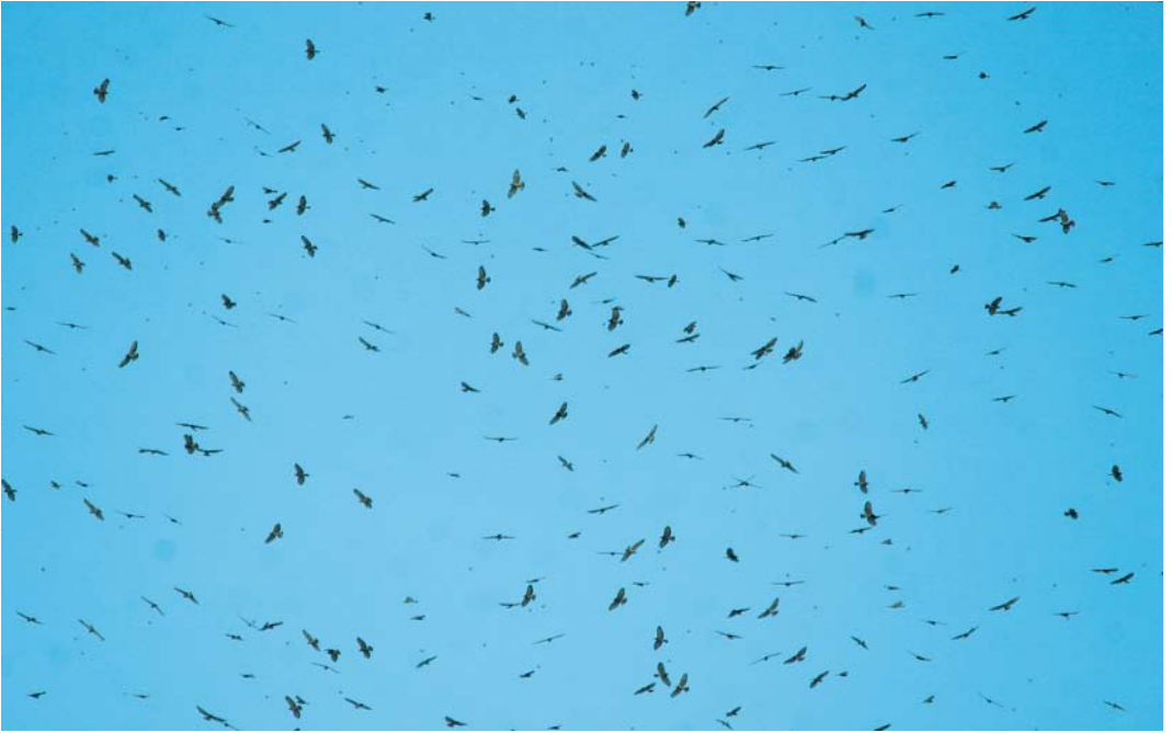
431-432 Broad-winged Hawks / Breedvleugelbuizerds Buteo platypterus , Veracruz, Mexico, 1 October 2004