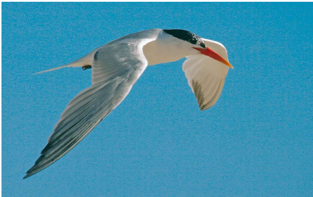
444-445 Elegant Tern / Sierlijke Stern Sterna elegans , adult, Banc d'Arguin, Gironde, France, 8 August 2007