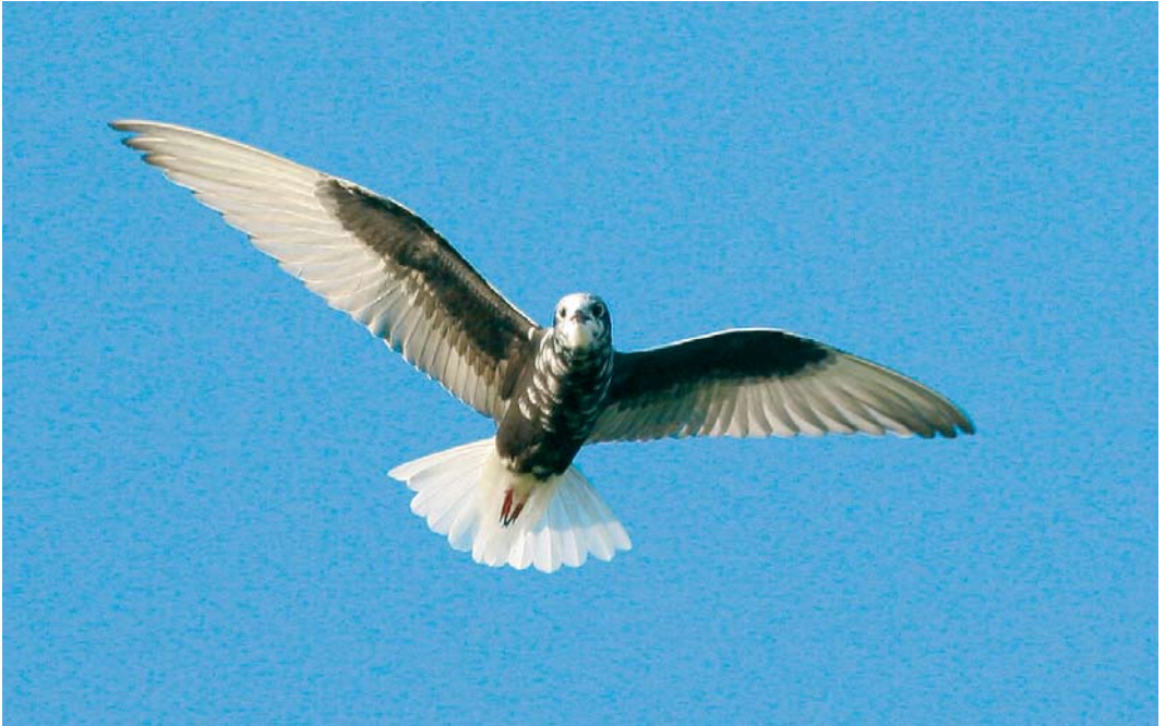
476 Witvleugelstern / White-winged Tern Chlidonias leucopterus , adult, Stolwijk, Zuid-Holland, 13 juli 2007 477 Zwarte Ooievaar / Black Stork Ciconia nigra , juveniel, Oostwoud, Medemblik, Noord-Holland, 20 augustus 2007 478 Woestijnplevier / Greater Sand Plover Charadrius leschenaultii , Grootte Keeten, Noord-Holland, 3 augustus 2007