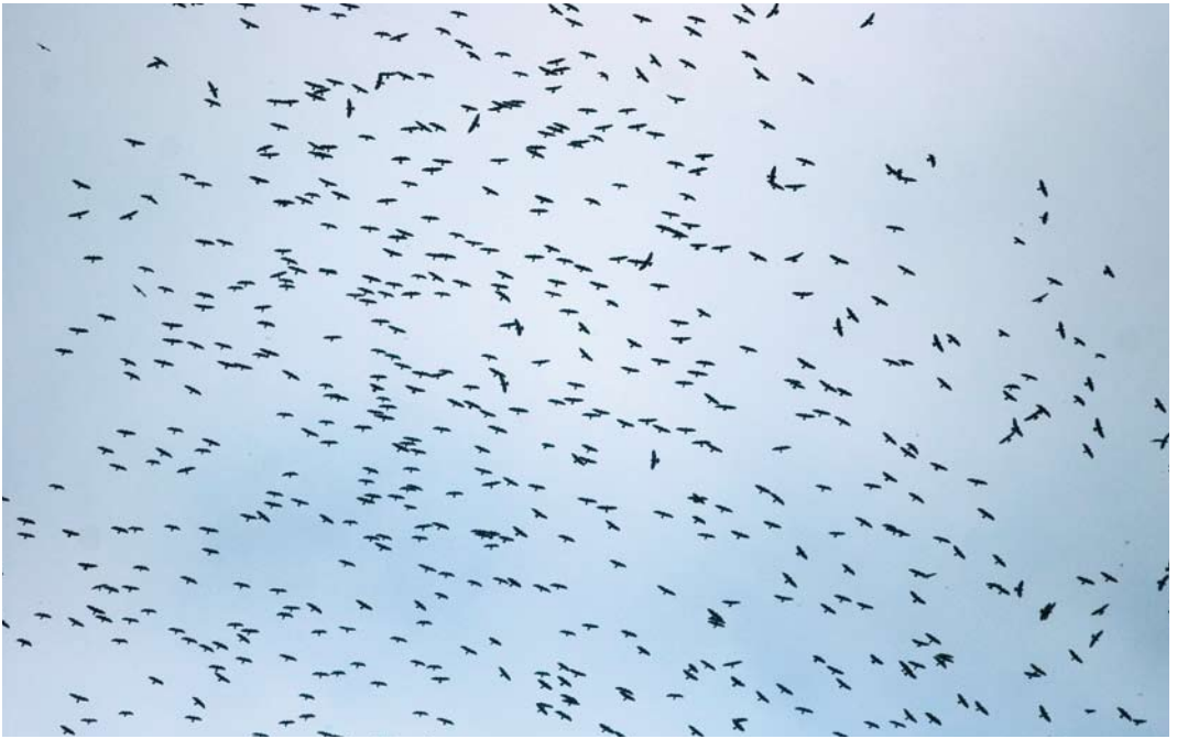
433 Broad-winged Hawks / Breedvleugelbuizerds Buteo platypterus , Veracruz, Mexico, 1 October 2004 434 Hawkwatch tower, Chichicaxtle, Veracruz, Mexico, 11 October 2003 435 Swainson's Hawks / Prairiebuizerds Buteo swainsoni , Chavarrillo, Mexico, 8 April 2005