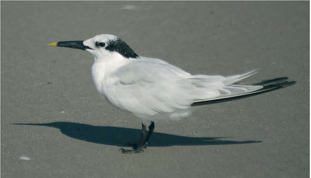
407 American Sandwich Tern / Amerikaanse Grote Stern Sterna sandvicensis acullavida , adult-winter, Florida, USA, 2 November 2005. Primaries are moulting, with two to three old worn and blackish outer primaries remaining. New fresh primaries are key to separating adult-winter acullavida and nominate sandvicensis . P7 (longest new primary) has insufficient white along fringe and at tip for sandvicensis and this, together with very black rear crown feathers with only tiny amount of white, enables identification. Bill, while slightly decurved, is also quite deep based. This bird would probably look clearly smaller alongside nominate sandvicensis .

pears to hold true. Therefore, the value placed on this difference to the identification process is high. However, it may only be obvious (and diagnostic) on fresh, newly grown feathers. The effects of wear will make this difference less apparent on older, darker outer primaries as the white fringes and tips wear off, so an evaluation of the age of the feathers based on their overall appearance, combined with knowledge of moult patterns and time of year, is crucial.