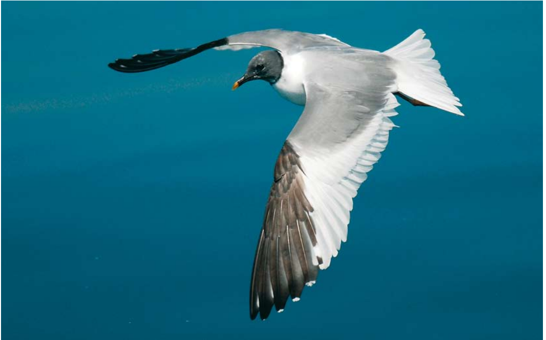
446 Sabine's Gull / Vorkstaartmeeuw Larus sabini , adult, off Portimão, Portugal, 26 August 2007