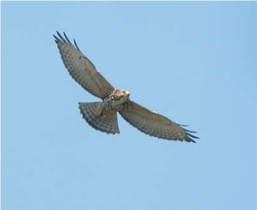
436 Broad-winged Hawk / Breedvleugelbuizerd Buteo platypterus , Cardel, Mexico, 27 October 2006 (Aldo Contreras)