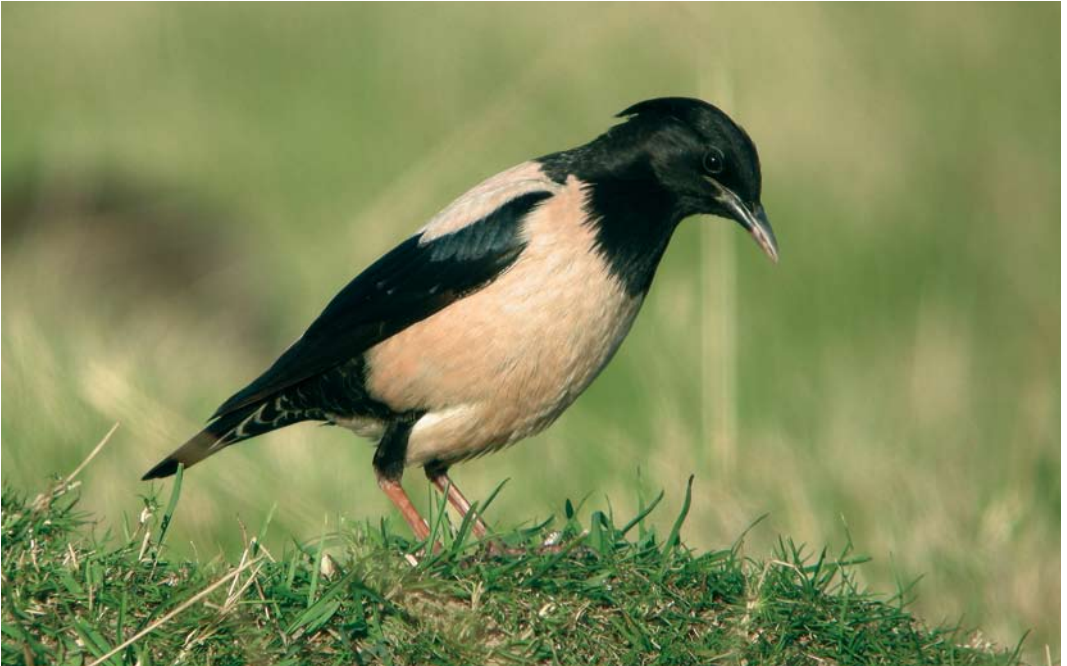
466 Rose-coloured Starling / Roze Spreeuw Sturnus roseus , adult, Ouessant, Finistère, France, 2 August 2007