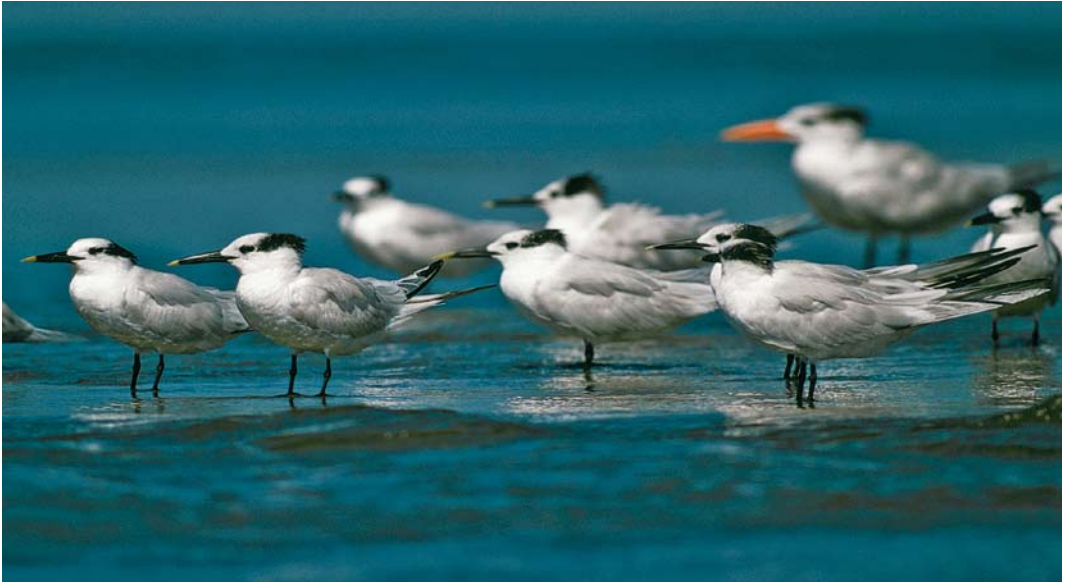
414 American Sandwich Terns / Amerikaanse Grote Sterns Sterna sandvicensis aculavida , adult-winter and first-winter, Dominical, Costa Rica, 12 January 2001

America. London. Ouweneel, G L 1989. Wintering of Sandwich Tern in the Netherlands. Dutch Birding 11: 172-174. Scharringa, J 1979. American Sandwich Tern in the Netherlands.