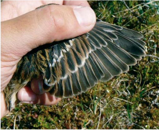
Mystery photograph IX (June)