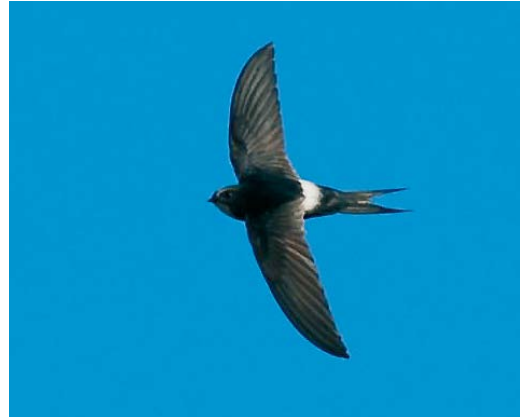
464-465 White-rumped Swift / Kaffergierzwaluw Apus caffer , Algarve, Portugal, 20 May 2007 (Ray P Tipper)