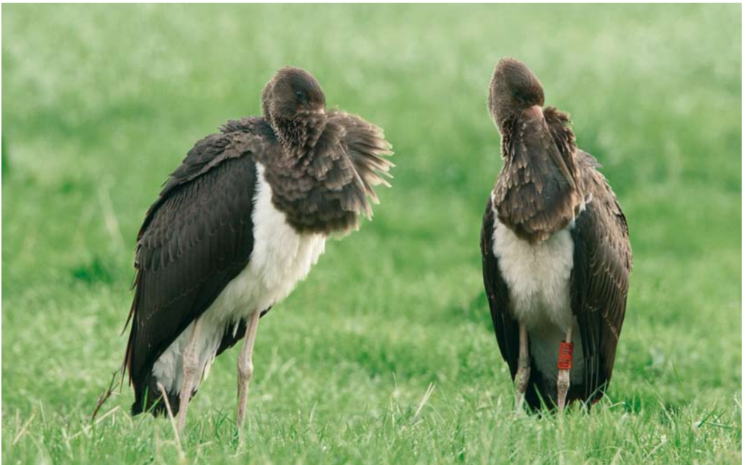
473 Zwarte Ooievaars / Black Storks Ciconia nigra , juveniel, De Uithof, Utrecht, Utrecht, 17 augustus 2007 (Michel Veldt)