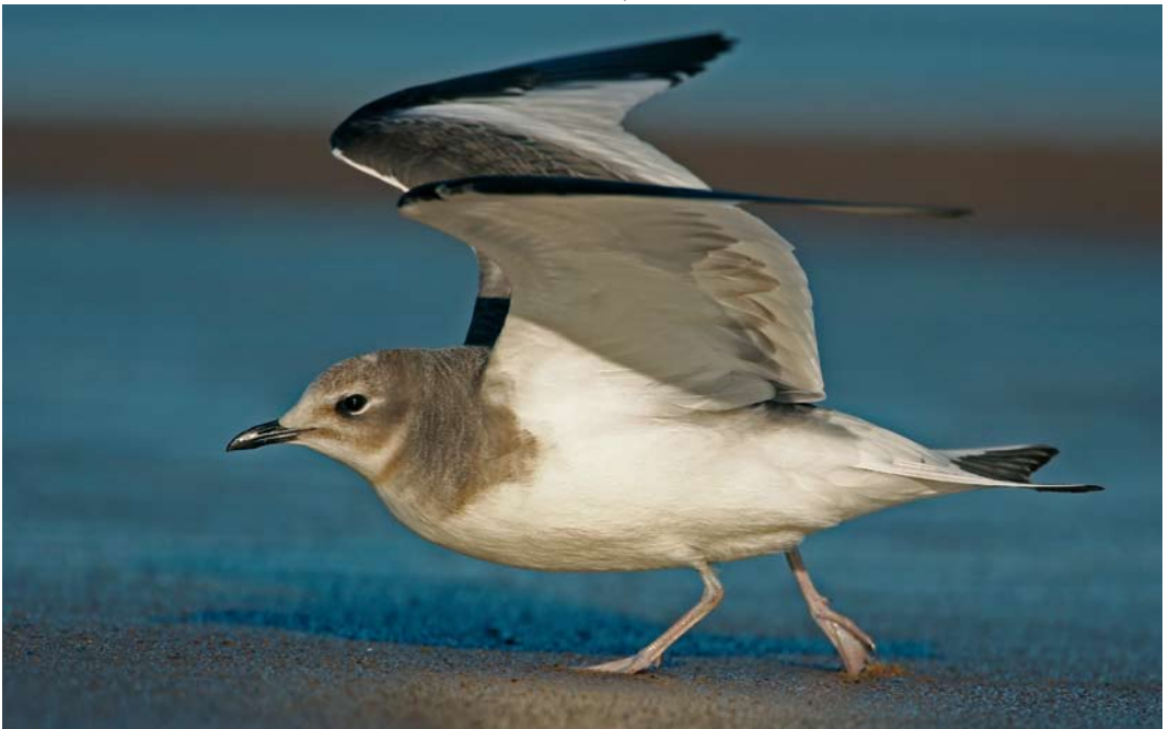
447 Sabine's Gull / Vorkstaartmeeuw Larus sabini , juvenile, Ujscie Wisly, Gdąnsk, Poland, 13 September 2007