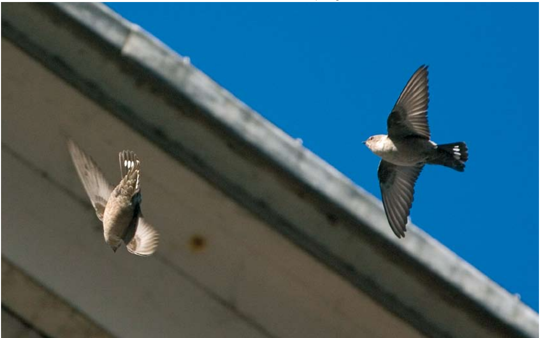
421 Rotszwaluwen / Eurasian Crag Martins Ptyonoprogne rupestris , eerste-winter, Hoorn, Noord-Holland, 18 november 2006