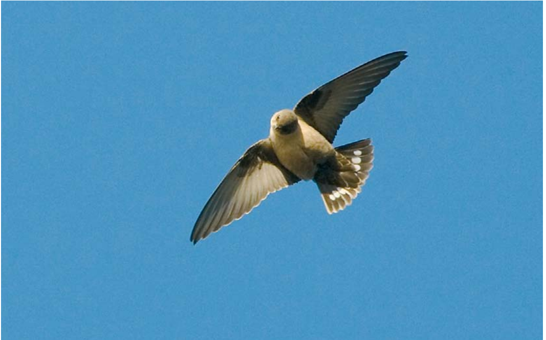
420 Rotszwaluw / Eurasian Crag Martin Ptyonoprogne rupestris , eerste-winter, Hoorn, Noord-Holland, 18 november 2006 ( Bas van den Boogaard )