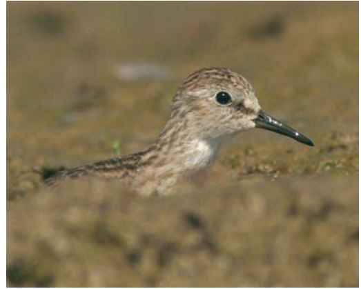
Mystery photograph X (December)

the entire length of the tail-feather, as shown by the mystery bird, is never shown by Eastern Imperial and the bird, therefore, must be a Steppe Eagle.