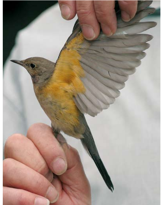
488-489 Perzische Roodborst / White-throated Robin Irania gutturalis , eerstejaars, Sint Laureins, Oost-Vlaanderen (Kjell Janssens)