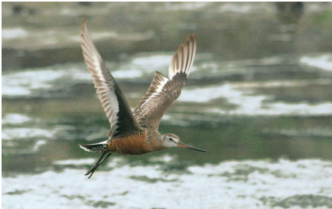
448-449 Hudsonian Godwit / Rode Grutto Limosa haemastica , adult male, Cabo da Praia, Terceira, Azores, 25 July 2007 (Peter Alfrey & Simon Buckell)