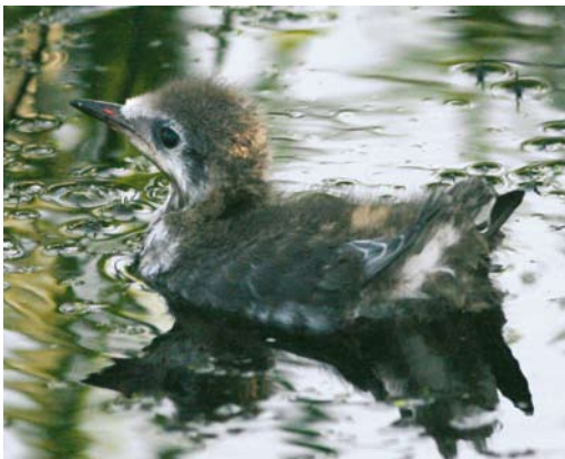
490 Witvleugelstern / White-winged Tern Chlidonias leucopterus , pullus, Stolwijk, Zuid-Holland, 13 juli 2007 (Arjan Boele)