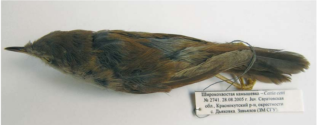
430 Cetti's Warbler / Cetti's Zanger Cettia cetti orientalis , first-year (collected at Diakovka, Krasnyi Kut district, Saratov region, Russia, on 28 August 2005), Zoological Museum of Saratov State University, Saratov, Russia, August 2006 (Vasily G. Tabachishin)

from the first location highlighted the questions about the species' status and distribution in the Saratov region, and it was decided that additional studies were required. To this goal, more than 20 expeditions by Saratov State University (biological department) and A. N. Severtsov Institute for Ecology and Evolution RAS (Saratov branch) to the extreme south-east of the Saratov region have been carried out in 1995-2006. The majority of these expeditions have not been successful, indicating that the species is rather rare, or absent in some years. In some cases, however, the species' presence in floodland sites was confirmed by singing individuals though no birds