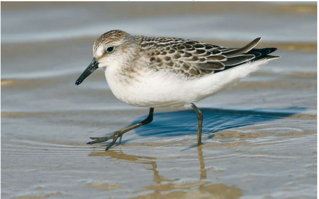
455 Semipalmated Sandpiper / Grijze Strandloper Calidris pusilla , juvenile, Rødhus Strand, Nordjylland, Denmark, 9 September 2007 (Ole Krogh)