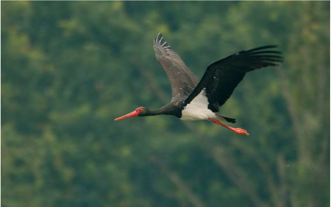
472 Zwarte Ooievaar / Black Stork Ciconia nigra , adult, De Banen, Nederweert, Limburg, 2 augustus 2007