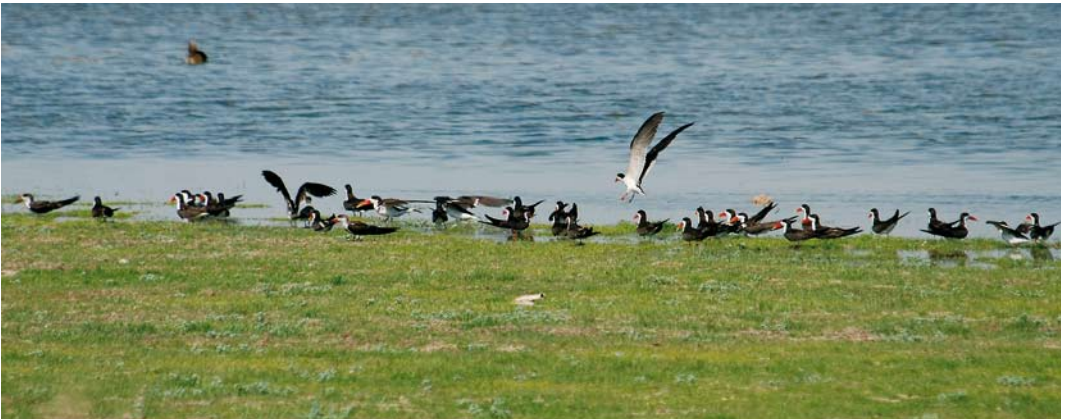
456 American Black Tern / Amerikaanse Zwarte Stern Chlidonias niger surinamensis , adult summer, Funchal harbour, Madeira, 18 August 2007 457 Laughing Gull / Lachmeeuw Larus atricilla , Swibno, near Gdąnsk, Poland, 14 July 2007 458 African Skimmers / Afrikaanse Schaarbekken Rynchops flavirostris , Lake Nasser, Abu Simbel, Egypt, 27 July 2007

at Køge, Sjælland (adult), on 28 July, at Neuwerk, Hamburg, Germany, on 1-2 August, at Oare Marshes, Kent, England, on 10-11 August, at Haversi, Estonia, on 22 August (adult), at Olwersum, Schleswig-Holstein, on 1 September and at Sammy's Point, East Yorkshire, England, on 8 September (adult). The adult at Rockanje, Zuid-Holland, the Netherlands, was not seen after 14 July. The first Hudsonian Godwit Limosa haemastica for the Azores was an adult summer on 25 July at Cabo da Praia, Terceira, where a long-staying Semipalmated Plover C semipalmatus was also present (until at least late September). A female Bar-tailed Godwit L lapponica (E7) fitted with a satellite transmitter at Miranda, Firth of Thames, New Zealand, on 6 February 2007 made world news again when returning to this spot on 7 September after a logged flight of 29 181 km. On 17 March, it first went 10 219 km to Yalu Jiang, China, near the border of North Korea, where it arrived on 24 March after flying 181 h non-stop; it then departed on 1 May to reach