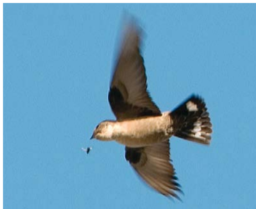
423-424 Rotszwaluw / Eurasian Crag Martin Ptyonoprogne rupestris , eerste-winter, Hoorn, Noord-Holland, 18 november 2006

GEDRAG Gemakkelijke vlucht met kantelen en draaien, afgewisseld met korte vleugelslagen gevolgd door korte glijvluchten. Na ontmoeting met Sperwer wat rustiger vliegend met rechtere vlucht, afgewisseld met korte glijvluchten. Tijdens waarneming staart regelmatig wijd uitgespreid.