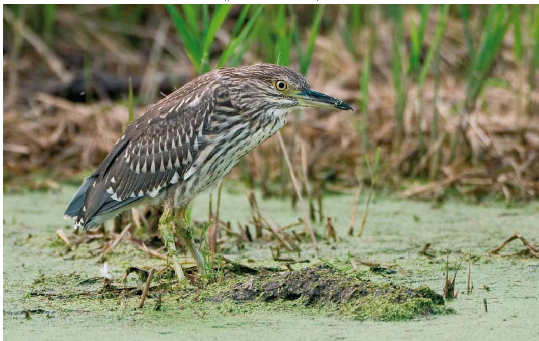
475 Kwak / Black-crowned Night Heron Nycticorax nycticorax , juveniel, Woerden, Utrecht, augustus 2007