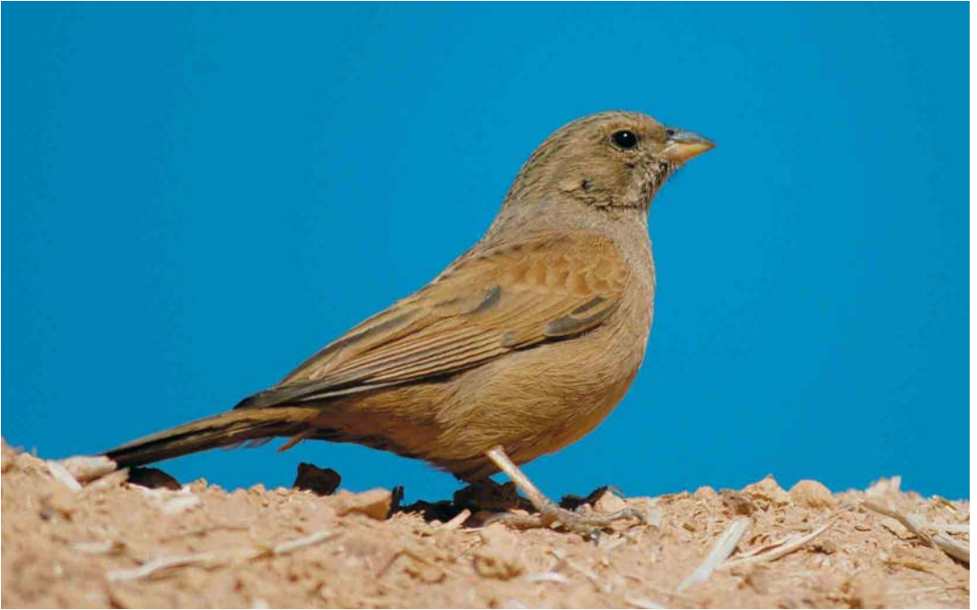
19 House Bunting / Huisgors Emberiza sahari , female, Boumalne Dadès, Dadès-Draa, Morocco, 1 April 2006