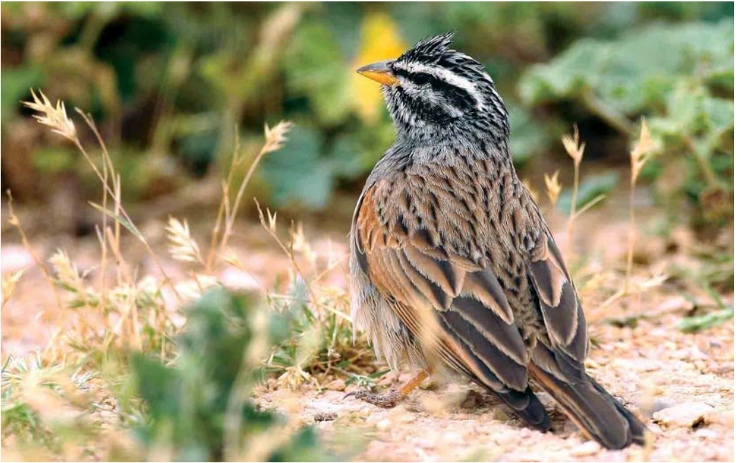
1 Striated Bunting / Gestreepte Gors Emberiza striolata , adult male, Negev, Israel, March 2005 (Hadoram Shirihai)