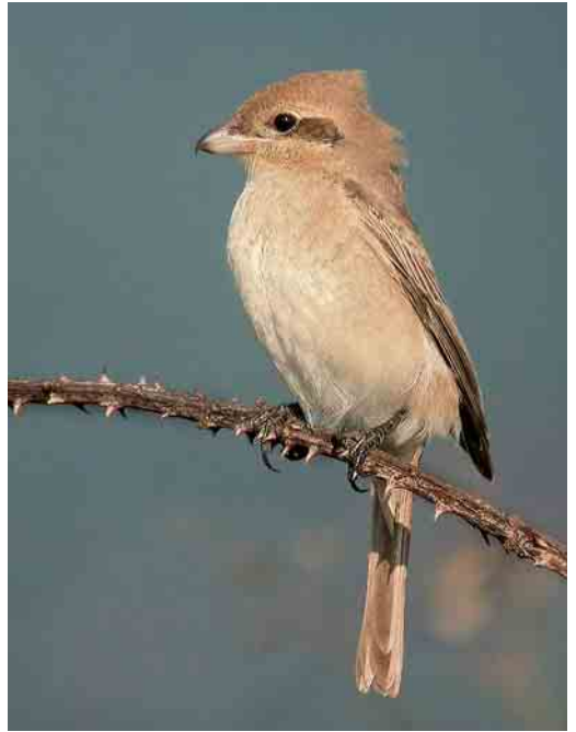
63 Chimney Swift / Schoorsteengierzwaluw Chaetura pelagica , Corvo, Azores, 29 October 2006 (Vincent Legrand) 64 Daurian Shrike / Daurische Klauwier Lanius isabellinus , first-year, Rouxique, Pontevedra, Galicia, Spain, 1 November 2006 (Daniel López Velasco) 65 Black-throated Blue Warbler / Blauwe Zwartkeelzanger Dendroica caerulescens , first-winter female, Corvo, Azores, 24 October 2006 (Vincent Legrand) cf Dutch Birding 28: 389, 2006