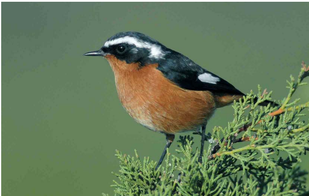
70 Moussier's Redstart / Diademroodstaart Phoenicurus moussieri , male, Cabo de São Vicente, Algarve, Portugal, 15 December 2006

Red-throated Pipit A cervinus wintered at Rogerstown, Dublin, from 24 December to at least 6 January. If accepted, a Rock Pipit A petrosus photographed at Nesebr, Burgas, on 6 November will be the first for Bulgaria. A Common Bulbul Pycnonotus barbatus west of Fuengirola, Málaga, from the second week of January was the third for Spain. A first-winter Grey Catbird Dumetella carolinensis near Kallo, Oost-Vlaanderen, on 15-16 December was the first for Belgium (and c seventh for the WP).