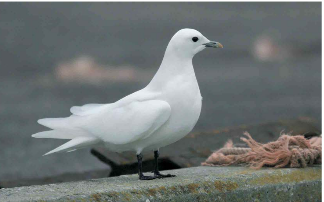
50 Ivory Gull / Ivoormeeuw Pagophila eburnea , adult, Langø Havn, Lolland, Denmark, 30 December 2006 ( Chris van Rijswijk )