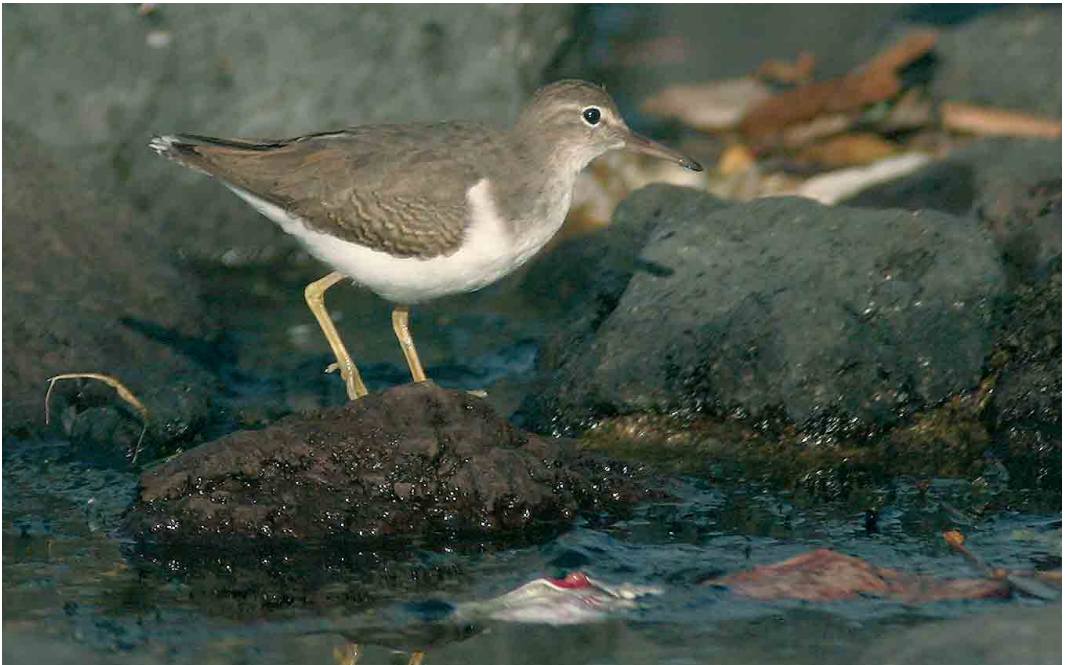
60 Spotted Sandpiper / Amerikaanse Oeverloper Actitis macularius , Madalena, Pico, Azores, 2 November 2006 (Frédéric Jiguet) cf Dutch Birding 28: 389, 2006