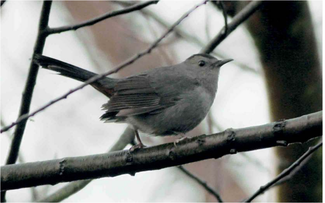
98 Katvogel / Grey Catbird Dumetella carolinensis , Kallo, Oost-Vlaanderen, 16 december 2006 (Vincent Legrand)