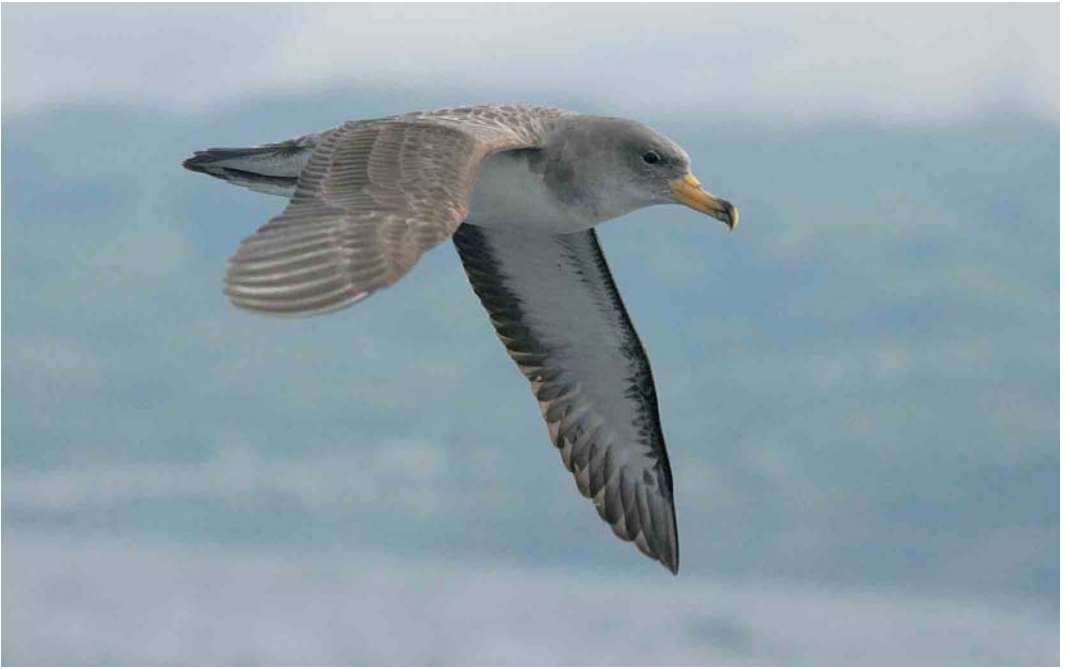
44 Cory's Shearwater / Kuhls Pijlstormvogel Calonectris borealis , São Miguel, Azores, 17 October 2006. Note pale scaling on upperwing and dark markings of under primary coverts.