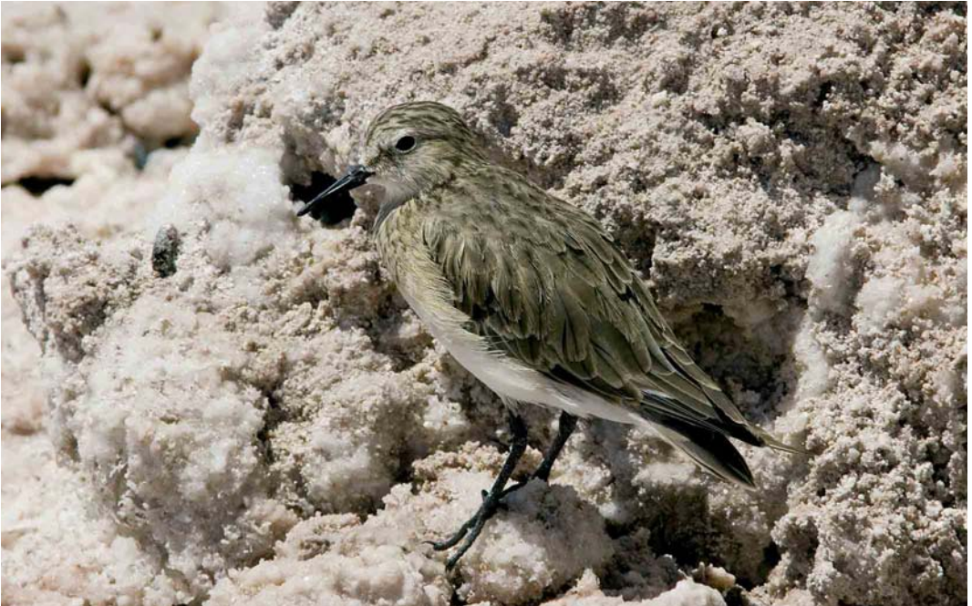
46 Baird's Sandpiper / Bairds Strandloper Calidris bairdii, San Pedro de Atacama, Chile, 25 January 2005