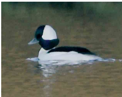
53 Isabelline Wheatear / Izabeltapuit Oenanthe isabellina , El-Abiar, Draa, Morocco, 16 December 2006 54 Franklin's Gull / Franklins Meeuw Larus pipixcan , adult, Jan Mayen, 7 June 2006 55 Greater Sand Plover / Woestijnplevier Charadrius leschenaultii , first-year, Ragusa, Sicily, Italy, 18 December 2006 56 Allen's Gallinule / Afrikaans Purperhoen Porphyryla alleni , El Rocío, Huelva, Spain, 15 January 2006 57 Bufflehead / Buffelkoepeend Bucephala albeola , female, Cabrito reservoir, Terceira, Azores, 19 november 2006 58 Bufflehead / Buffelkoepeend Bucephala albeola , male, Loch of Snarravoe, Unst, Shetland, Scotland, 22 November 2006