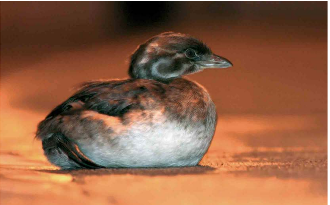
48 Pied-billed Grebe / Dikbekfuut Podilymbus podiceps , first-year, resting on the middle of a road at night, Corvo, Azores, 29 October 2006 cf Dutch Birding 28: 389, 2006