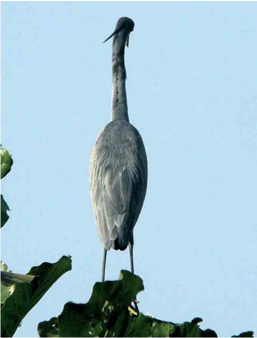
Mystery photograph I (December)