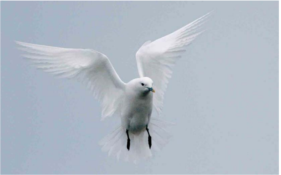
49 Ivory Gull / Ivoormeeuw Pagophila eburnea , adult, Langø Havn, Lolland, Denmark, 29 December 2006