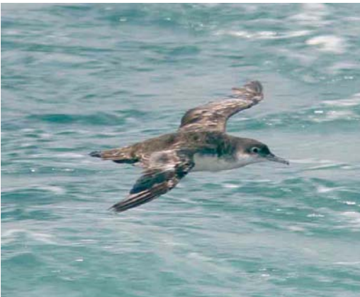
[Dutch Birding 29: 35-40, 2007]

show rather clean underwings and this possibility, therefore, is also worth consideration.