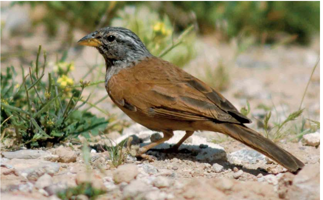
2 House Bunting / Huisgors Emberiza sahari , adult male, Talioulène, Central Anti-Atlas, Morocco, 5 April 2006 (Arnaud B van den Berg)