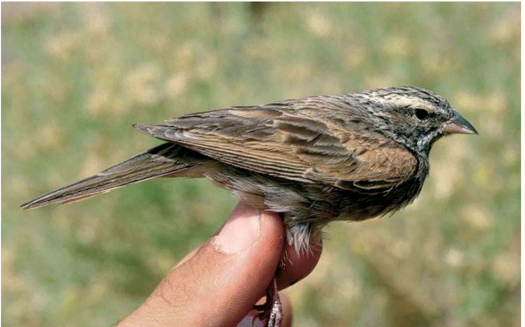
14 Striated Bunting / Gestreepte Gors Emberiza striolata , female, Eilat, Israel, April 1990. Same bird as in plate 16 and 18.