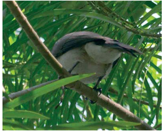
Mystery photograph II (December)

Photographs I and II represent the first round of the 2007 competition. Please, study the rules below care-