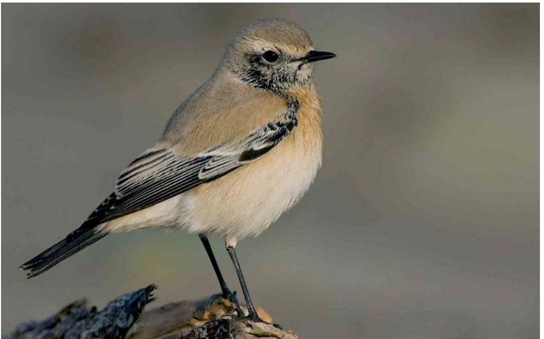
69 Desert Wheatear / Woestijntapuit Oenanthe deserti , Principina a mare, Toscana, Italy, 10 December 2006