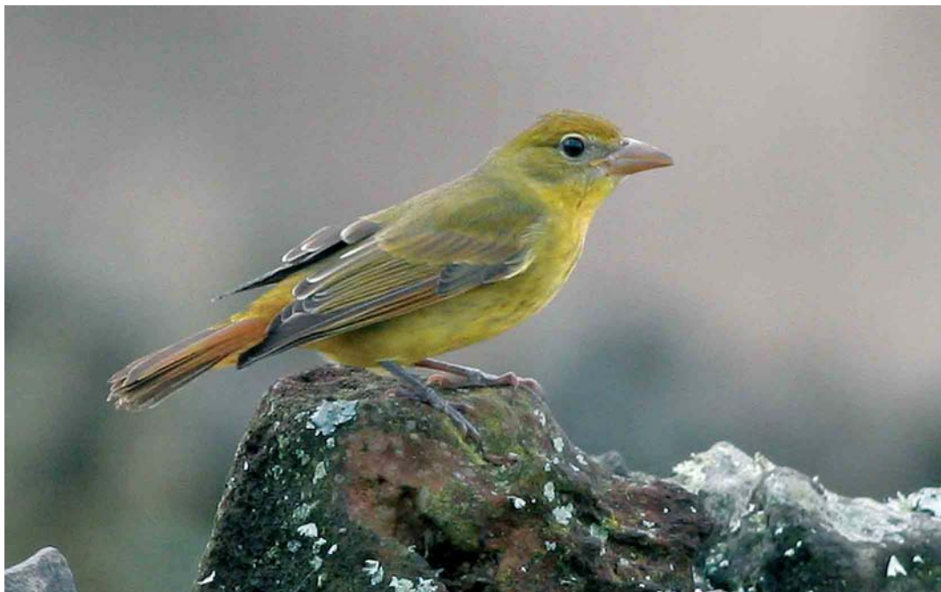
67 Summer Tanager / Zomertangare Piranga rubra , first-year, Corvo, Azores, 28 October 2006 ( Vincent Legrand ) cf Dutch Birding 28: 390, 2006