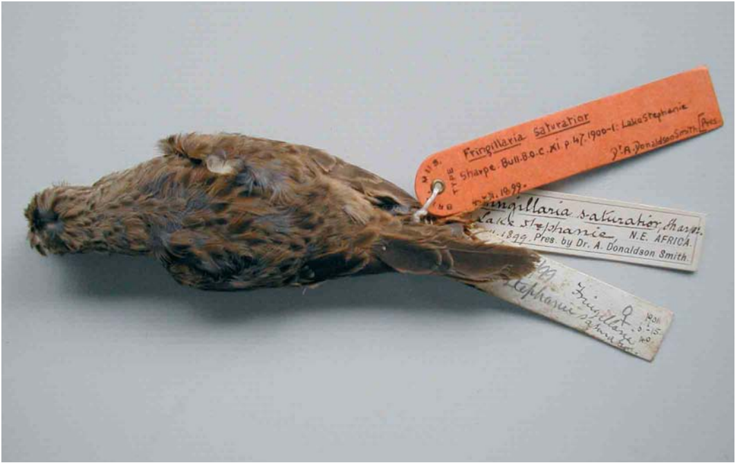
3-4 Female (holotype) of Emberiza striolata saturiator , dorsal and ventral views (collected at lake Stephanie (modern-day lake Chew Bahir), Ethiopia, in December 1899), Natural History Museum, Tring, England, March 2005