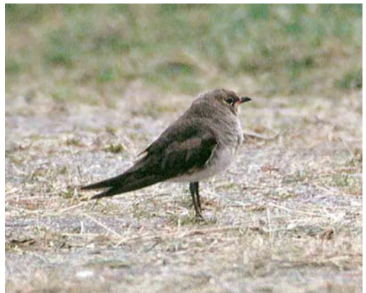
25 Oosterse Vorkstaartplevier / Oriental Pratincole Glareola maldivarum , Doniaburen, Friesland, 2 augustus 1997 26-27 Oosterse Vorkstaartplevier / Oriental Pratincole Glareola maldivarum , Doniaburen, Friesland, 2 augustus 1997 28-29 Oosterse Vorkstaartplevier / Oriental Pratincole Glareola maldivarum , Doniaburen, Friesland, 2 augustus 1997 30 Oosterse Vorkstaartplevier / Oriental Pratincole Glareola maldivarum , Doniaburen, Friesland, 1 augustus 1997