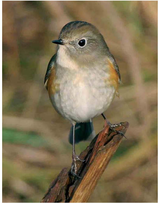
103 Blauwstaart / Red-flanked Bluetail Tarsiger cyanurus , eerste-winter mannetje, Zandvoort, Zuid-Holland, 8 januari 2007

Na een zeer heldere nacht met een volle maan kon hij de volgende dag niet worden teruggevonden door c 60 vogelaars. Ook zaterdag werd gezocht maar zonder resultaat. Verbazingwekkend genoeg werd hij op zondagochtend 7 januari toch weer teruggevonden in het duindoornstruweel door Rogier Karskens en Diederik Kok. Diederik was net terug van een weekje Cyprus en wilde toch nog zijn geluk beproeven. En hoe! Hij werd schitterend gezien en gefotografeerd; ook werd de roep opgenomen en werd er iets van zang geconstateerd. Later op de dag werd hij weer een stuk lastiger maar veel mensen slaagden er in om alsnog (of soms opnieuw) een kortere of langere blik op de vogel te werpen. Op maandag 8 januari zag ik hem zelf weer met een klein clubje vogelaars, vaak bovenin een