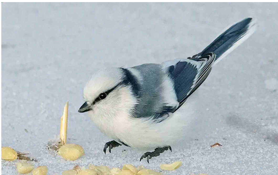
74 Azure Tit / Azuurmees Cyanistes cyanus , Jätäri, Oulu, Finland, 25 December 2006