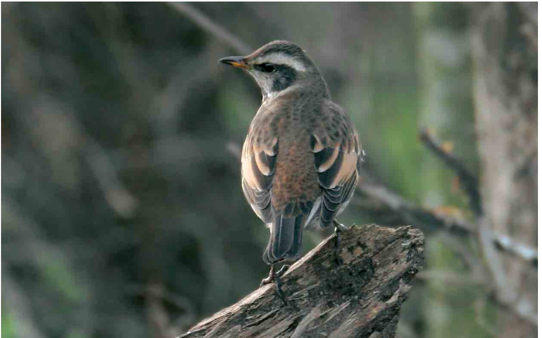
72 Dusky Thrush / Bruine Lijster Turdus eunomus , Pihlava, Pori, Finland, 3 January 2007