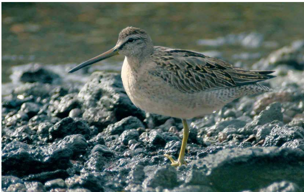
61 Short-billed Dowitcher / Kleine Grijze Snip Limnodromus griseus , first-year, Lajes do Pico, Pico, Azores, 2 November 2006 ( Frédéric Jiguet ) cf Dutch Birding 28: 389, 2006