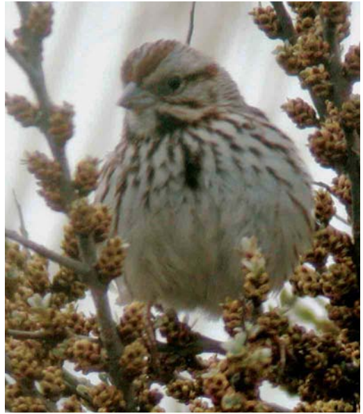
39-40 Zanggors / Song Sparrow Melospiza melodia , Kabbelaarsbank, Zuid-Holland, 30 april 2006

kon hij hem vrij snel determineren als Zanggors Melospiza melodia . Nadat PW enkele bewijsfoto's had gemaakt vloog de Zanggors naar een klein biezenveldje waar hij direct uit beeld verdween. Telefonisch overleg met RvL en andere verantwoordelijken over de mogelijkheid om deze onverwachte nieuwe soort voor Nederland voor een groter publiek toegankelijk te maken leverde helaas geen toestemming op; vanwege de kwetsbaarheid van de plantenbegroeiing in het gebied en het nabijgelegen eilandje met vestigende Kluten Recurvirostra avosetta en Visdieven Sterna hirundo bleek het vrijgeven van de exacte locatie onbespreekbaar. In samenspraak met Klaas Haas, toenmalig beheerder van de Dutch Birding-vogellijn, werd het nieuws om 15:15 wel verspreid maar zonder plek-details en met de vermelding dat de locatie niet vrij toegankelijk was. In de loop van de middag en vroege avond hadden in totaal slechts negen andere vogelaars het geluk om de Zanggors te zien (Enno Ebels, Mark Hoekstein, Danny Laponder, Sander Lilipaly, RvL, Wilfried Mahu, Theo Muisse, Niels de Schipper en Rinse van der Vliet). Hij verbleef tot zeker 19:30 in een klein stuk met biezen, riet en enkele struiken en foerageerde meestal op de grond. De volgende ochtend was hij niet meer aanwezig (cf Wolf & Ebels 2006).