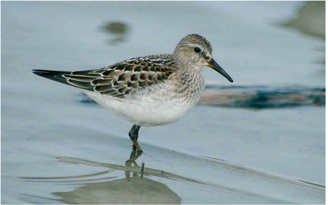
59 White-rumped Sandpiper / Bonapartes Strandloper Calidris fuscicollis , Rheindelta, Vorarlberg, Austria, 15 October 2006