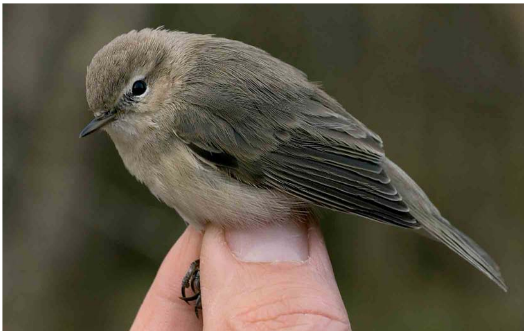
94 Siberische Tjiftjaf / Siberian Chiffchaff Phylloscopus collybita tristis , Groene Glop, Schiermonnikoog, Friesland, 18 november 2006 95 Dwerggors / Little Bunting Emberiza pusilla , Katwijk, Zuid-Holland, 28 december 2006 96 Dwerggors / Little Bunting Emberiza pusilla , Katwijk, Zuid-Holland, 27 december 2006