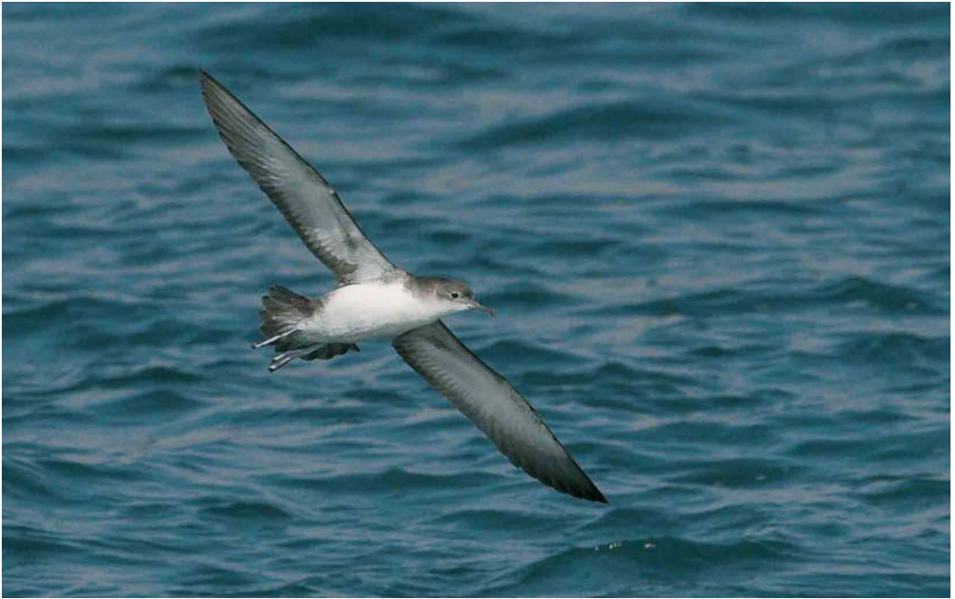
43 Yelkouan Shearwater / Yelkouanpijlstormvogel Puffinus yelkouan , Istanbul, Turkey, 17 September 2006 (Luc Hoogenstein)

streaks on the under primary coverts. The absence of these characters in the mystery bird eliminates Great Shearwater. Another possible candidate is Wedge-tailed Shearwater. This is a rare vagrant to the Western Palearctic from the Indian and southern Pacific Ocean. It occurs in two colour morphs, of which the dark morph is the most abundant. The pale morph has white underwings with a broad blackish trailing edge and a blackish underside of the primaries forming a well-defined black wing-tip. The dark trailing edge of the mystery bird's underwing is rather narrow and the underside of the primaries is not black but more brown-greyish fading gradually towards the centre of the wing. This rules out Wedge-tailed.