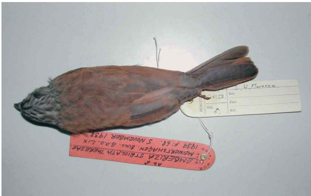
9-10 Male (holotype) of Emberiza sahari theresae , dorsal and ventral views (collected at Andja, south-western Morocco, in November 1938), Natural History Museum, Tring, England, March 2005