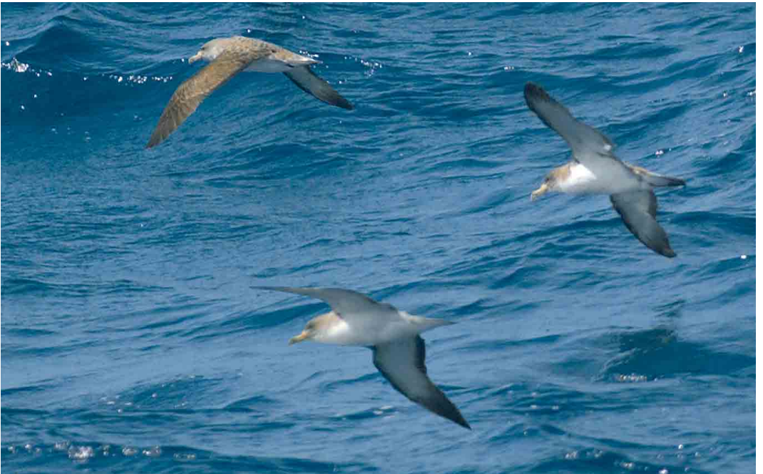
45 Cory's Shearwaters / Kuhls Pijlstormvogels Calonectris borealis , Madeira, 20 October 2006 (René Pop)