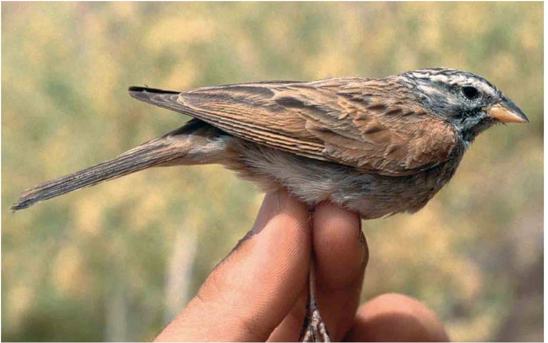
13 Striated Bunting / Gestreepte Gors Emberiza striolata , male, Eilat, Israel, April 1990. Same bird as in plate 15 and 17.