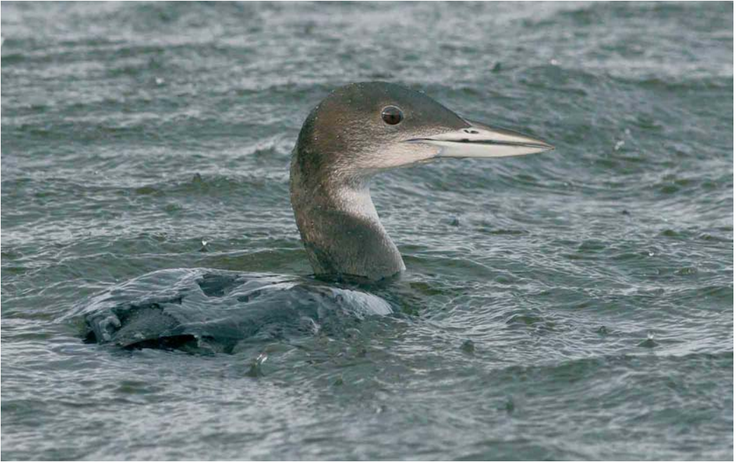
77 Ijsduiker / Great Northern Loon Gavia immer , juveniel, Harderhaven, Flevoland, 16 december 2006