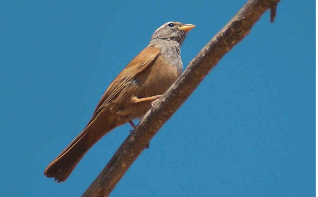
20 House Bunting / Huisgors Emberiza sahari , male, Arram, Gabès, Tunisia, 1 May 2005 (René Pop)