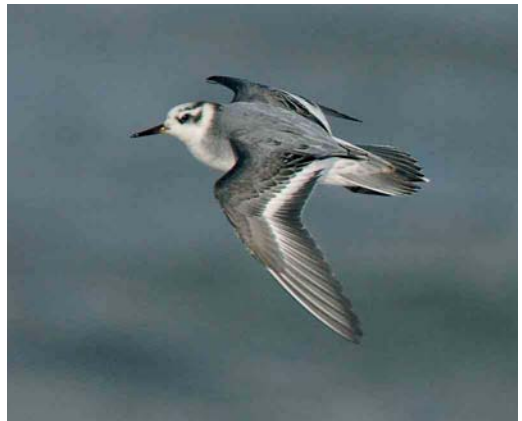
83 Hybride Grote Burgemeester x Zilvermeeuw / hybrid Glaucous x European Herring Gull Larus hyperboreus x argentatus , eerste-winter, IJmuiden, Noord-Holland, 29 december 2006 84 Kleine Alk / Little Auk Alle alle , IJmuiden, Noord-Holland, 4 november 2006 85 Rosse Franjepoot / Red Phalarope Phalaropus fulicarius , Texel, Noord-Holland, 26 november 2006 86 Rosse Franjepoot / Red Phalarope Phalaropus fulicarius , Katwijk aan Zee, Zuid-Holland, 6 november 2006

december zelfs twee, op 12 november langs Westkapelle, op 16 november langs Den Haag, Zuid-Holland, op 19 november langs de Maasvlakte, op 25 november langs Langevelderslag, Zuid-Holland, op 9 december langs Bloemendaal aan Zee, Noord-Holland, en op 13 december langs Camperduin. In de eerste dagen van november vlogen er opmerkelijk veel Kleine Alken Alle alle langs de kust. In totaal ging het in november om een kleine 600. Het hoogste aantal bedroeg 133 op 1 november langs Lauwersoog. Een leuke binnenlandwaarneming was die van zes op 1 november langs de Flevocentrale. Het maximum ter plaatse was 10 op 3 november bij IJmuiden. Langblijvers waren vanaf 2 november tot in januari maximaal vier op de Westkapelsche Kreek, Zeeland, en van 3 tot 25 november één in de Trintelhaven, Flevoland. Opmerkelijke anekdotes betroffen het exemplaar dat op 2 november gered werd van een hongerige snoek