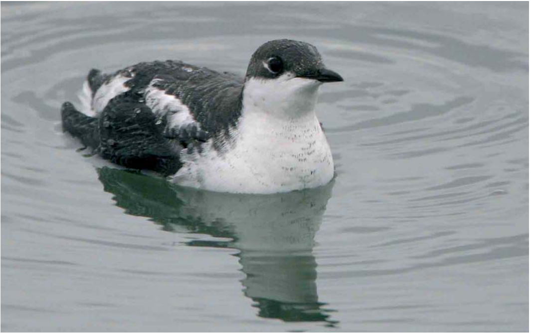
47 Long-billed Murrelet / Aziatische Marmeralk Brachyramphus perdix , Porumbacu de Jos, Transylvania, Romania, 23 December 2006