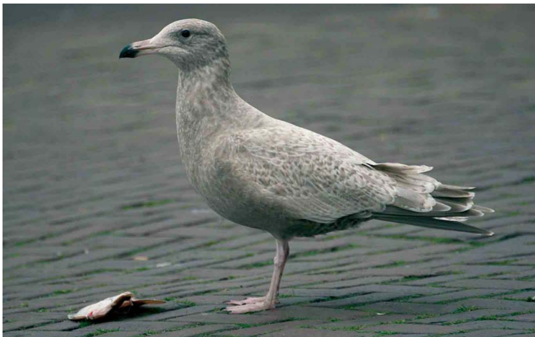
81 Hybride Grote Burgemeester x Zilvermeeuw / hybrid Glaucous x European Herring Gull Larus hyperboreus x argentatus , eerste-winter, IJmuiden, Noord-Holland, 28 december 2006 (Mars Muusse)