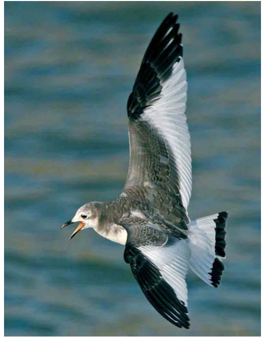
97 Vorkstaartmeeuw / Sabine's Gull Larus sabini , juveniel, Oostende, West-Vlaanderen, 18 november 2006 (Kris De Rouck)

WOUWEN TOT ALKEN Een late Zwarte Wouw Milvus migrans vloog op 16 november over de Dender tussen Pamel, Vlaams-Brabant, en Okegem, Oost-Vlaanderen. In Vlaanderen werden tussen 11 november en 9 december nog op zes plaatsen Rode Wouwen M. milvus waargenomen. In Wallonië waren er in totaal acht waarnemingen waaronder concentraties van zeven bij Ramecroix, Liège, op 8 november en negen boven het stort van Habay-la-Neuve, Luxembourg, op 9 december. Er werden Ruigpootbuiszeters Buteo lagopus gezien in Lommel-Neerpelt op 1 november en 28 december; Wijtschate, West-Vlaanderen, op 2 november; en in Kalmthout, Antwerpen, op 31 december. De laatste Visarenden Pandion haliaetus vlogen over Lommel op 1 november; over Ingooigem, West-Vlaanderen, op 9 november; en over Tessenderlo, Limburg, op 12 november. Op 5 december werd een wel erg late Kwartel Coturnix coturnix opgestoten bij Petegem, Oost-Vlaanderen. Tijdens de eerste decade van november werden in Wallonië enkele 10-tallen Kraanvogels Grus grus opgemerkt. Op 11 november trokken er c 500 over Butchenbach, Liège; 2000 over Robertville, Liège; en 1300 over Rodt, Liège. Op 20 november was er een eerste waarneming in Vlaanderen met zes over Genk-Bokrijk, Limburg. Tussen 27 november en 2 december was er dan de lang verwachte trek golf met