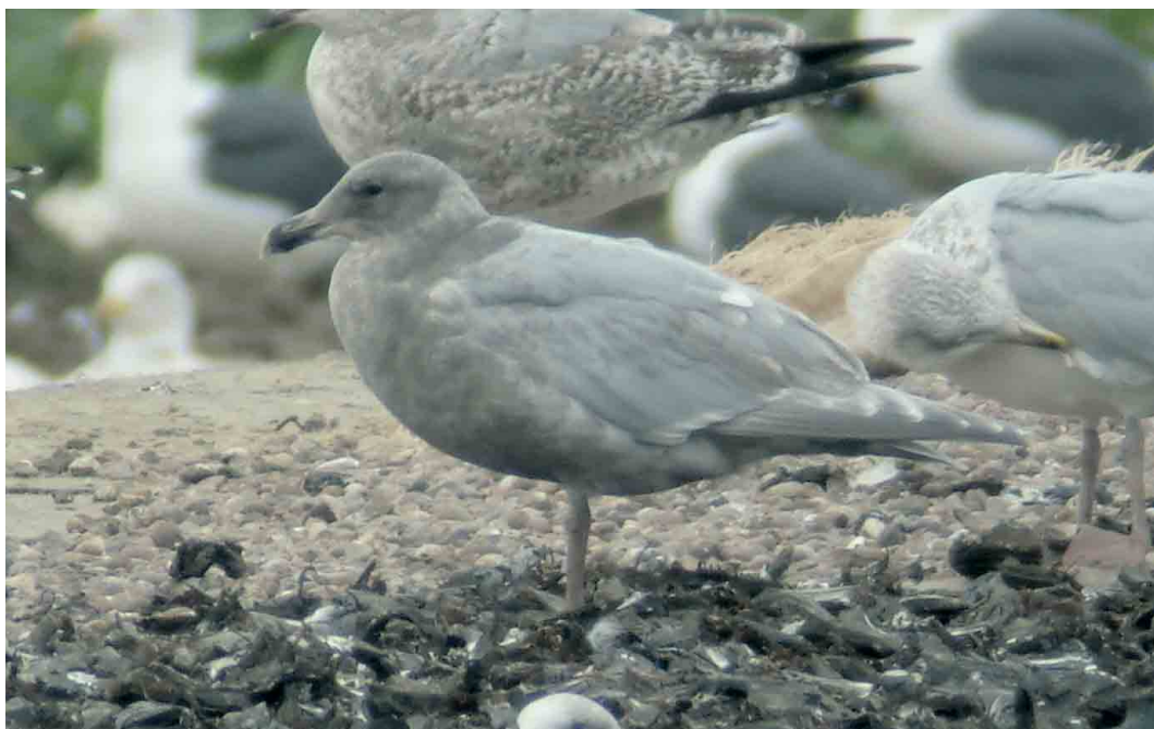
52 Glaucous-winged Gull / Beringmeeuw Larus glaucescens , third-winter, Gloucester, Gloucestershire, England, 15 December 2006