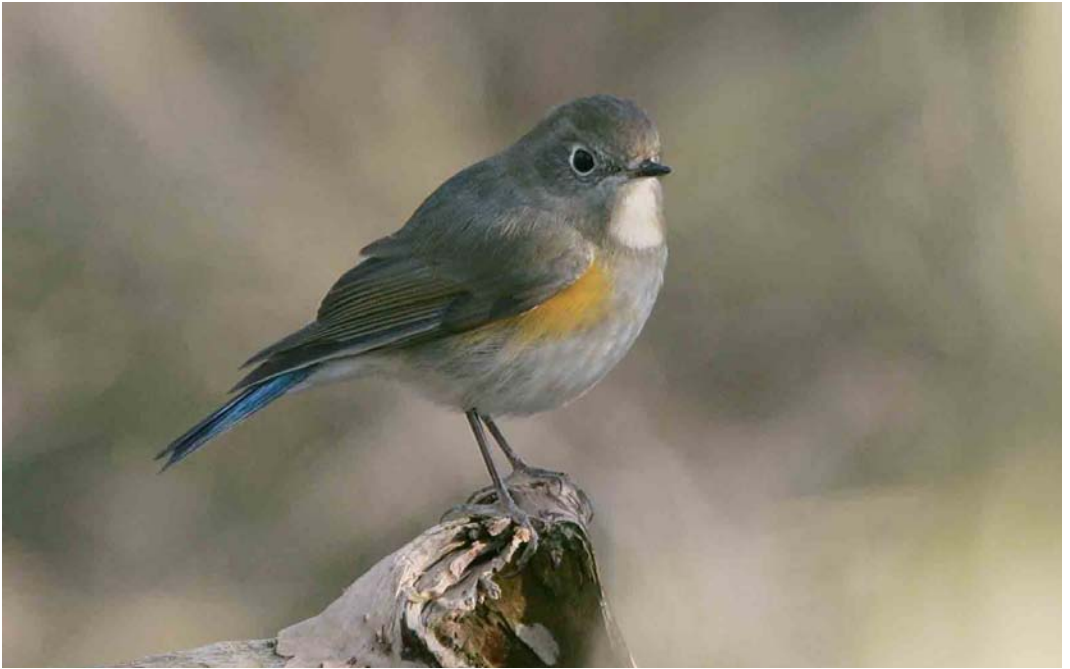
68 Red-flanked Bluetail / Blauwstaart Tarsiger cyanurus , first-winter male, Zandvoort, Zuid-Holland, Netherlands, 14 January 2007 (René van Rossum)