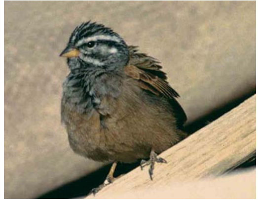
21 House Bunting / Huisgors Emberiza sahari , male, Boumalne Dadès, Dadès-Draa, Morocco, 1 April 2006 ( Arnoud B van den Berg ) 22 House Bunting / Huisgors Emberiza sahari , male, Tamri, Haha, Morocco, 1 October 2006 ( Arnoud B van den Berg ) 23 Striated Bunting / Gestreepte Gors Emberiza striolata , adult male, Eilat, Israel, January 1990 ( Hadoram Shirihai ) 24 Striated Bunting / Gestreepte Gors Emberiza striolata , adult male, Eilat, Israel, January 1990 ( Hadoram Shirihai )

purported 'hybrid' specimens are, in fact, perfectly diagnosable as members of the striolata group. Even if some of these intergrades (unexamined by us) really can be considered such, their localized occurrence and relatively stable characters might be treated as equally strong evidence of secondary contact between two species that have already diverged (cf Wiley 1981).