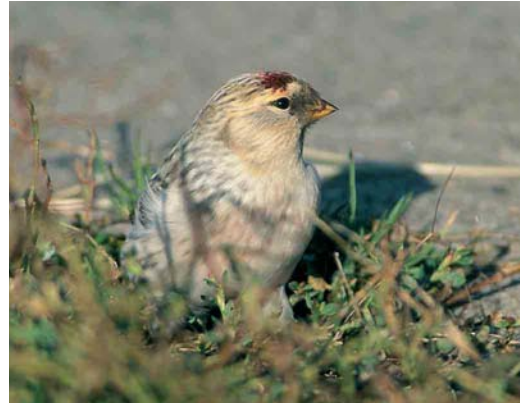
34-37 Groenlandse Witstuitbarmsijs / Hornemann's Redpoll Carduelis hornemanni hornemanni , Huisduinen, Noord-Holland, 15 oktober 2003 Let op witte totaalindruk, topzwaar postuur, dikke snavel met iets gebold culmen, klein rood petje, opvallend contrast tussen lichtbruine oorstreek en witachtige zijhals en mantel, gelijkmatig koudgrijs gestreepte witte bovendelen, beperkte hoeveelheid roze zweem op borst, en afhanginge dijveren als grote vierkante witte broek / note white overall impression, top-heavy jizz, thick bill with slightly rounded culmen, small red cap, clear contrast between pale brown ear-coverts and whitish neck-side and mantle, uniform frosty-grey streaking on white upperparts, limited amount of pink wash on breast, and hanging thigh-feathers forming white 'trousers'

video- en geluidsopnames kon worden vastgesteld dat de vogel alle structurele en morfologische kenmerken van een adult mannetje hornemanni bezat. MR kwam aan de hand van sonogrammen op vier consistente verschillen tussen enerzijds de drie opnamen van de roep en anderzijds 172 opnamen van vergelijkbare roepen van 10-tallen zeer lichte tot donkere IJslandse barm-sijsen, die wat geluid betreft meer lijken op exilipes . Zijn conclusie was dat geen van zijn IJslandse opnamen in de buurt kwam van de in Huisduinen opgenomen roep; hetzelfde geldt voor opnamen van exilipes in de collectie van The Sound Approach. Een lage roep viel ook Pennington & Maher (2005) op bij hornemanni in Schotland, hoewel ze niet duidelijk maken om welke roep dit gaat.