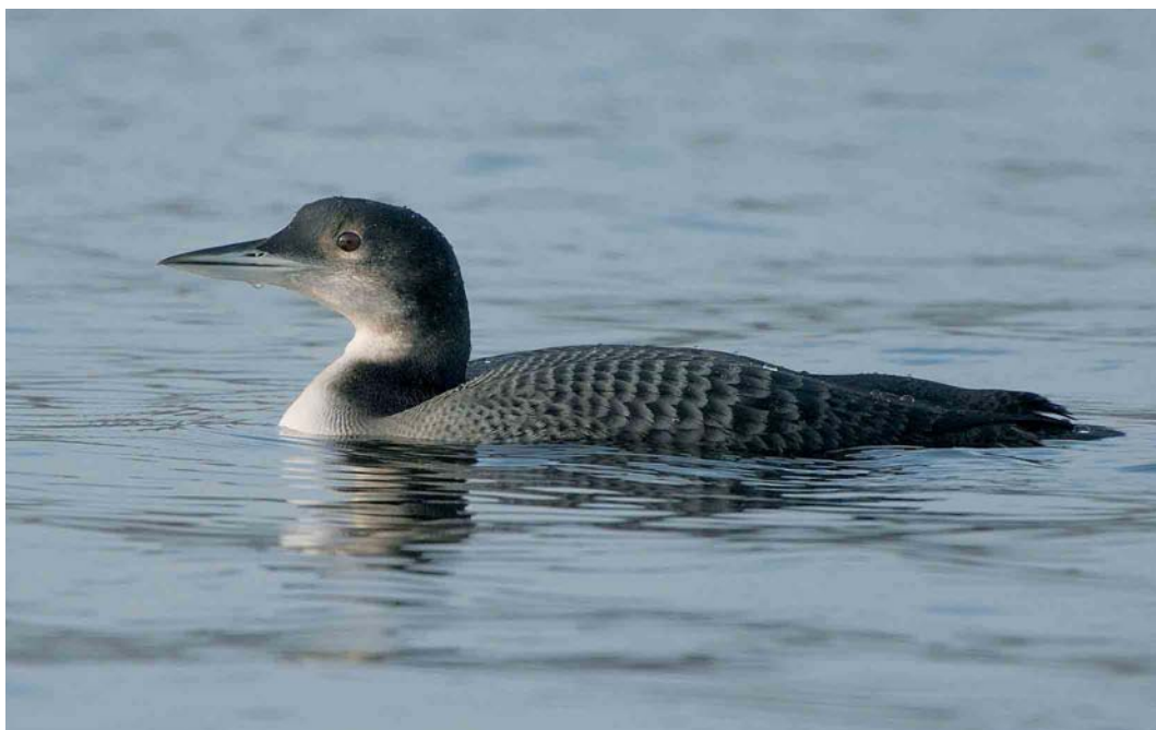
80 Ijsduiker / Great Northern Loon Gavia immer , juveniel, Harderhaven, Flevoland, 30 november 2006