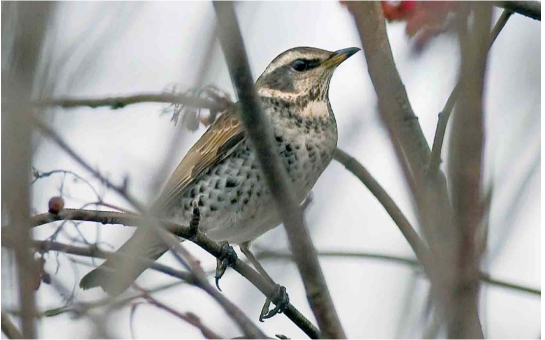
71 Dusky Thrush / Bruine Lijster Turdus eunomus , Pihlava, Pori, Finland, 6 January 2007