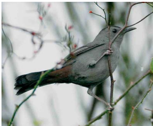
100 Katvogel / Grey Catbird Dumetella carolinensis , Kallo, Oost-Vlaanderen, 16 december 2006 (Patrick Beirens)

At present, Bugun Liocichla is only known from the type locality. Although this site has been visited frequently by ornithologists and birdwatchers, it is amazing that this liocichla with its colourful plumage and distinctive vocalizations remained unknown for so long. This may well indicate that the population, even at Eaglenest Wildlife Sanctuary, is very small. ANDRÉ J VAN LOON