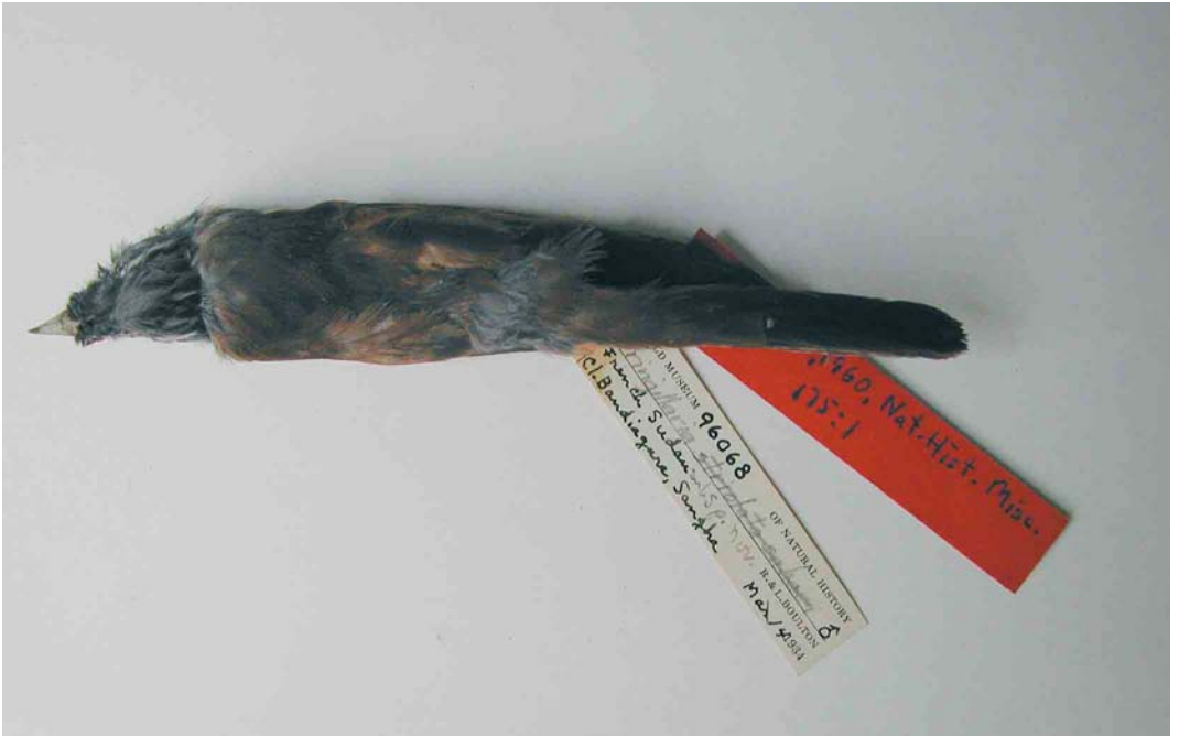
7-8 Male (holotype) of Emberiza sahari sanghae , dorsal and ventral views (collected at Bandiagara, southern Mali, in March 1934), Field Museum of Natural History, Chicago, USA, August 2006