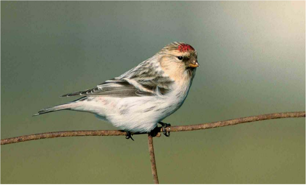
32-33 Groenlandse Witsluitbarmsijs / Hornemann's Redpoll Carduelis hornemanni hornemanni , Huisduinen, Noord-Holland, 15 oktober 2003. Let op witte totaalindruk, gelijkmatig koudgrijs gestreepte witte bovendelen, zeer geringe hoeveelheid roze op stuit, geringe streping op flank, staartpenen met afgeronde toppen en scherp begrensde witte randen, en snavel met iets gebold culmen / note white overall impression, uniform frosty-grey streaking on white upperparts, very small amount of pink on rump, small amount of streaking on flank, tail-feathers with rounded tips and sharply demarcated white edges, and thick bill with slightly rounded culmen