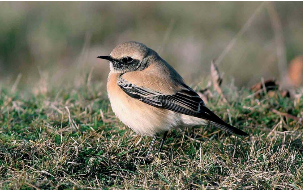
99 Woestijntapuit / Desert Wheatear Oenanthe deserti , mannetje, Het Zwin, West-Vlaanderen, 9 december 2006