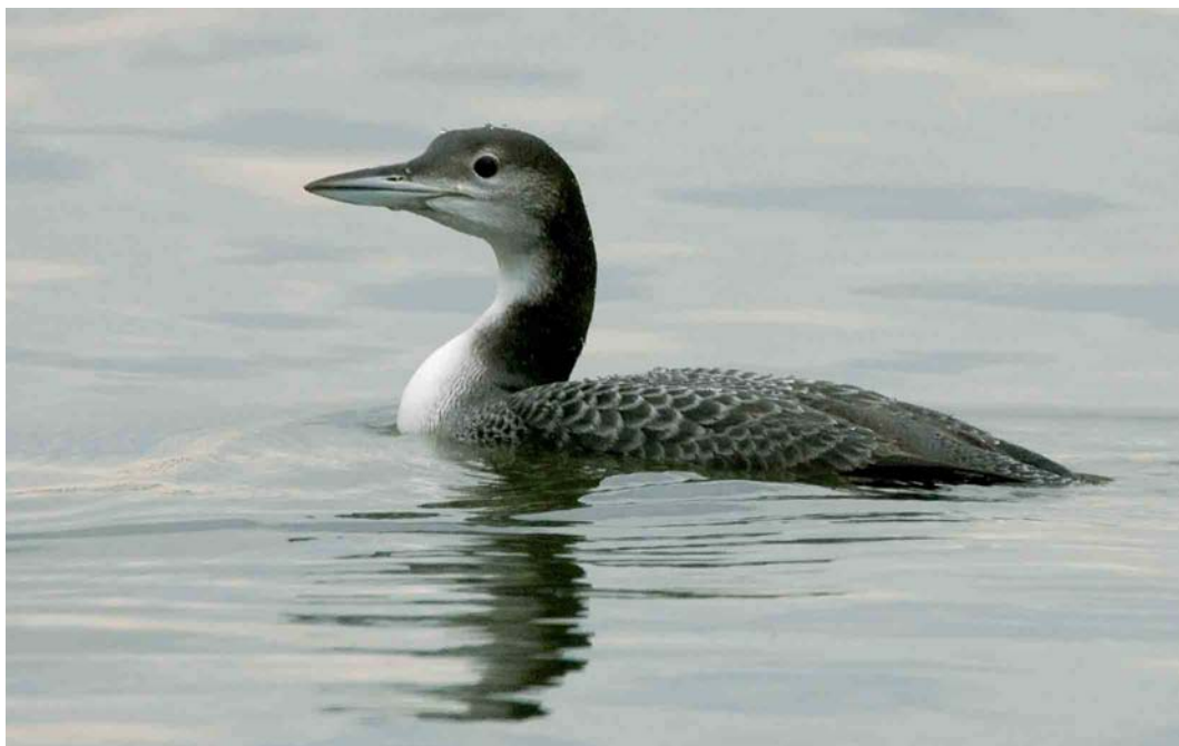
79 Ijsduiker / Great Northern Loon Gavia immer , juveniel, Asselt, Limburg, 27 november 2006