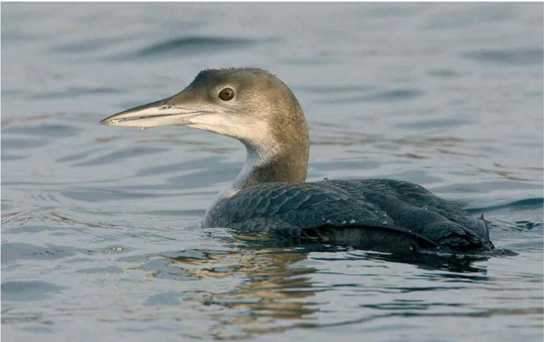
78 Ijsduiker / Great Northern Loon Gavia immer , juveniel, Westkapelle, Zeeland, 29 december 2006