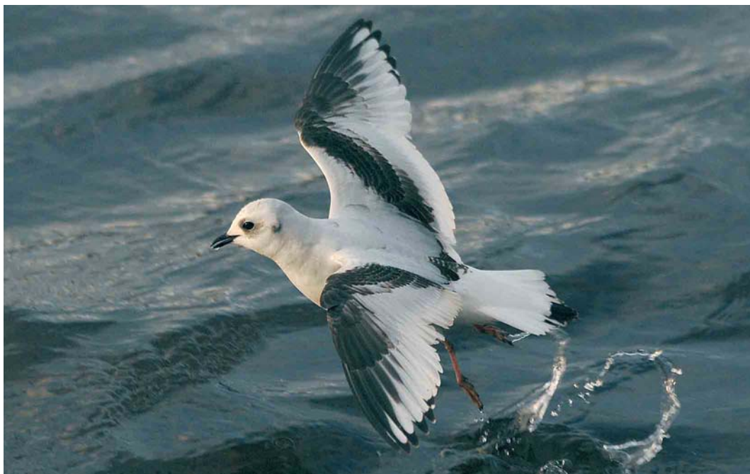
51 Ross's Gull / Ross' Meeuw Rhodostethia rosea , first-winter, Loch Caolisport, Argyll, Scotland, 30 December 2006