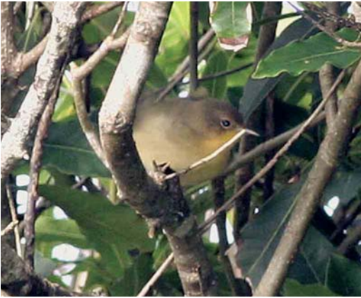
75 Common Yellowthroat / Gewone Maskerzanger Geothlypis trichas , Corvo, Azores, 29 October 2006 (Vincent Legrand)