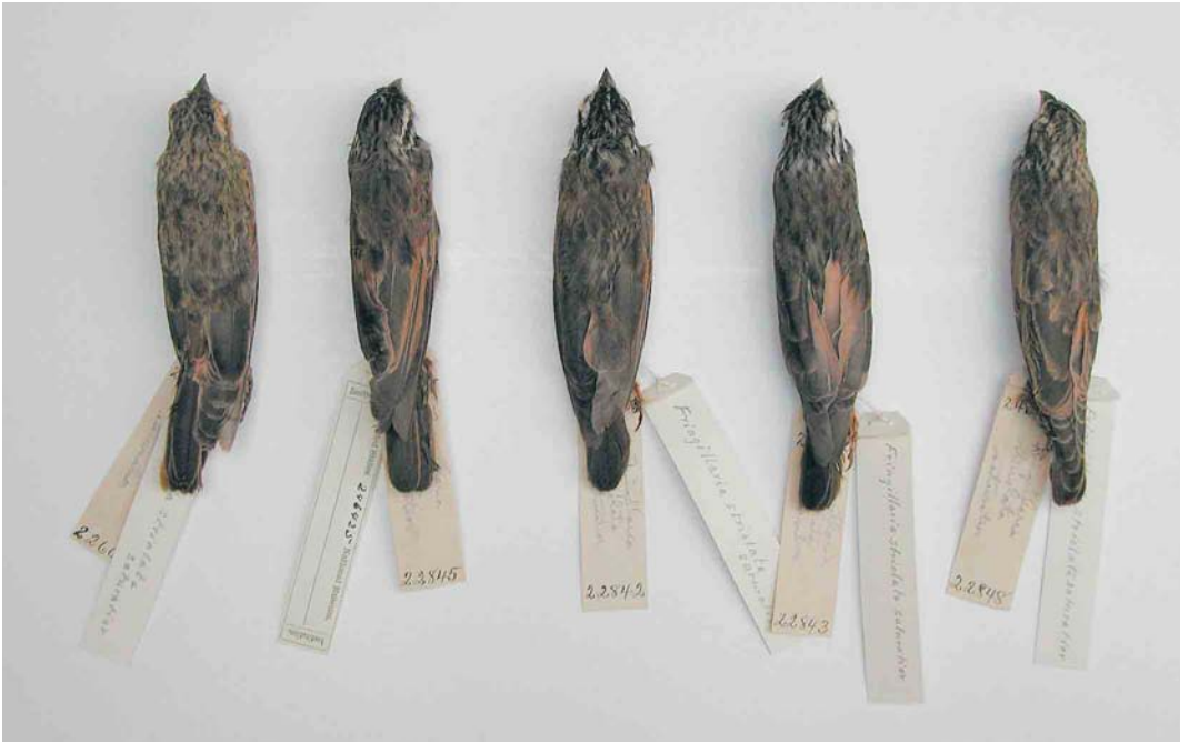
11-12 Range of variation in upper- and underparts of males of Emberiza striolata saturiator , dorsal and ventral views (collected by the Childs Frick expedition of 1911-12, principally in modern-day Ethiopia), National Museum of Natural History, Washington DC, USA, August 2006