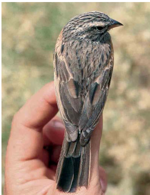
16 Striated Bunting / Gestreepte Gors Emberiza striolata , female, Eilat, Israel, April 1990 ( Hadoram Shirihai ). Same bird as in plate 14 and 18.