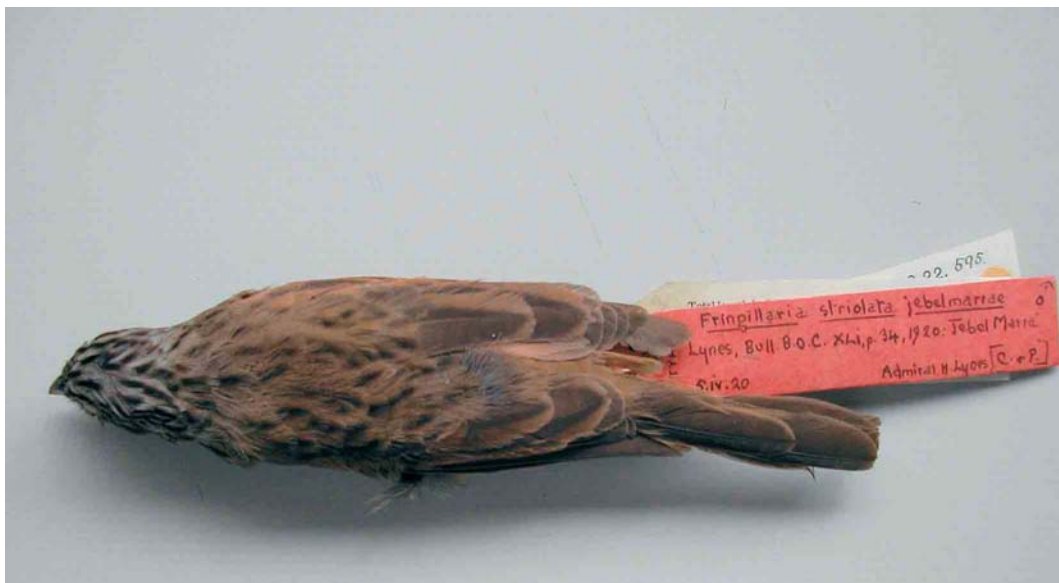
5-6 Male (holotype) of Emberiza striolata jebelmarrae , dorsal and ventral views (collected at Jebel Marra, Darfur, Sudan, in April 1920), Natural History Museum, Tring, England, March 2005