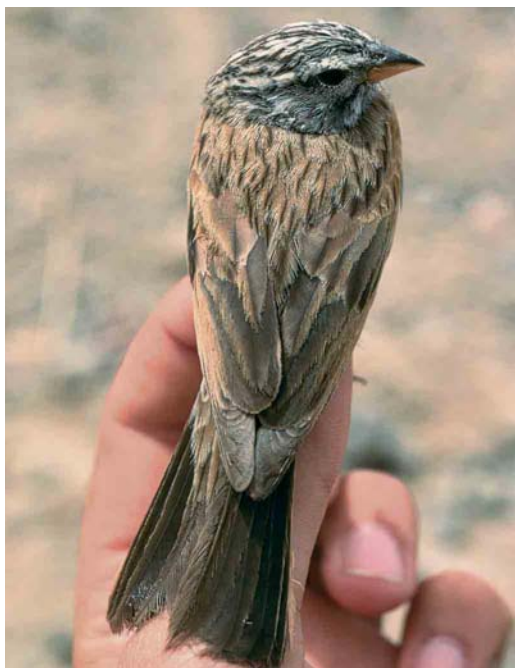
15 Striated Bunting / Gestreepte Gors Emberiza striolata , male, Eilat, Israel, April 1990. Same bird as in plate 13 and 17.