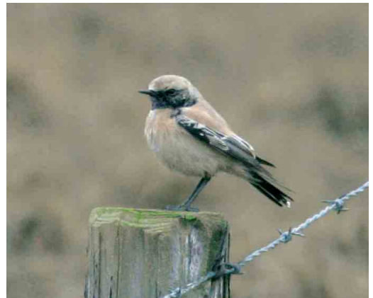
87 Bruine Boszanger / Dusky Warbler Phylloscopus fuscatus , Castricum, Noord-Holland, 26 november 2006 ( Jan Visser ) 88 Siberische Tjiftjaf / Siberian Chiffchaff Phylloscopus collybita tristis , Huizen, Noord-Holland, 6 december 2006 ( Edwin Winkel ) 89-90 Woestijntapuit / Desert Wheatear Oenanthe deserti , mannetje, De Cocksdorp, Texel, Noord-Holland, 28 december 2006 ( Gertjan van Veldhuisen )

zwaluw Delichon urbicum op 10 december in het Verdronken land van Saeftinge, Zeeland. Maar het bleef niet bij deze drie soorten want op 5 november werden twee Rotszwaluwen Ptyonoprogne rupestris gezien bij IJburg, Noord-Holland. Indien aanvaard zouden dit wel eens de eerste twee voor Nederland kunnen zijn. Hierna werden er nog eens twee gezien op 7 november bij Westenschouwen, Zeeland, en van 14 tot 24 november waren er maximaal twee aanwezig in Hoorn, Noord-Holland, die na een wat moeizame aanloop uiteindelijk door veel vogelaars werden bekeken. Tot slot trok op 29 november nog een bijzonder late Roodstuitzwaluw Cecropis daurica over Kamperhoek, Flevoland. De doortrek van Grote Piepers Anthus richardi leverde tot 28 november nog 11 exemplaren op. Met c 60 vanaf 2 november waren Pestvogels Bombycilla garrulus aan de schaarse kant. Een Waterspreeuw Cinclus cinclus was op 9 december aanwezig langs de Hierdensche Beek, Gelderland. Een