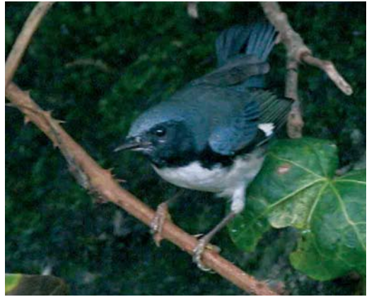
76 Black-throated Blue Warbler / Blauwe Zwartkeelzanger Dendroica caerulescens , first-winter male, Corvo, Azores, 28 October 2006 cf Dutch Birding 28: 389, 2006

on 12-30 December. The first for Switzerland turned up at Kreuzlingen, Thurgau, on 4 January.