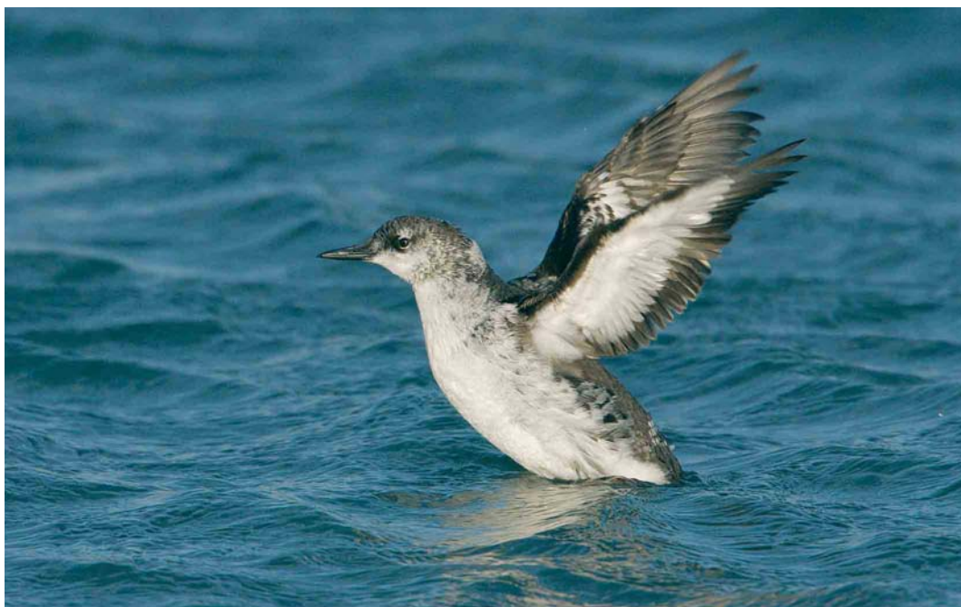
82 Zwarte Zeekoet / Black Guillemot Cephus grylle , eerste-winter, West-Terschelling, Terschelling, Friesland, 26 november 2006 (Arie Ouwerkerk)