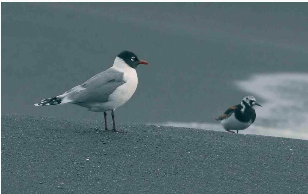
62 Franklin's Gull / Franklins Meeuw Larus pipixcan , adult, with Ruddy Turnstone / Steenloper Arenaria interpres , Jan Mayen, 7 June 2006 ( Peter Zwitter )