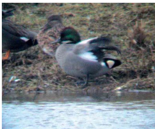
189 Falcated Duck / Bronskopeend Anas falcata , male, Nuldernauw, Gelderland, Netherlands, 27 March 2005 190 Falcated Duck / Bronskopeend Anas falcata , male, Nuldernauw, Gelderland, Netherlands, 1 April 2005 191-192 Falcated Duck / Bronskopeend Anas falcata , male, Asselt, Limburg, Netherlands, 10 February 2002

winter, due to short elongated tertials, which grew longer and more curved during its stay (Rommert Cazemier in litt); however, first-year birds appear to retain shorter and straighter tertials into their first summer, so this bird was probably also an adult. So far, females of possibly wild origin have not been reported in the Netherlands.