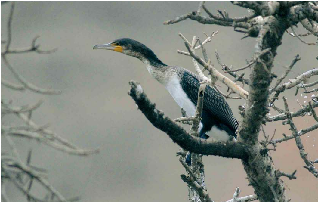
214 White-breasted Cormorant / Afrikaanse Aalscholver Phalacrocorax carbo lucidus , Barragem de Poilão, Santiago, Cape Verde Islands, 27 March 2007 (René Pop)