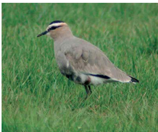
248 Koereiger / Cattle Egret Bubulcus ibis , Frieschepalen, Friesland, 9 maart 2007 (Jos Welbedacht) 249 Steppiekiekendief / Pallid Harrier Circus macrourus , onvolwassen mannetje, Strabrechtse Heide, Noord-Brabant, 25 april 2007 (Robert Castelijin) 250 Franklins Meeuw / Franklin's Gull Larus pipixcan , tweede-zomer (links), met Kokmeeuw / Black-headed Gull L. ridibundus , Sophiapolder, Oostburg, Zeeland, 27 april 2007 (Paul M Gnodde) 251 Steppekievit / Sociable Lapwing Vanellus gregarius , eerstejaars, Wekerom, Gelderland, 25 maart 2007 (Chris Janse)

gregarius in Syrië en Turkije, dit voorjaar de soort ook weer in Nederland werd aangetroffen, met waarnemingen van 16 tot 20 maart bij Veenendaal, Utrecht, en (dezelfde) op 25 maart ten oosten van Barneveld, Gelderland (eerste-zomer), op 18 april bij Velp, Gelderland, en op 27 april ten oosten van Vorden, Gelderland (adult). Gestreepte Strandlopers Calidris melanotos kwamen vroeg en wel op 7 april bij Alphen aan den Rijn, Zuid-Holland; van 14 tot 20 april op Texel; op 15 en 29 april op de Starrevaart; en op 21 april in de Rammelwaard, Gelderland. Een grijze snip Limnodromus vloog op 22 april over Breskens. De beste plek voor Poelruiters Tringa stagnatilis was De Hamert, Limburg, waar al op 9 april één werd ontdekt die lange tijd aanwezig bleef. Op 24 april waren er hier twee, op 25 april zelfs drie en op 26 april weer twee. Van 17 tot 21 april pleisterde er één langs de Philipsdam, Zeeland, en vanaf 28 april werden er her en der in het