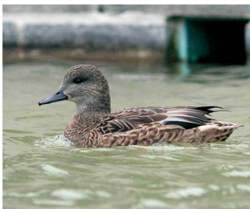
193-194 Falcated Duck / Bronskopeend Anas falcata , first-winter male, with Eurasian Wigeons / Smienten A penelope , Exminster Marshes, Devon, England, November 2006 ( Rob Laughton ) 195-196 Falcated Duck / Bronskopeend Anas falcata , female, Zürich-Honggerberg, Zürich, Switzerland, 10 February 2007 ( Jan Bisschop )

A possible hybrid (or aberrant) Falcated Duck was seen at Nuldernauw, Gelderland, on 6 May 2007 (at the same site where a 'good' male was present in March-May 2005). According to the two observers, the bird showed too much yellow on the lower head and a slighter rounder head than in pure Falcated Duck ( www.dutchbirding.nl ).