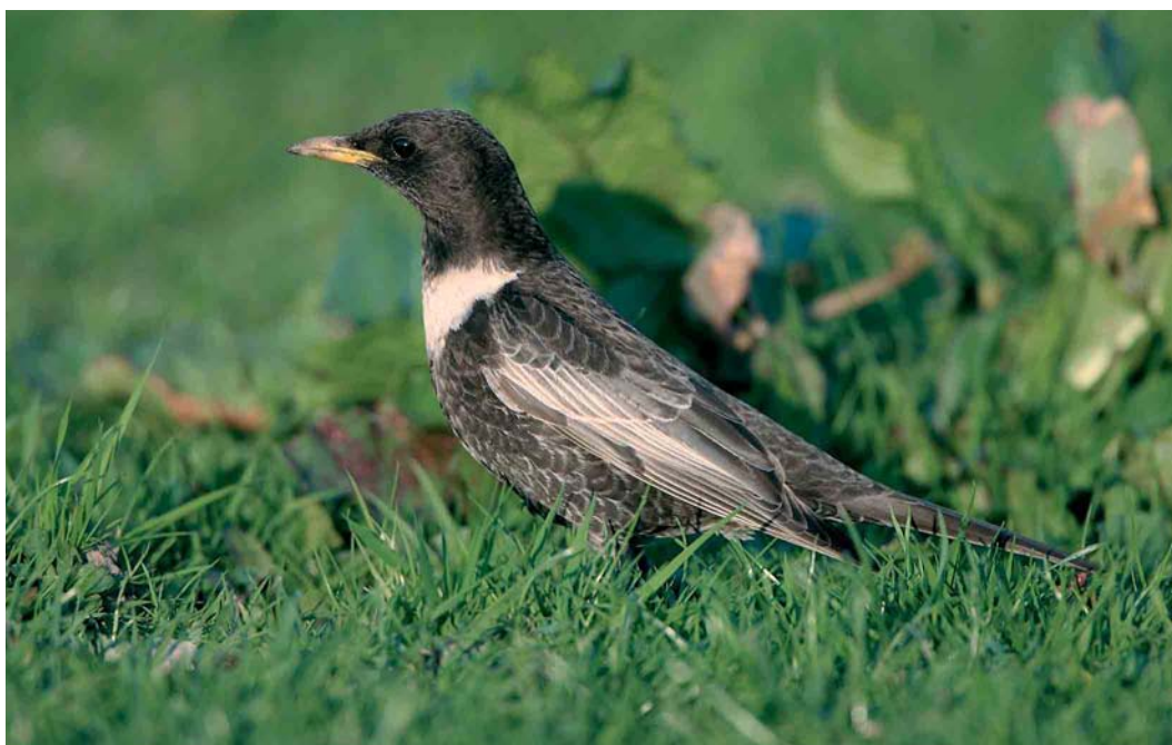
260 Beflijster / Ring Ouzel Turdus torquatus , mannetje, Hensbroek, Noord-Holland, 15 april 2007