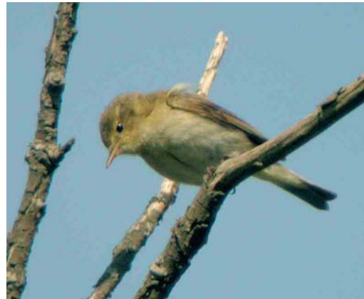
252 Cetti's Zanger / Cetti's Warbler Cettia cetti , Brabantse Biesbosch, Noord-Brabant, 11 april 2007 253 Pallas' Boszanger / Pallas's Leaf Warbler Phylloscopus proregulus , Coendersborg, Groningen, Groningen, 14 april 2007 254 Pallas' Boszanger / Pallas's Leaf Warbler Phylloscopus proregulus , Amersfoort, Utrecht, 4 maart 2007 255 Iberische Tjiftjaf / Iberian Chiffchaff Phylloscopus ibericus , Diemerzeedijk, Noord-Holland, 22 april 2007

nikoog, Friesland. Waarnemingen van grote aantallen Zwartkopmeeuwen L. melanocephalus buiten de Delta zijn uitzonderlijk, dus het vermelden waard zijn de grote aantallen op de Kinseldam nabij Durgerdam, Noord-Holland, met een maximum van 188 op 25 april. Grote Burgemeesters L. hyperboreus bleven tot 24 maart op de Maasvlakte; tot 17 april bij Katwijk aan Zee, Zuid-Holland; tot 27 april (de adulte) bij Den Helder; op 13 maart langs de Oosterscheldekering; op 24 maart langs Huisduinen, Noord-Holland; op 25 maart (twee) langs De Cocksdorp, Texel, Noord-Holland; van 27 maart tot 14 april bij de Brouwersdam, Zuid-Holland; en van 31 maart tot 6 april bij Heerlen, Limburg. De eerste-winter hybride Grote Burgemeester x Zilvermeeuw L. argentatus van IJmuiden werd tot 15 april gezien. Een eerste-winter Kleine Burgemeester L. glaucoides vloog op 9 april langs Breskens en op 28 april werd een tweede-kalenderjaar