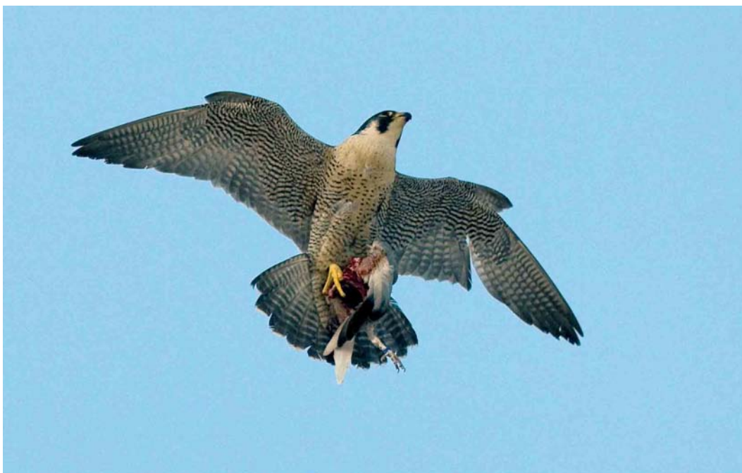
256 Slechtvalk / Peregrine Falcon Falco peregrinus, vrouwtje (broedde in 1999-2005 in Nijmegen, Gelderland), Deventer, Overijssel, 2 mei 2007 257 Steppekiekendief / Pallid Harrier Circus macrourus, onvolwassen mannetje, Strabrechtse Heide, Noord-Brabant, 26 april 2007 258 Grote Aalscholver / Atlantic Great Cormorant Phalacrocorax carbo carbo, Engelermeer, Noord-Brabant, 23 maart 2007