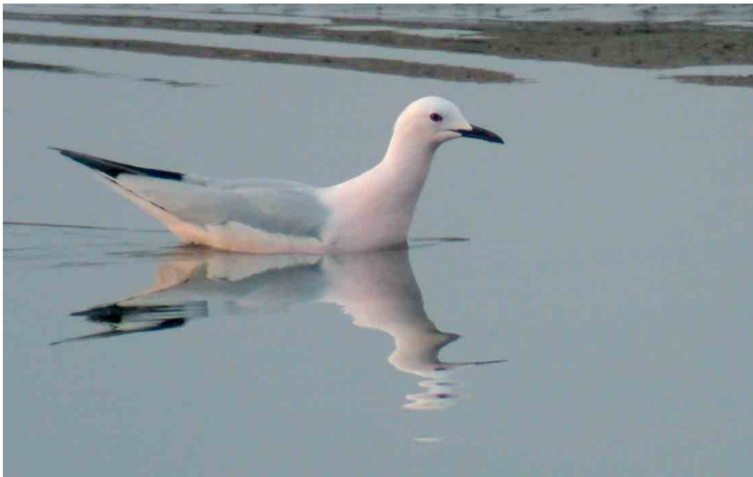
243 Dunbekmeeuw / Slender-billed Gull Larus genei , adult, Het Zwin, Zeeland, 13 april 2007

A fabalis bij Lisse, Zuid-Holland, in een grote groep Toendrarietganzen A serrirostris betrof één van de zeer schaarse meldingen in het westen van het land in de afgelopen winters. Dwergganzen A erythropus waren nog aanwezig in de polders ten noorden van Camperduin, Noord-Holland, tot 26 maart met een maximum van 37 op 2 maart, op 7 maart 18 in het Oudeland van Strijen, Zuid-Holland, op 8 maart 14 op de Korendijksche Slikken, Zuid-Holland, en tot 2 april weer bij Anjum, Friesland, met een maximum van 13 op 8 maart. Verder werden er nog 13 gemeld op andere locaties, met de laatste op 9 april bij de Workumerwaard. Er werden 26 Roodhalsganzen Branta ruficollis opgemerkt met als beste plekken de Bantpolder, Friesland, met vier op 15 en 29 april en Ameland, Friesland, met drie op 22 april. Van de 14 Witbuikrotganzen B hrota verbleven er drie op Wieringen, Noord-Holland, en vier op Texel, Noord-Holland. Voor Zwarte Rotgans B nigricans , waarvan er 15 gemeld werden, was Texel eveneens de beste plek met drie. Op 16 april vloog er één langs Camperduin, een nieuwe telpostsoort. Witoogeenden Aythya nyroca zwommen tot 2 maart op de Keersluisplas, Flevoland, op 8 maart bij 's-Hertogenbosch, Noord-Brabant, op 1 april twee en 9 april één in de Kil van Hurwenen,