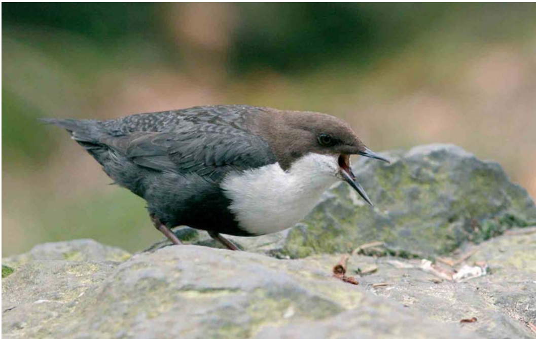
259 Zwartbuikwaterspreeuw / Black-bellied Dipper Cinclus cinclus cinclus , Beekhuizen, Gelderland, 11 april 2007 (Michel Veldt)