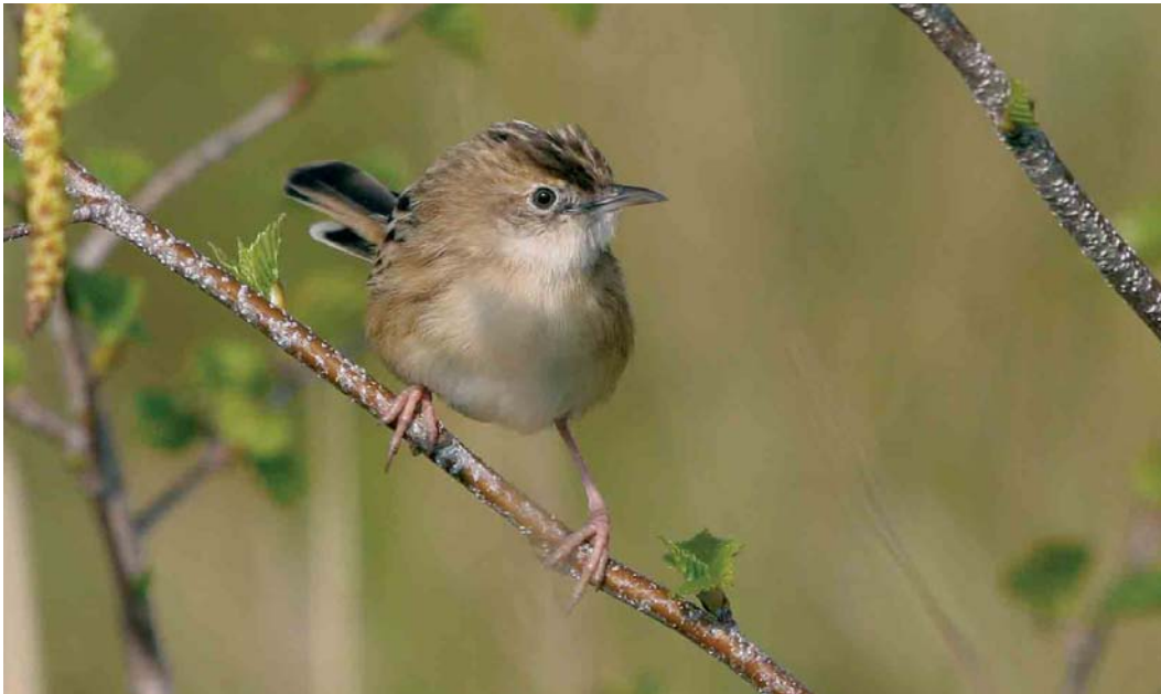
265 Graszanger / Zitting Cisticola juncidis , Oostende, West-Vlaanderen, 2 april 2007 (Johan Buckens)

RALLEN TOT STERNS Vanaf 24 april riep een mannetje Klein Waterhoen Porzana parva in De Blankaart in Woumen maar de vogel werd slechts sporadisch gehoord. We ontvingen waarnemingen van meer dan 14 000 Kraanvogels Grus grus , waarvan alleen al op 4 maart 8462 over de Hoge Venen, Liège. De trekpieken lagen gespreid over de hele periode. Bij Ragnies, Hainaut, werd op 29 april een Griël Burhinus oedipnes gezien. Na 5 april verschenen Steltkluten Himantopus himantopus in Adinkerke, West-Vlaanderen; Doel; Kalmthout; Stuivekenskerke; in de Uitkerkse Polders, West-Vlaanderen (drie); in Warneton, Hainaut; en in Zeebrugge (twee). Op 30 april pleisterde de eerste Morinelplevier Charadrius morinellus voor dit voorjaar in Clermont, Liège, en op 30 april trok er één over de Kalmthoutse Heide. Een Poelsnip Gallinago media werd op 13 april gemeld bij Tournai, Hainaut. Op 29 april verschenen twee Poelruiters Tringa stagnatilis langs de Maas bij Elen, Limburg, en één in Het Zwin in Knokke. Op 30 april verbleef er één in de Achterhaven van Zeebrugge. Op zijn minst verrassend was de Grote