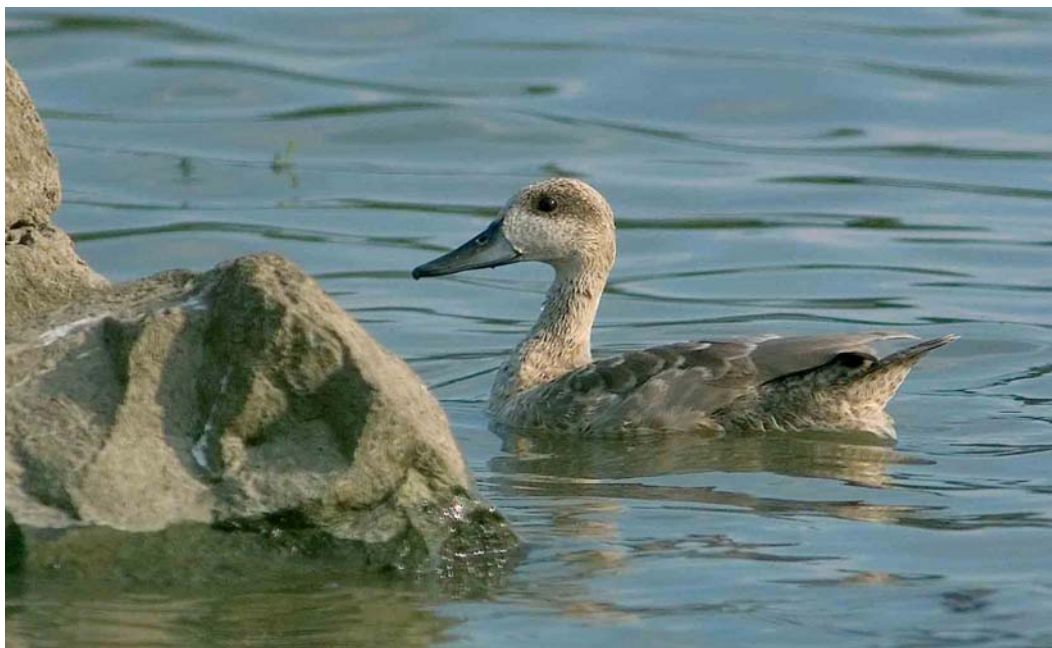
198 Marmereend / Marbled Duck Marmaronetta angustirostris , Pannerden, Gelderland, 15 augustus 2004

KOP Licht grijsbruin tot zandkleurig met contrasterende bruine vlek, donkerst rond oog, vervagend naar achteren en doorlopend van voor oog tot aan achterhoofd en van ooghoogte tot aan kruin. Centrale kruin zeer licht zandgrijs met fijne zwarte streepjes; zijkruin, achterhoofd, nek en hals licht zandkleurig. Voorhoofd, teugel, oorstreek, kin en keel ('gezicht') zeer licht zandgrijs (in fel zonlicht wit lijkend) met fijne donkere streepjes met name op oorstreek, contrasterend met bruine vlek rond oog. BOVENDELEN Mantel- en schouderveren bruin met vrij smalle, lichtcrème- tot zandkleurige top; met hard zonlicht opvallend licht en effen lijkend maar bij gematigde belichting licht gevlekte bruine rug tonend. Bovenstaartdekveren bruin met smalle lichtzandkleurige tot crèmekleurige zoom, op goede