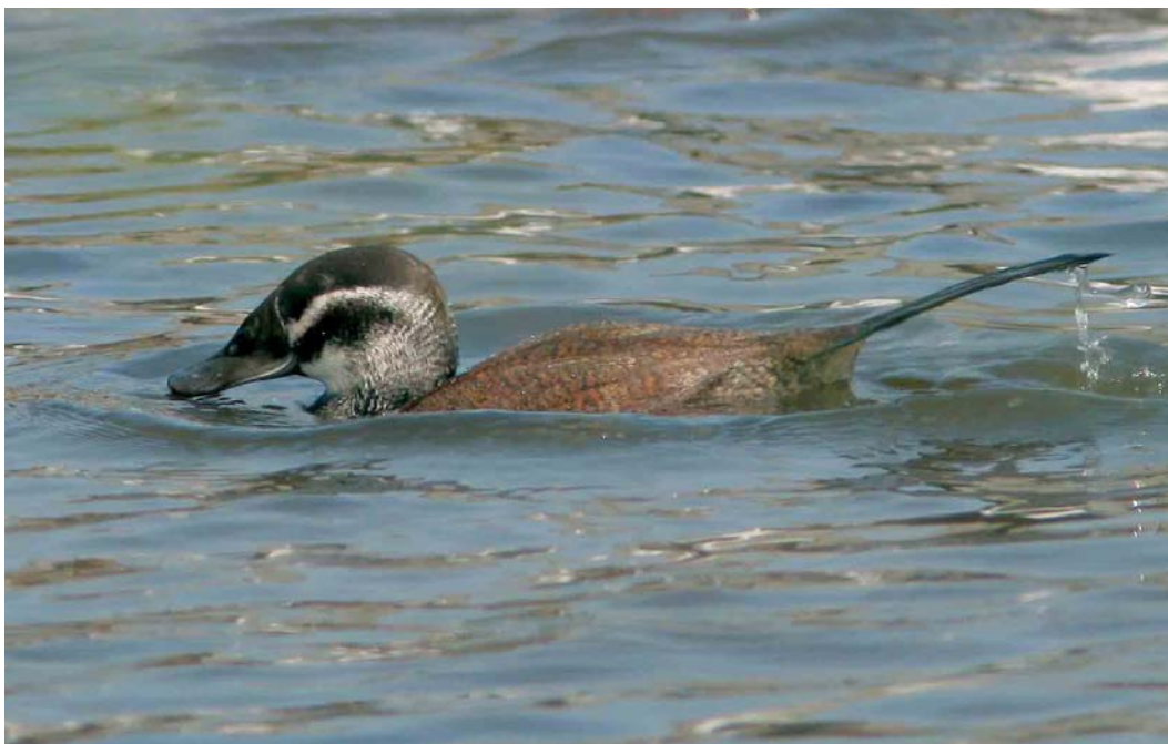
245 Witkopeend / White-headed Duck Oxyura leucocephala , vrouwtje, Starrevaart, Leidschendam, Zuid-Holland, 6 april 2007