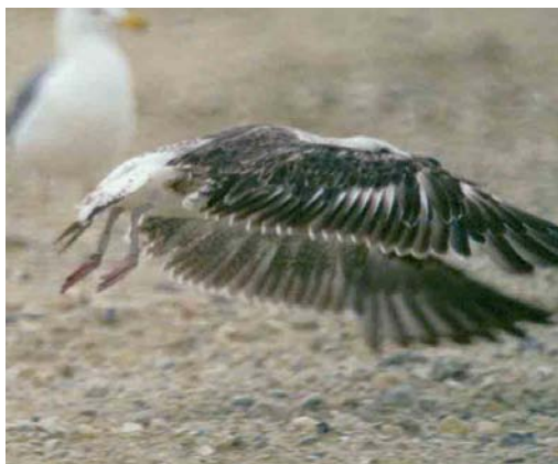
119 Baltic Gull / Baltische Mantelmeeuw Larus fuscus fuscus (CJC9), second calendar-year, Erasmusgracht, Amsterdam, Netherlands, 25 May 2006. This bird shows restricted moult for fuscus : many lesser and greater coverts are still worn juvenile feathers. 120 Baltic Gull / Baltische Mantelmeeuw Larus fuscus fuscus (CJC9), second calendar-year, Erasmusgracht, Amsterdam, Netherlands, 25 May 2006 121 Baltic Gull / Baltische Mantelmeeuw Larus fuscus fuscus (CJC9), second calendar-year, Erasmusgracht, Amsterdam, Netherlands, 25 May 2006. Note second-generation inner primaries (p1-4). All tail-feathers, secondaries and outer primaries (p5-10) are retained juvenile feathers. 122 Baltic Gull / Baltische Mantelmeeuw Larus fuscus fuscus , second calendar-year, Al Hadd, Bahrain, 5 March 1999. This bird had been colour-ringed in Finland. It is actively replacing wing-coverts, primaries and tail-feathers; all secondaries are still juvenile.

Second calendar-year Lesser Black-backed Gulls sensu lato observed in spring and summer in western Europe also show highly variable moult patterns. Winters (2006) used these patterns to reconstruct the moult sequence in juvenile/first-winter birds and deduced that first the tail-feathers are renewed, then the secondaries and finally the primaries. This sequence is different from the first complete moult taking place in the summer of the second calendar-year, in which the inner primaries are replaced first. Only when approximately half of the primaries have been renewed will the replacement of rectrices and secondaries begin. Extrapolating the moult patterns of birds he observed in the Netherlands to fuscus , Winters (2006) concluded that