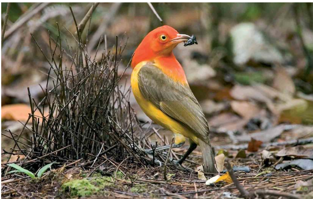
123 Flame Bowerbird / Oranje Prieelvoegel Sericulus aureus ardens , immature male, Kiunga, Western Province, Papua New Guinea, 20 October 2006 ( Otto Plantema )