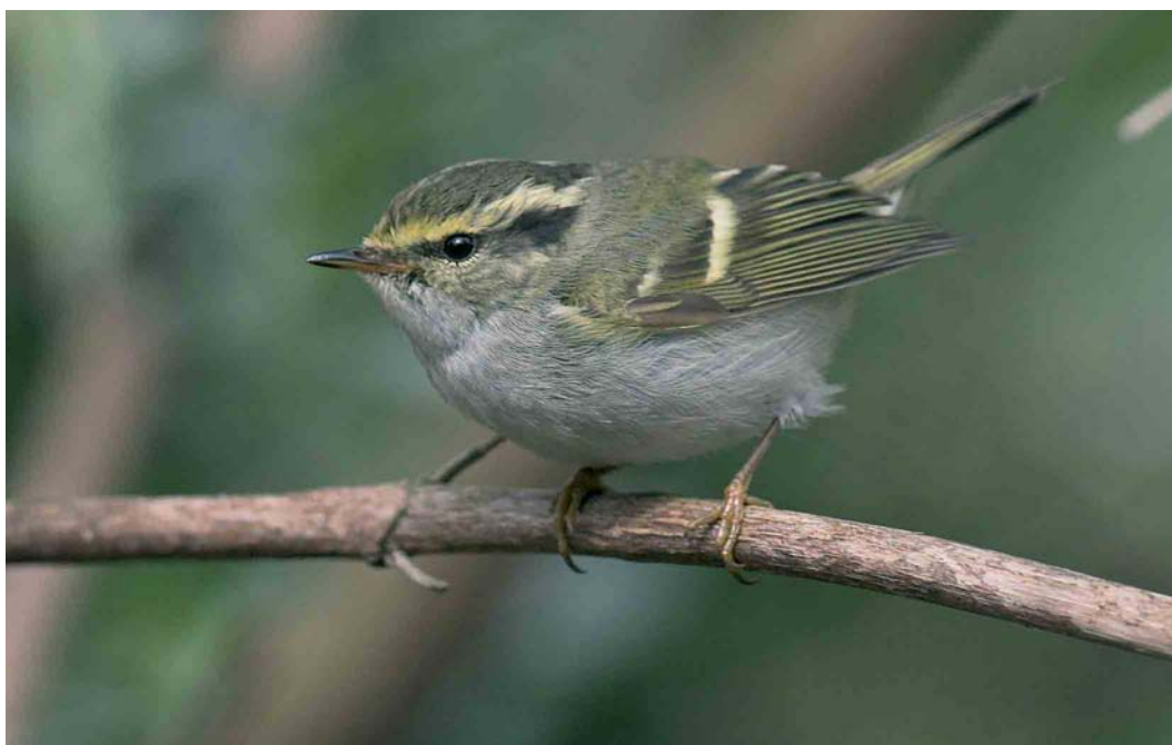
170 Pallas' Boszanger / Pallas's Leaf Warbler Phylloscopus proregulus , Kattenbroek, Amersfoort, Utrecht, 4 maart 2007 (Paul Cools)