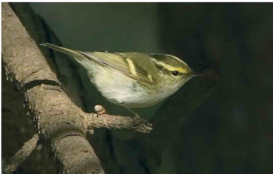
169 Pallas' Boszanger / Pallas's Leaf Warbler Phylloscopus proregulus , Driehuis, Noord-Holland, 3 februari 2007 (Jacob Garvelink)