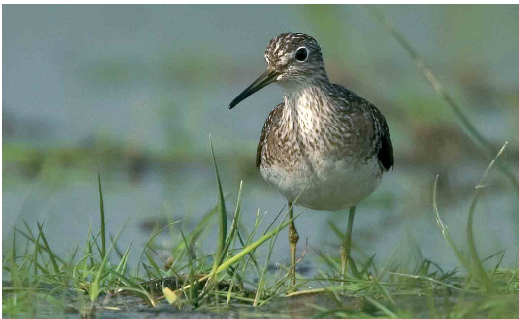
105-106 Amerikaanse Bosruiter / Solitary Sandpiper Tringa solitaria solitaria , Wissenkerke, Zeeland, 17 mei 2006 (Harvey van Diek)

Amerikaanse Bosruiter bij Wissenkerke in mei 2006