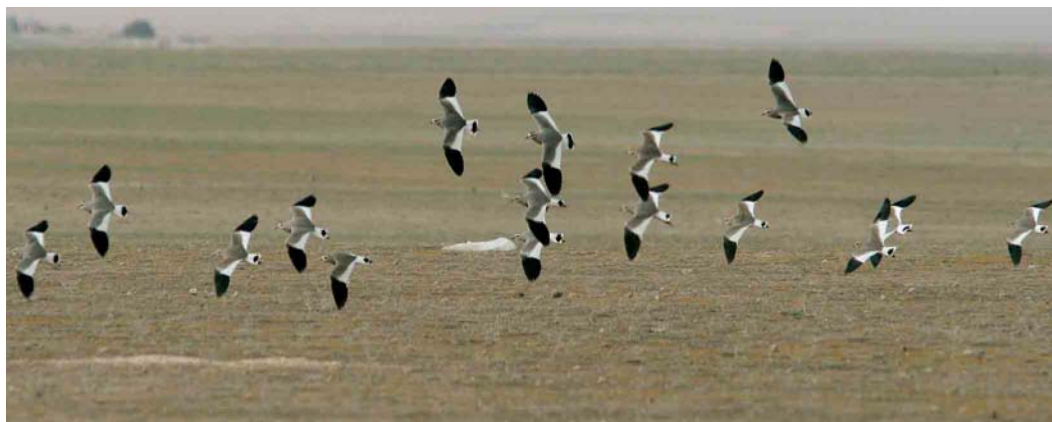
184 Steppekieviten / Sociable Lapwings Vanellus gregarius , Eiwa, Syrië, 24 februari 2007

SOCIABLE LAPWINGS During a survey by four Dutch and three Syrian birders in February 2007, unprecedented numbers of the globally threatened Sociable Lapwing Vanellus gregarius were discovered in the north of Syria. On 25 February, 1345 were counted at three sites, including 838 at Ar Ruweira rangeland reserve. A group of 113 was seen at a fourth site a few days later. On 6 March, after the expedition had left, local birders reported 1600 at Ar Ruweira rangeland reserve, and 615 across the border at Ceylanpinar, Turkey. On 9 March, 2100 were counted (Eiwa excluded on this date) and 737 in Turkey. This makes a total of at least 2837 birds in the area, which is more than even the most optimistic recent estimated world population (600-1800 birds). The area is considered a very important wintering or stop-over site for this species. Loss of steppe habitat for agriculture, intensive grazing and (foreign) hunting parties pose the main threats. According to local people, it has been seen here for many years and, in the past, in much larger numbers, usually remaining in mild winters.