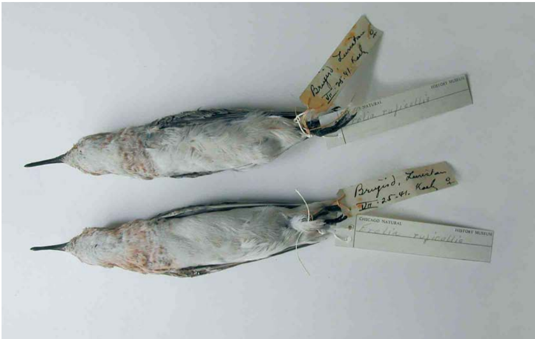
118 Red-necked Stints / Roodkeelstrandlopers Calidris ruficollis (collected at Borujerd, Lorestan, Iran, on 25 July 1941), Field Museum of Natural History, Chicago, USA, August 2006

lengths are unusually short for Red-necked Stint (all comparisons with data in Cramp & Simmons 1983) but both specimens show abrasion to the primaries to a greater or lesser degree. In contrast, both tarsus and culmen lengths are outside the range of Little, and the bills of the Iranian birds are deeper over their entirety than in typical Little. The following plumage features also point to Red-necked: no trace of pale 'tram-lines' on the mantle; rufous on the upperparts virtually confined to the scapulars (other than the head); and contrasting grey wing-coverts (cf Beaman & Madge 1998).