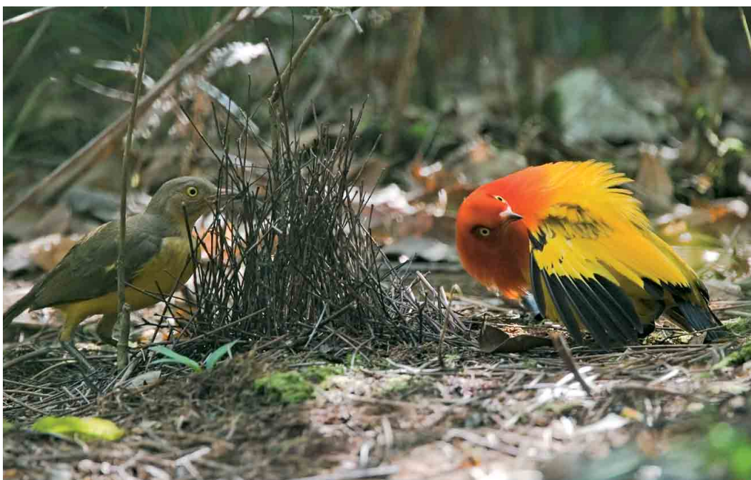
124 Flame Bowerbirds / Oranje Prieelvogels Sericulus aureus ardens , dancing male and female, Kiunga, Western Province, Papua New Guinea, 20 October 2006 ( Otto Plantema )