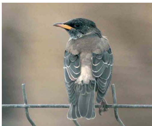
138 Eastern Black Redstart / Oosterse Zwarte Roodstaart Phoenicurus ochruros phoenicuroides , male, Jomfruland, Kragerø, Telemark, Norway, 21 January 2007 ( Øivind W Johannessen ) 139 Desert Wheatear / Woestijntapuit Oenanthe deserti , first-year male, Irlam, Greater Manchester, England, 9 March 2007 ( Steve Young/Birdwatch ) 140 Citrine Wagtail / Citroenkwikstaart Motacilla citreola , Aiguamolls de l'Empordà, Girona, Spain, 18 January 2007 ( Ricard Gutiérrez ) 141 Rose-coloured Starling / Roze Spreeuw Sturnus roseus , first-winter, Llobregat delta, Barcelona, Spain, 12 February 2007 ( Ferran López )

Bute, Argyll, from 28 January into March. In København, Denmark, first-winter females were present at Østerbro from 26 January to at least 28 February and at Nivå from 3 February into March. In Finland, a male remained at Oulu from February into March. In England, a first-winter American Robin T migratorius stayed at Bingley, West Yorkshire, from early January through February. The number of singing Cetti's Warblers Cettia cetti in the Netherlands increased to 25 in 2006; the highest total ever was a presumed 60 pairs in 1977 but severe winters wiped it out and not a single bird was recorded in 1986-88 and 1991-92, 1997 and 1999. Similarly, the number of singing Zitting Cisticola Cisticola juncidis has been on the increase again, with in 2006 25 in Saefinghe, Zeeland, alone. Three Paddyfield Warblers Acrocephalus agricola were found in Catalunya, Spain, including two