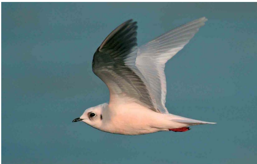
144 Ross's Gull / Ross' Meeuw Rhodostethia rosea , adult, Douarnenez, Finistère, France, 21 January 2007 ( MatthieuVaslin )