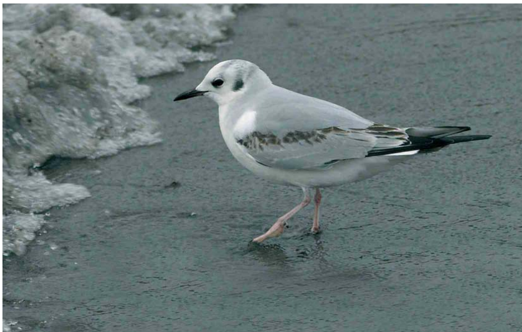
145 Bonaparte's Gull / Kleine Kokmeeuw Larus philadelphia , first-winter, Whitehead, Antrim, Northern Ireland, 15 January 2007 ( Anthony McGeehan )