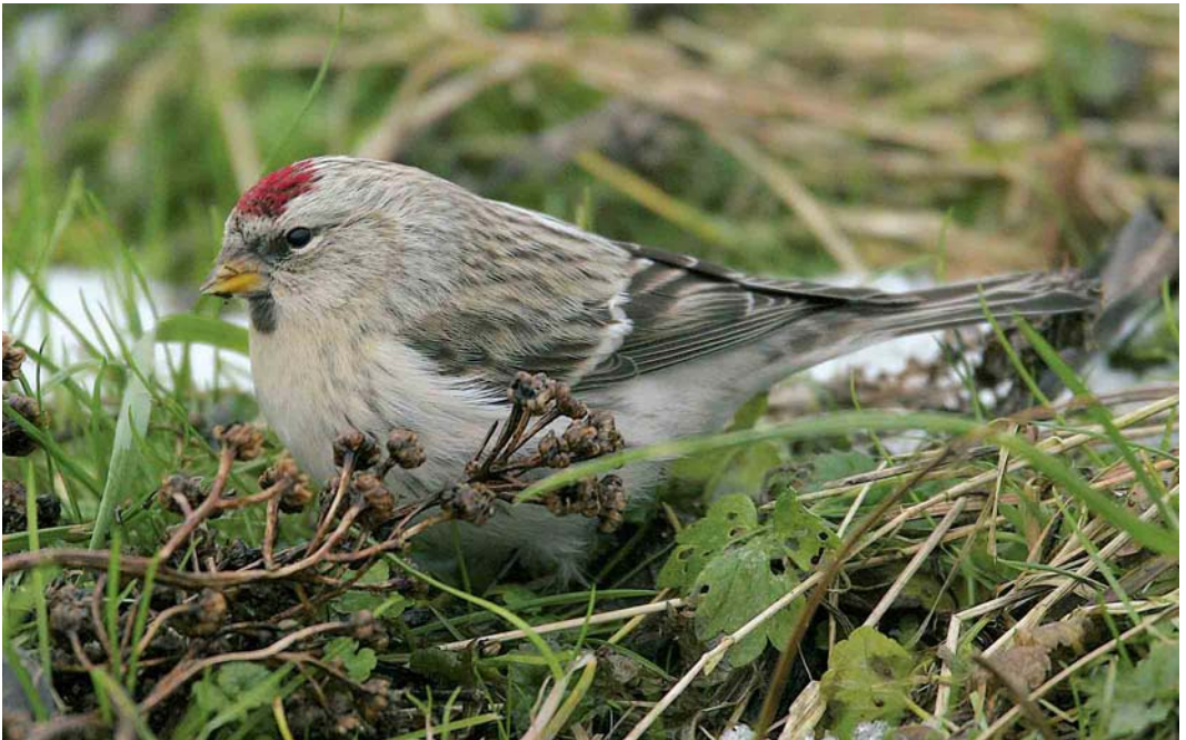
85 Witstuitbarmsijz / Arctic Redpoll Carduelis hornemanni , Zutphen, Gelderland, 31 december 2005