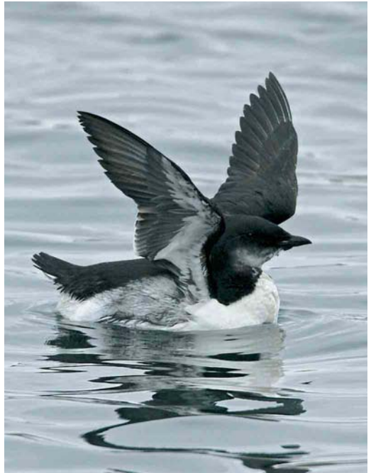
32 Kumlien's Gull / Kumliens Meeuw Larus glaucooides kumlieni , Nimmo's Pier, Galway, Ireland, 2 January 2006 33 Brännich's Murre / Kortbekzeekoet Uria lomvia , Lerwick harbour, Shetland, Scotland, November 2005 34 Forster's Tern / Forsters Stern Sterna forsteri , Cabo da Praia, Terceira, Azores, 22 November 2005