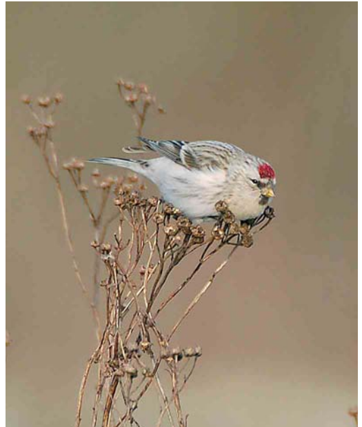
84 Witstuitbarmsijz / Arctic Redpoll Carduelis hornemanni , Zutphen, Gelderland, 29 december 2005 (Laurens B Steijn)

merkt in het noorden van het land. Op 20 november werd een groep van 11 Witkopstaartmezen Aegithalos caudatus caudatus gevangen en geringd op Schiermonnikoog, Friesland. In december waren er groepjes te Den Haag, Zuid-Holland, van 15 tot 22 december (maximaal zes) en bij het Paterswoldsemeer, Groningen, van 12 tot 26 december (ten minste 10). Tot ver in december werd nog een vijftal Taigaboomkruipers Certhia familiaris doorgegeven. Uitzonderlijk laat waren de Grauwe Klauwieren Lanius collurio op 1 en 13 november bij Den Haag en op 14 november bij het Kennemermeer, Noord-Holland. Notenkrakers Nucifraga caryocatactes werden waargenomen op 3 november in Haren, Groningen, op 10 november in Vlaardingen, Zuid-Holland, op 9 december bij Den Helder en op 22 december in Badhoevedorp, Noord-Holland. Een Roze Spreeuw Sturnus roseus verbleef nog tot 13 november bij Oudemirdum. Een andere vloog op 10 november over Vlissingen, Zeeland. Vanaf midden november tot in januari liet een eerstejaars zich bekijken te Wassenaar, Zuid-Holland. In november tekende zich een massieve invasie van Grote Barmsijzen Carduelis flammea af. Vele 1000en werden gemeld en geringd, vooral op 13 en 14 november en in mindere mate tussen 18 en 22 november. In Meijndel, Zuid-Holland, werd op 13 november een exemplaar met een Chinese ring gevangen. Er bleven grote groepen in december, zoals 350 op 24 december bij Zwolle. Met deze golf kwamen ook de meldingen van