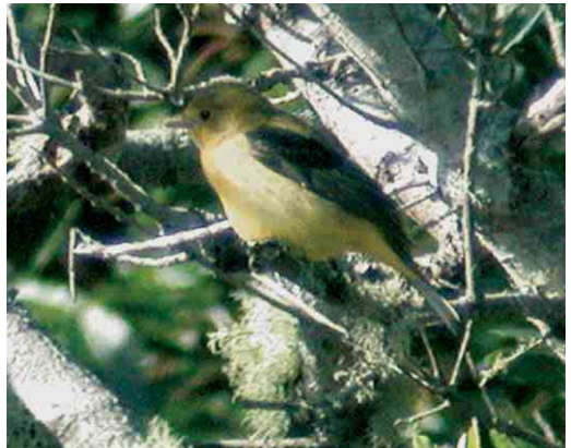
43 Upland Sandpiper / Bartrams Rüter Bartramia longicauda , Ponta Delgada, Flores, Azores, 31 October 2005 ( Frédéric Jiguet ) 44 Chimney Swift / Schoorsteengierzwaluw Chaetura pelagica , São Miguel, Azores, 28 October 2005 ( Frédéric Jiguet ) 45 Yellow-billed Cuckoo / Geelsnavelkoekoek Coccyzus americanus , Corvo, Azores, 19 October 2005 ( Peter Alfrey ) 46 Mourning Dove / Amerikaanse Treurduif Zenaida macroura , Corvo, Azores, 2 November 2005 ( Peter Alfrey ) 47 American Barn Swallow / Amerikaanse Boerenzwaluw Hirundo rustica erythrogaster , first-winter, Ponta Delgada, Flores, Azores, 30 October 2005 ( Frédéric Jiguet ) 48 Scarlet Tanager / Zwartvleugeltangare Piranga olivacea , first-winter male, Corvo, Azores, 28 October 2005 ( Peter Alfrey ) for all, cf Dutch Birding 27: 413, 424-425, 2005