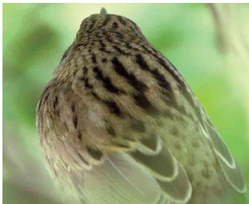
Mystery photograph II (May)

below carefully and identify the birds in the photographs. Solutions can be sent in three different ways: