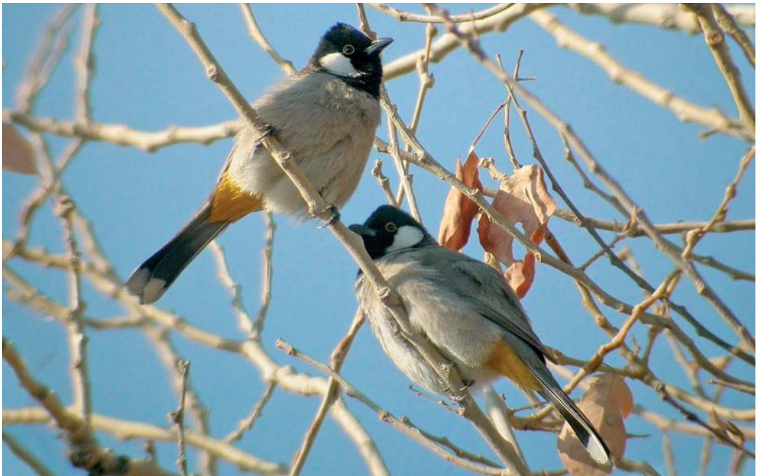
69 White-eared Bulbuls / Witoorbuulbuuls Pycnonotus leucotis , Deir ez-Zor, Syria, January 2006