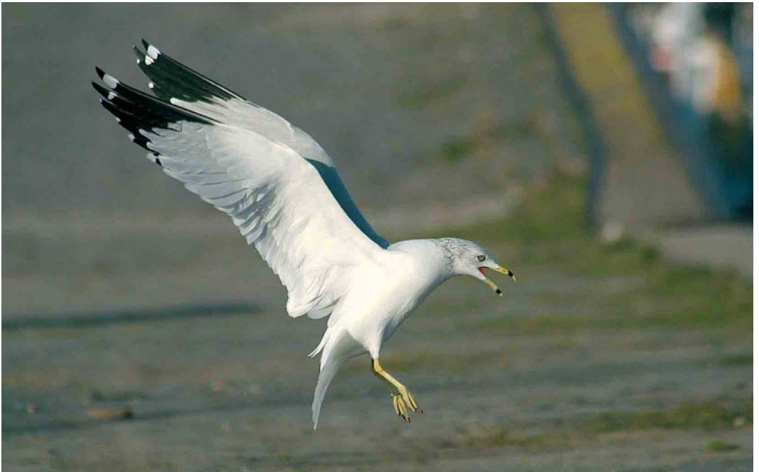
77 Ringsnavelmeeuw / Ring-billed Gull Larus delawarensis , adult, Tiel, Gelderland, 9 januari 2006