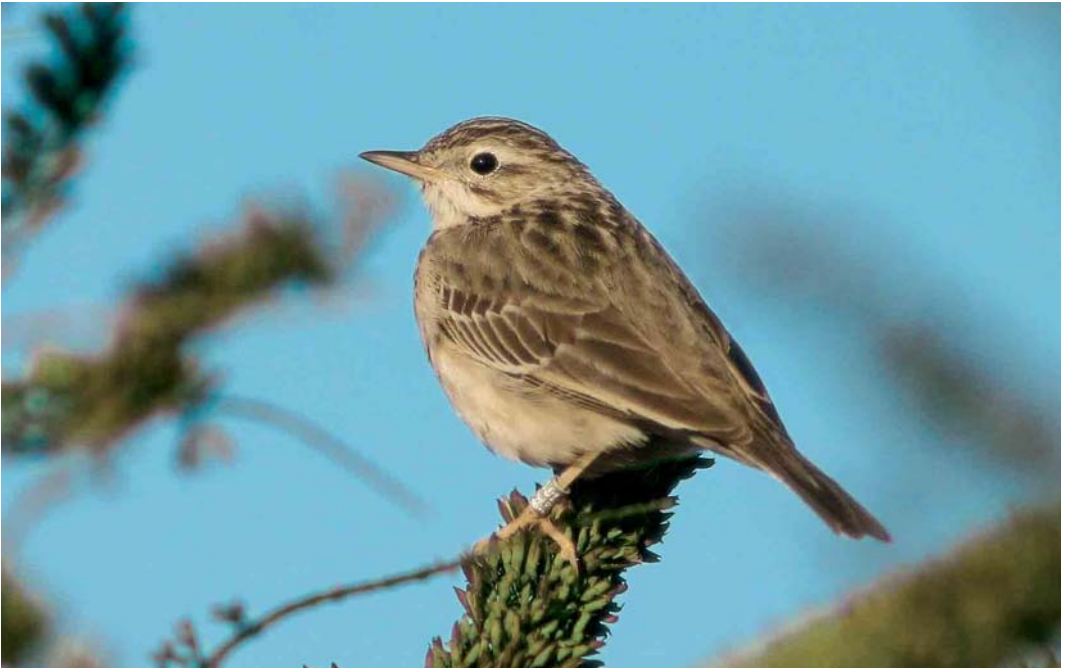
90 Mongoolse Pieper / Blyth's Pipit Anthus godlewskii , Oostende, West-Vlaanderen, 21 november 2005