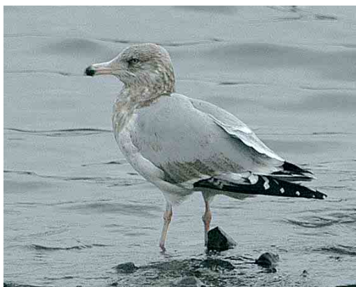
59 Little Swift / Huisgierzwaluw Apus affinis , Overstrand, Norfolk, England, 13 November 2005 cf Dutch Birding 27: 413, 2005 60 Grey Hypocolius / Zijdestaart Hypocolius ampelinus , adult male, Ghanatut, Abu Dhabi, United Arab Emirates, 4 January 2006 61 Dougall's Tern / Dougalls Stern Sterna dougallii , adult, Funchal, Madeira, 14 December 2005 62 Hume's Leaf Warbler / Humes Bladkoning Phylloscopus humei , Ouessant, Finistère, France, 8 January 2006 63 Lesser Sand Plover / Mongoolse Plevier Charadrius mongolus , Rewa, Hel peninsula, Poland, 30 December 2005 64 American Herring Gull / Amerikaanse Zilvermeeuw Larus smithsonianus , third-winter, Nimmo's Pier, Galway, Ireland, 2 January 2006