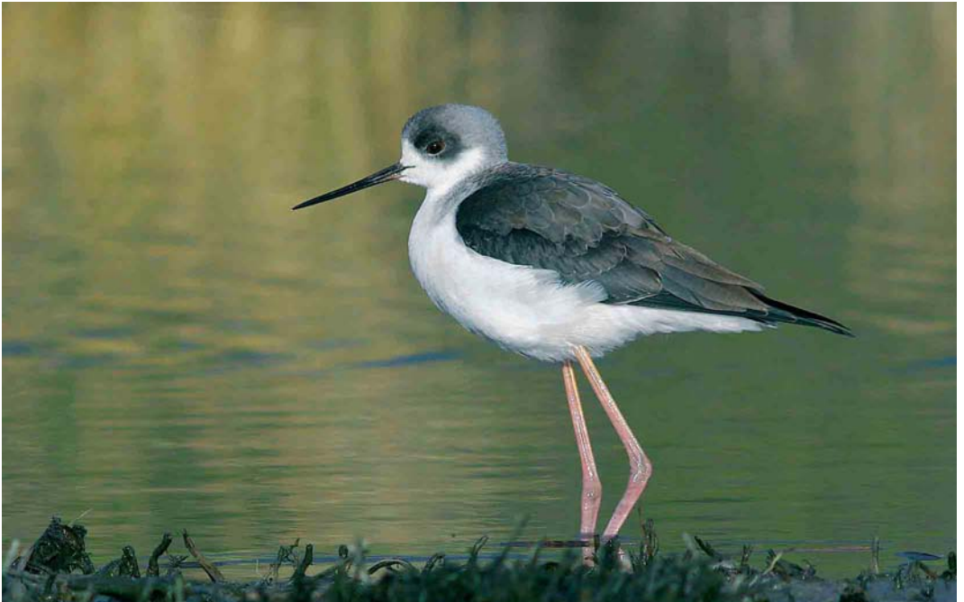
76 Steltkluut / Black-winged Stilt Himantopus himantopus , eerstejaars, Holwerd, Friesland, 25 december 2005 (Jan Bisschop)