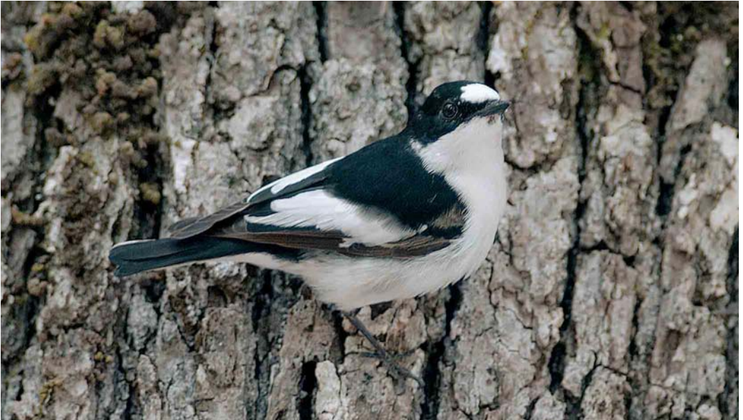
1 Atlas Flycatcher / Atlasvliegenvanger Ficedula speculigera , male, Beni M'tir, Jendouba, Tunisia, 3 May 2005 (René Pop)

Like Atlas Flycatcher, Iberian Pied Flycatcher is an allopatric taxon, coming into contact with other pied flycatcher taxa on migration only. The mitochondrial genetic distances between Semi-collared, Collared, nominate European Pied F h hypoleuca , Atlas and Iberian Pied Flycatchers are all of the order of 3-4%, apart from nominate European Pied and Iberian Pied which are c 0.5%, close to the intra-taxon differences of 0.12-0.39% (Sangster et al 2004). The latter is somewhat surprising because Iberian Pied looks much more similar to Atlas than to nominate European Pied (cf Cramp & Perrins 1993, Mild 1993). Of all pied flycatchers, Semi-collared appears to be more dis-