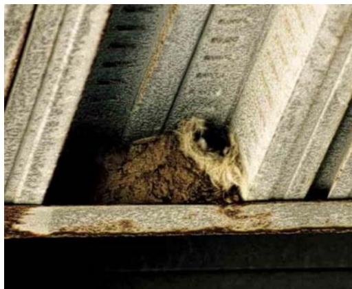
25 Nest of Little Swift / Huisgierzwaluw Apus affinis , Cádiz province, Andalucía, Spain, 14 June 2004 (Willem-Jan Fontijn)