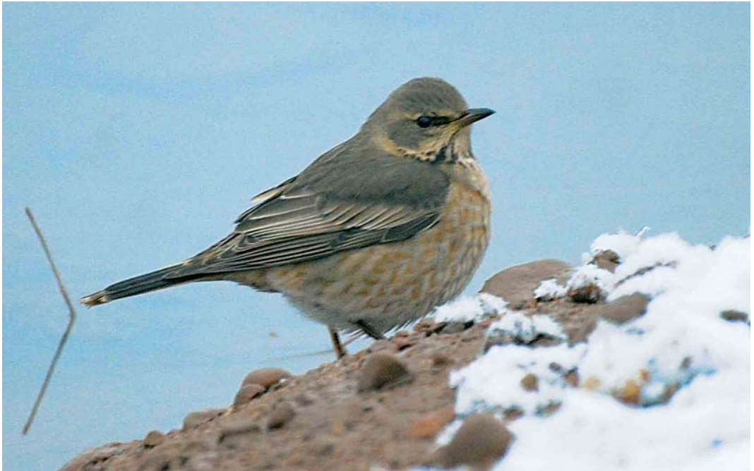
65 Naumann's Thrush / Naumanns Lijster Turdus naumanni , Kalajoki Keihäslahti, Finland, 7 December 2005