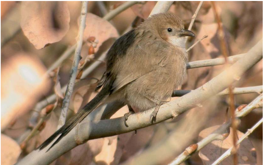
70 Iraq Babbler / Iraakse Babbelaar Turdoides altirostris , Mheimideh, Syria, January 2006