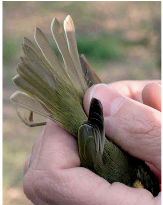
27 Eastern Crowned Warbler / Kroonboszanger Phylloscopus coronatus , Happy Island, Hebei, China, May 2005 (Nils van Duivendijk). Note that t4-6 show white fringes.

By now, we have gone through all Phylloscopus species depicted in the most commonly