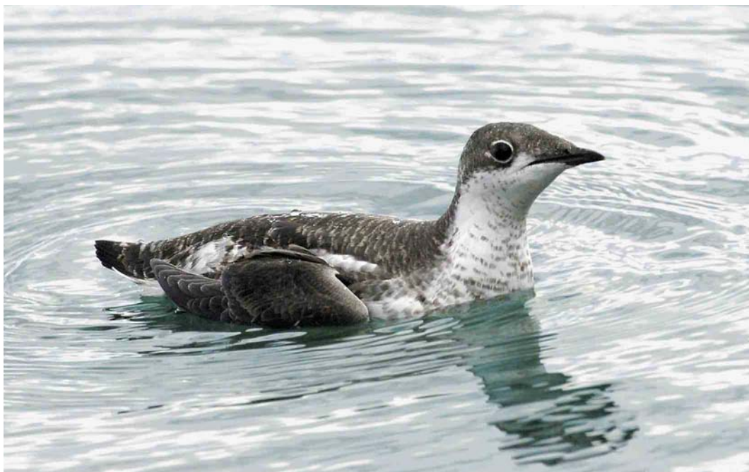
518 Long-billed Murrelet / Aziatische Marmerralke Brachyramphus perdix , Dawlish Warren, Devon, England, 12 November 2006 (Rebecca Nason)