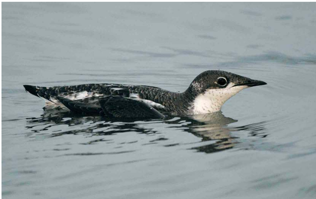
517 Long-billed Murrelet / Aziatische Marmerralke Brachyramphus perdix , Dawlish Warren, Devon, England, 11 November 2006