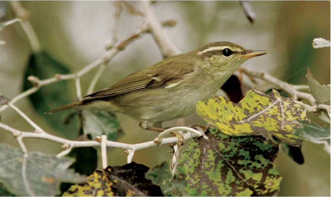
584 Noordse Boszanger / Arctic Warbler Phylloscopus borealis , Heist, West-Vlaanderen, 25 september 2006 (Koen Verbanck)