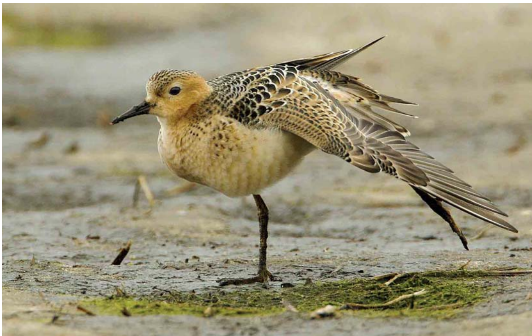
556 Blonde Ruiters / Buff-breasted Sandpiper Tryngites subruficollis , juveniel, De Stolpen, Noord-Holland, 28 september 2006 557 Blonde Ruiters / Buff-breasted Sandpiper Tryngites subruficollis , juveniel, De Stolpen, Noord-Holland, 27 september 2006 558 Blonde Ruiters / Buff-breasted Sandpiper Tryngites subruficollis , juveniel, Slikken van Flakkee, Zuid-Holland, 13 september 2006