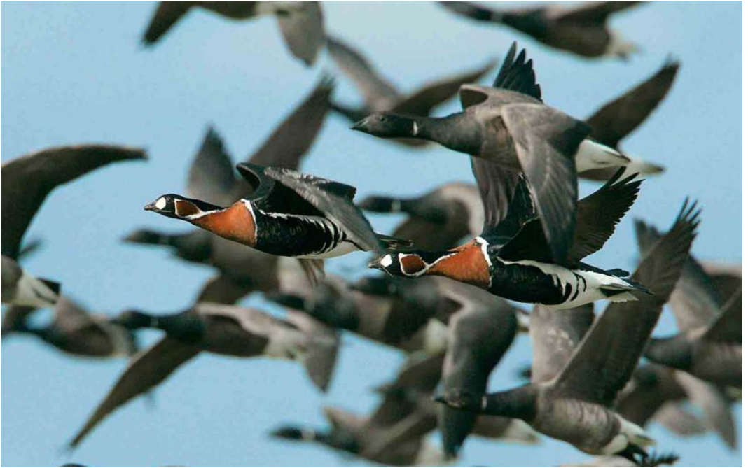
555 Roodhalsganzen / Red-breasted Geese Branta ruficollis , met Rotganzen / Dark-bellied Brent Geese B. bernicla , Terschelling, Friesland, 8 oktober 2006

Grauwe Pijlstormvogels Puffinus griseus waren schaars met als uitschieters bijvoorbeeld 36 op 7 oktober langs Texel, Noord-Holland, en 29 op 24 oktober langs Westkapelle. Tussen 26 september en 29 oktober werden slechts 30 Noordse Pijlstormvogels P. puffinus doorgegeven. Vale Pijlstormvogels P. mauretanicus werden vaker gemeld dan normaal met waarnemingen op 4 september langs Westkapelle, op 16 september langs Camperduin, Noord-Holland, op 26 september langs Scheveningen, Zuid-Holland, op 4 oktober langs Terschelling, Friesland, en op 7 oktober langs Texel, de Maasvlakte, Zuid-Holland, en Vlieland. Stormvogeltjes Hydrobates pelagicus werden opgemerkt op 4 oktober langs Terschelling en op 31 oktober langs Westkapelle. Slechts enkele Vale Stormvogeltjes Oceanodroma leucorhoa werden gemeld, met een uitzonderlijke waarneming op 18 oktober over de Looszerheide, Noord-Brabant. Dit exemplaar werd in vlucht gefotografeerd en pas achteraf door de verbaasde waarnemers gedeetermineerd. Kuifaalscholvers Phalacrocorax aristotelis werden gezien tot 8 oktober bij IJmuiden, op 1 september bij Den Helder, Noord-Holland, en op 13 en 20 oktober bij de Oosterscheldekering, Zeeland. Naar wordt aangenomen dezelfde Groene Reiger Butorides virescens als die in april-juni verbleef bij De Nieuwe Meer bij Amsterdam, Noord-Holland, werd van 14 tot 30 september (volgens lokale informatie al vanaf juli) met enige regelmaat gezien bij de Noorder IJ-plas bij Amsterdam; de vogel was nu in onvolwassen zomer-